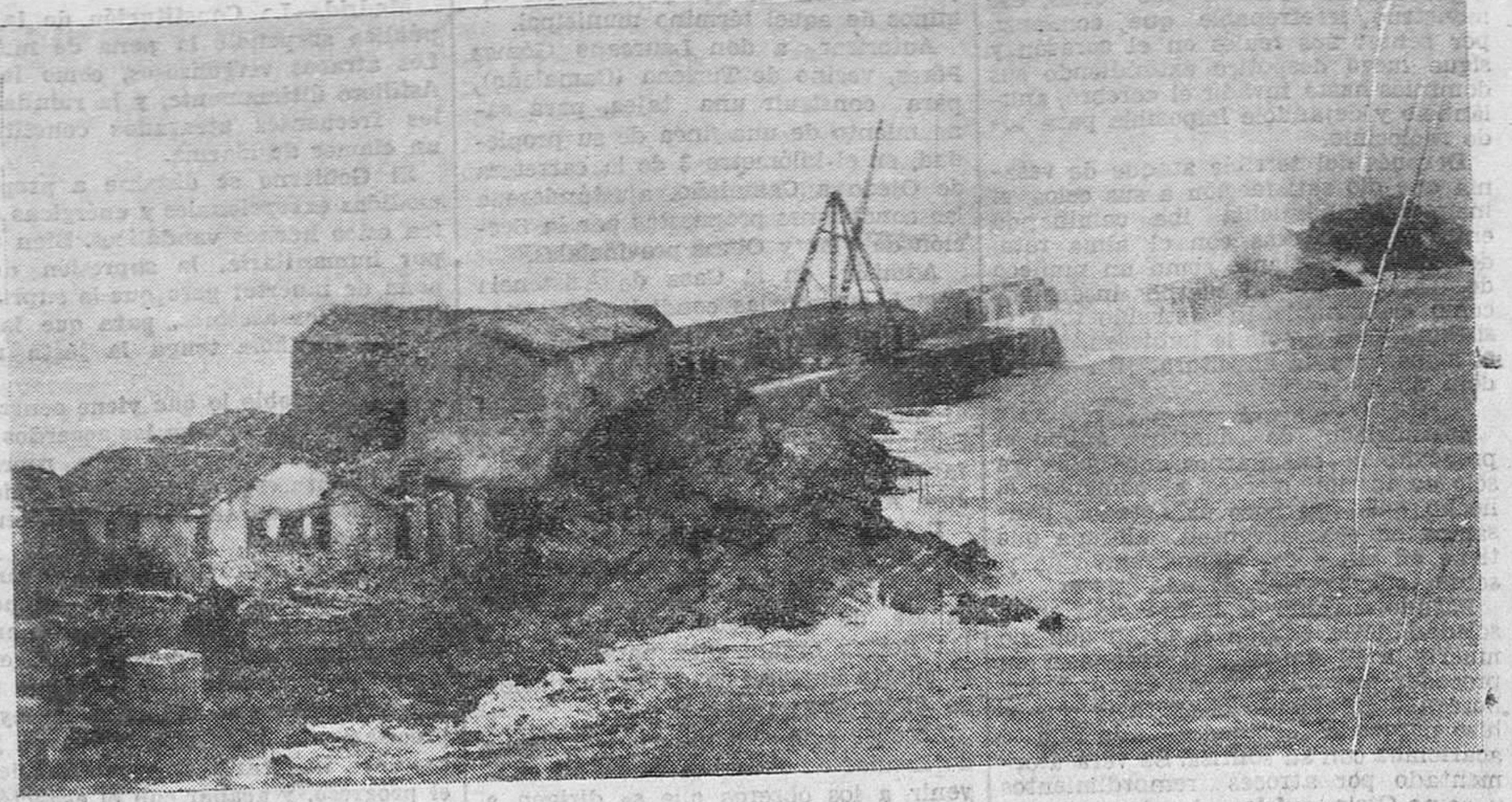
SAN VICENTE DE LA BARQUERA. — Interesantes obras que se llevan a efecto en el puerto de San Vicente de la Barquera, y que han resistido «valientemente» el embate de las olas durante los pasados temporales, sin que en ellas se haya registrado la menor avería.

La «bomba Smirnov» es un aparato combinado, que de una parte somete el corazón a irritaciones rítmicas con