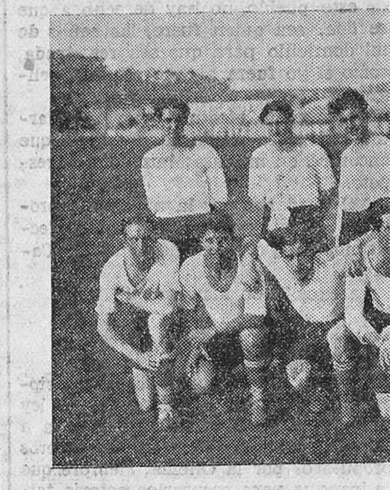
El Santona F. C., campeón «amateur» de Cantabria.

El equipo de Basket-Ball del Hispano-Cubano reta al del equipo militar del regimiento de Infantería número 23, para jugar un partido a una serie de tres juegos. LOS CLUBS MÓDESTOS El Sporting Club reta al Gimnástico Santanderino o al 14 de Abril para el domingo, a las tres, en Laredo. El Club Cantábrico reta al Infantería para mañana, jueves, a las tres, o al Florida. Se ha formado un equipo: Rosa, del Barrio Obrero, que reta al Sevilla