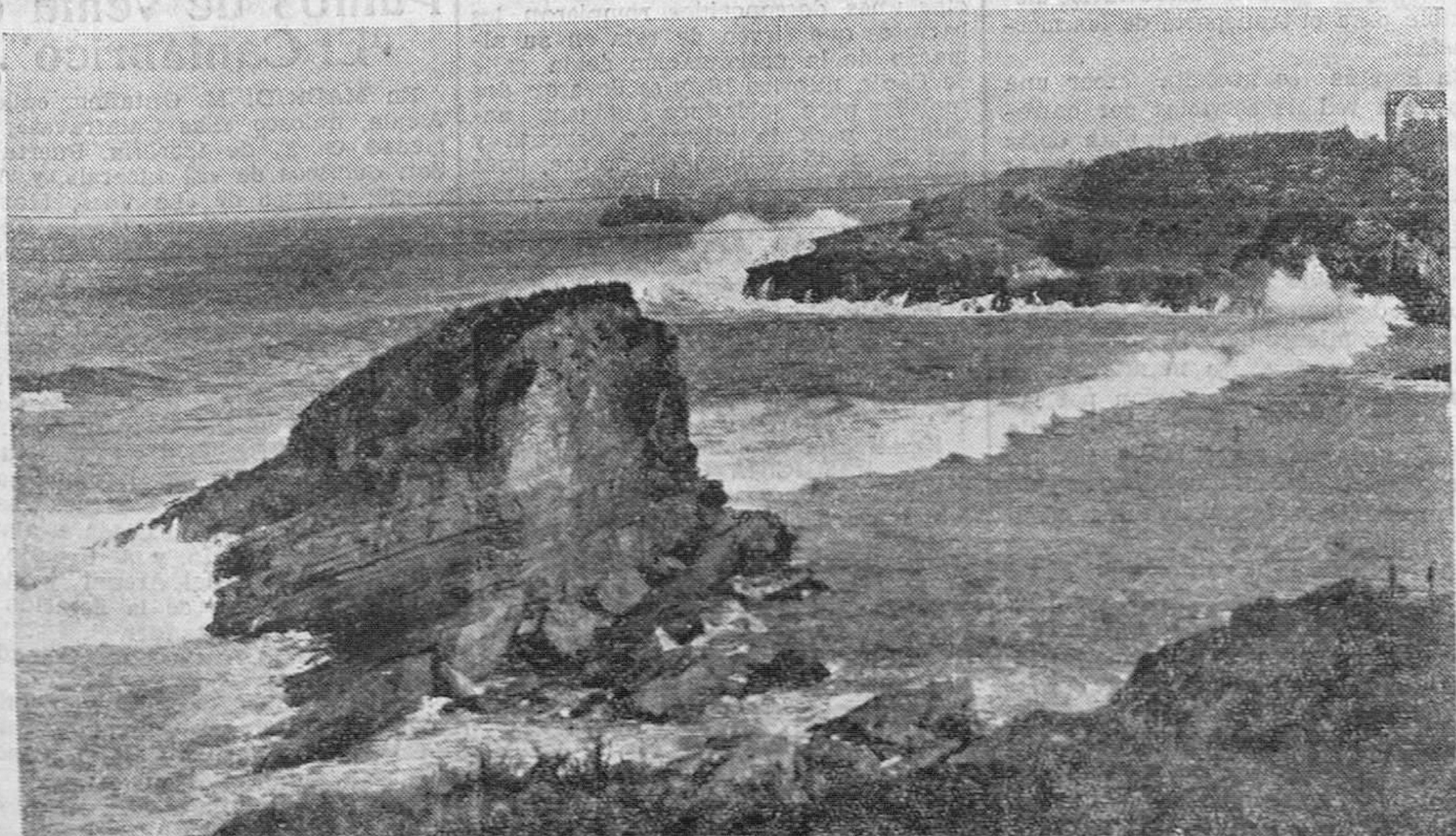
UN ASPECTO DE LA COSTA EN INVIERNO

F. CALATAYUD MÉDICO-DENTISTA F. PRÍNCIPE, 6. 1.