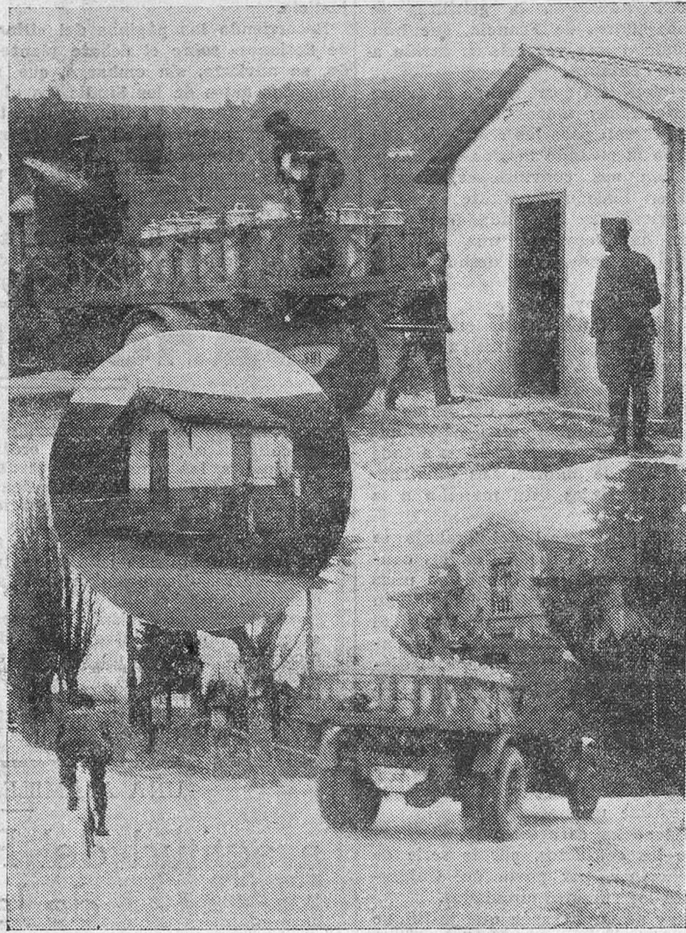
LA HUELGA LECHERA EN LA PROVINCIA. — Un camión, protegido por la Guardia civil, recogiendo las ollas del depósito de Farbayón. — Otro puesto del mismo pueblo, cerrado por la empresa recogedora. — Un camión de leche, a su paso por Renedo.

Quando en este país se cogía maiz todos los años, para cada casa lo que se necesitaba, si mal no recuerdo, valía el sacco de salvado a 2 y 3 pesetas, y que hoy vale más de 15; esto es bochornoso, y de estos negocios no tienen la culpa más que los campesinos, que han creído que las vacas iban a