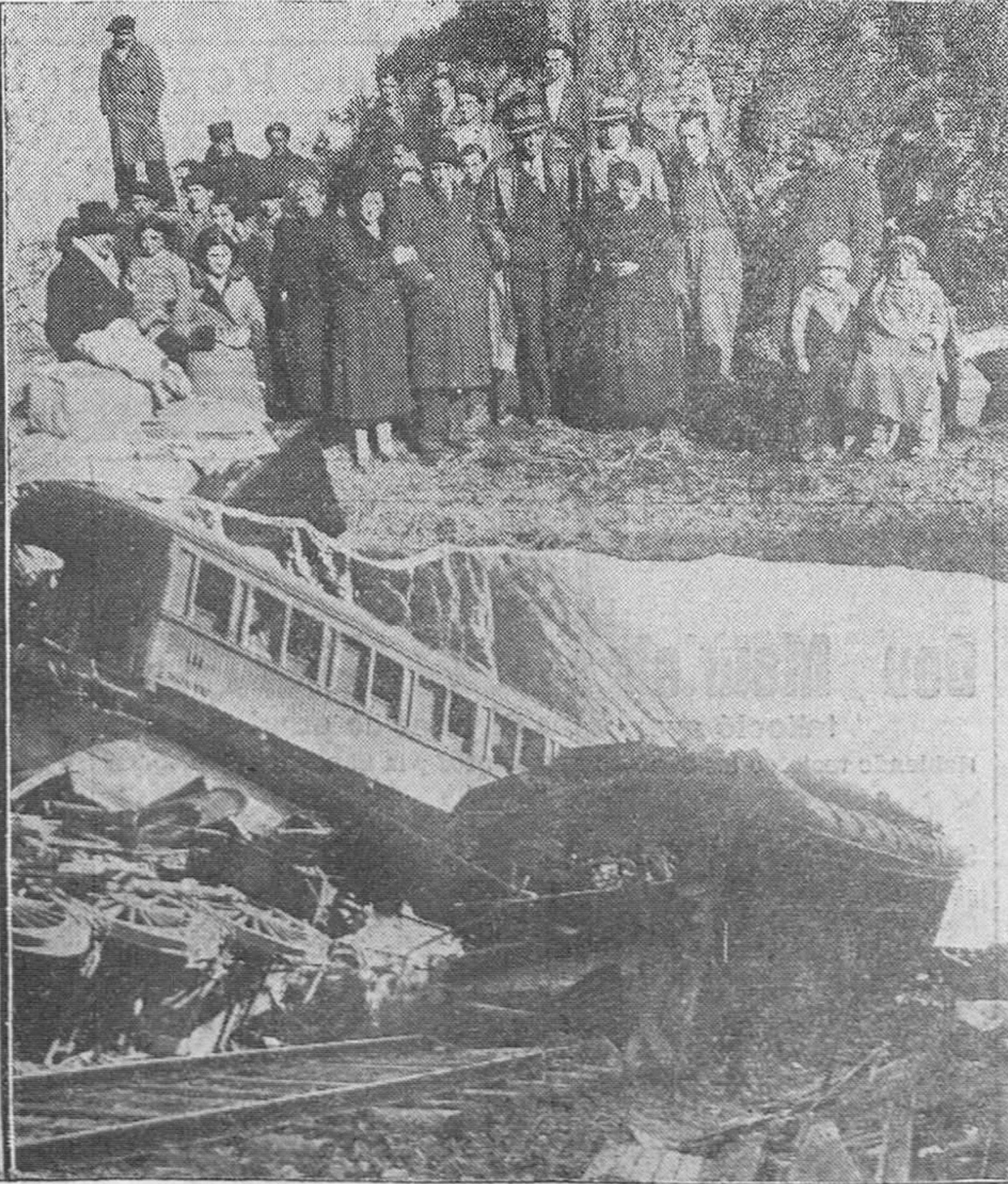
DEL ACCIDENTE FERROVIARIO. — Estado en que quedó el interior del segundo vagón de tercera, donde murió el guardia de Asalto y resultaron heridas veintidós personas. — Abajo, otro aspecto de la catástrofe. — Arriba, un grupo de supervivientes, entre los que figuran dos niños. — Abajo, otro aspecto de cómo quedaron los coches.