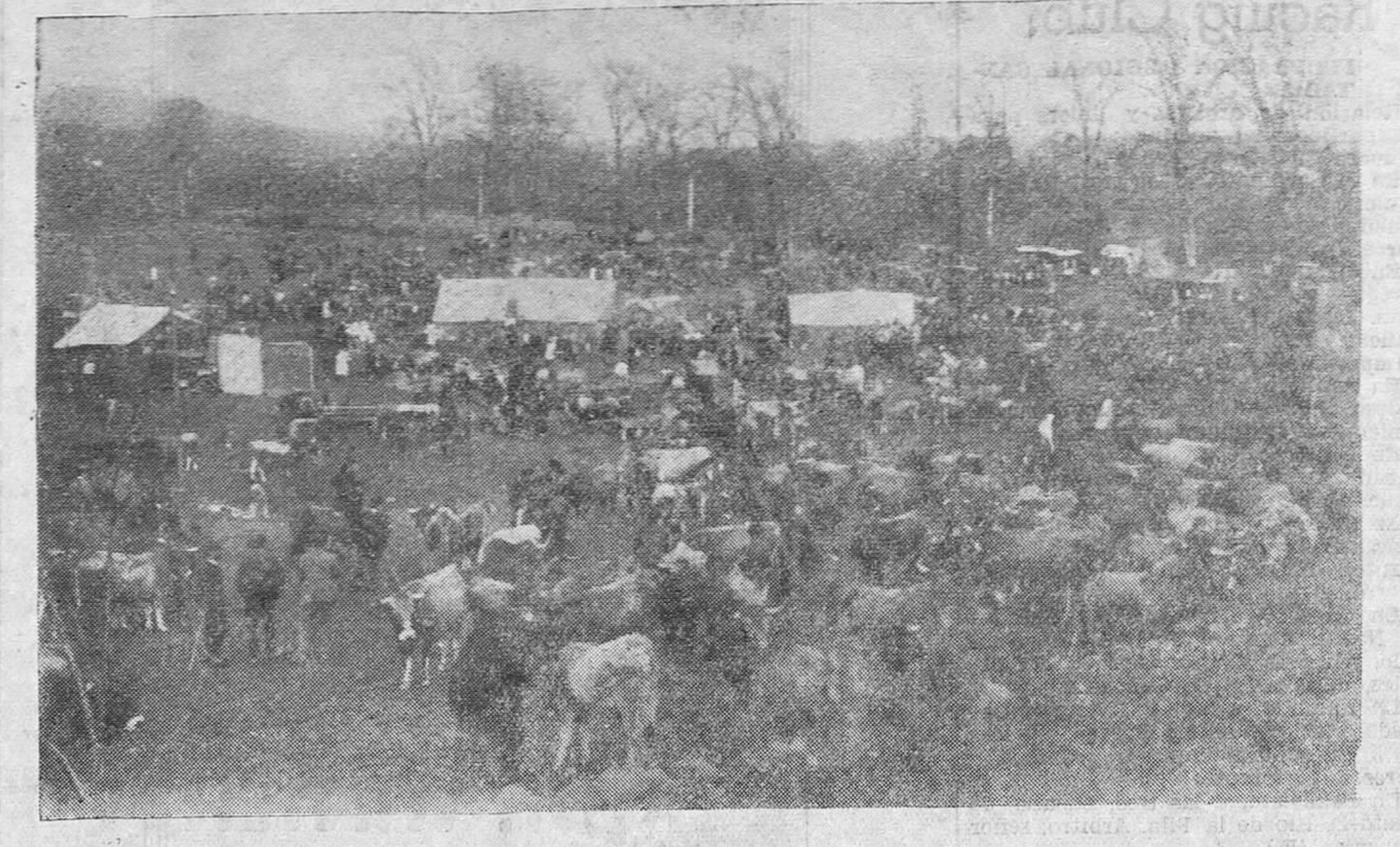
CABEZON DE LA SAL. -- Un detalle de la feria de ganados de Santa Lucia.

REALIZA TODA CLASE DE OPERACIONES BANCARIAS DEPARTAMENTO DE CAJAS DE ALQUILER