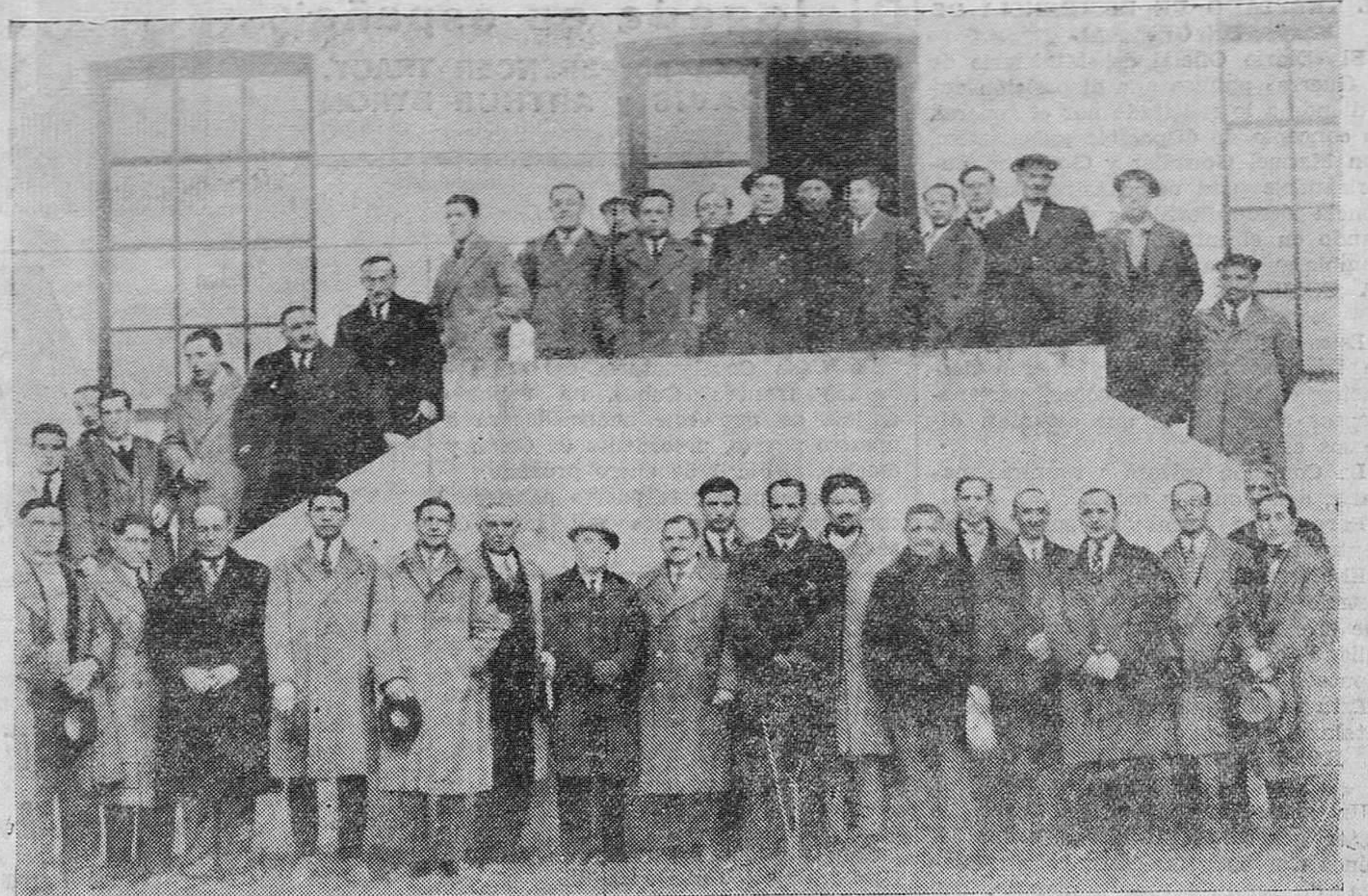
También los industriales pertenecientes a la UNION CANTÁBRICA COMERCIAL han visitado las nuevas instalaciones de LA ROSARIO, S. A. Estos señores han comprado 135.000 pastillas de jabón LA ROSARIO en cinco meses.