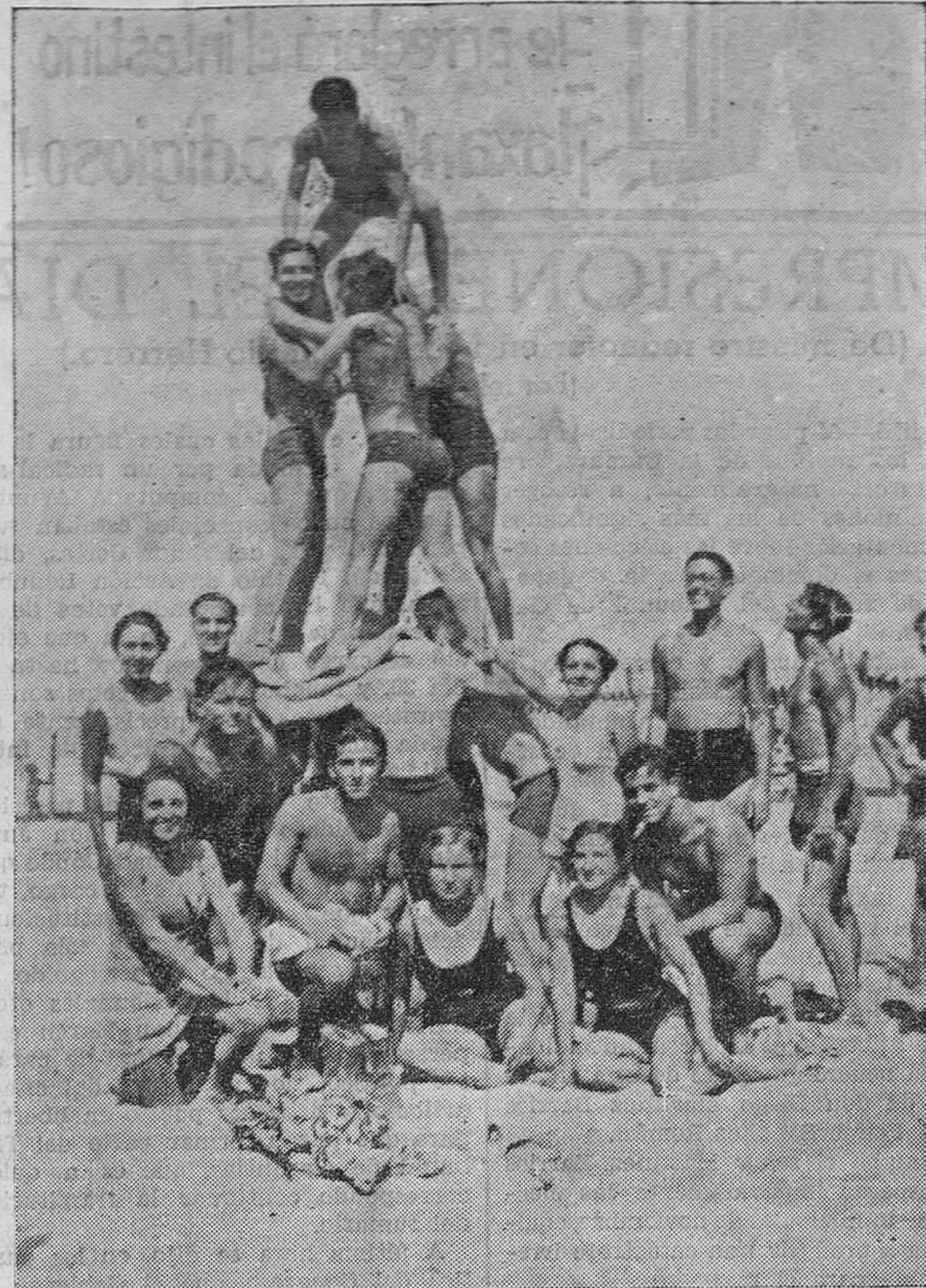
EN LA PLAYA DEL SARDINERO. — Un grupo de estudiantes universitarios, con otros de «La Barraca» y de C. E. U. S., haciendo la pirámide humana después del baño.

El nogal de Campó de Arriba—salvado como indica el señor De Cospedal, y de ello nos alegramos mucho—ha tenido más suerte en encontrar defensora que esos pobres campesinos de Valdearroyo y de Campó de Yuso, abandonados, en estos momentos de perspectivas tan desalentadoras, por las personas campurrianas que, con su prestigio y su autoridad, podrían esclarecer las equivocaciones existentes en torno al gran problema.