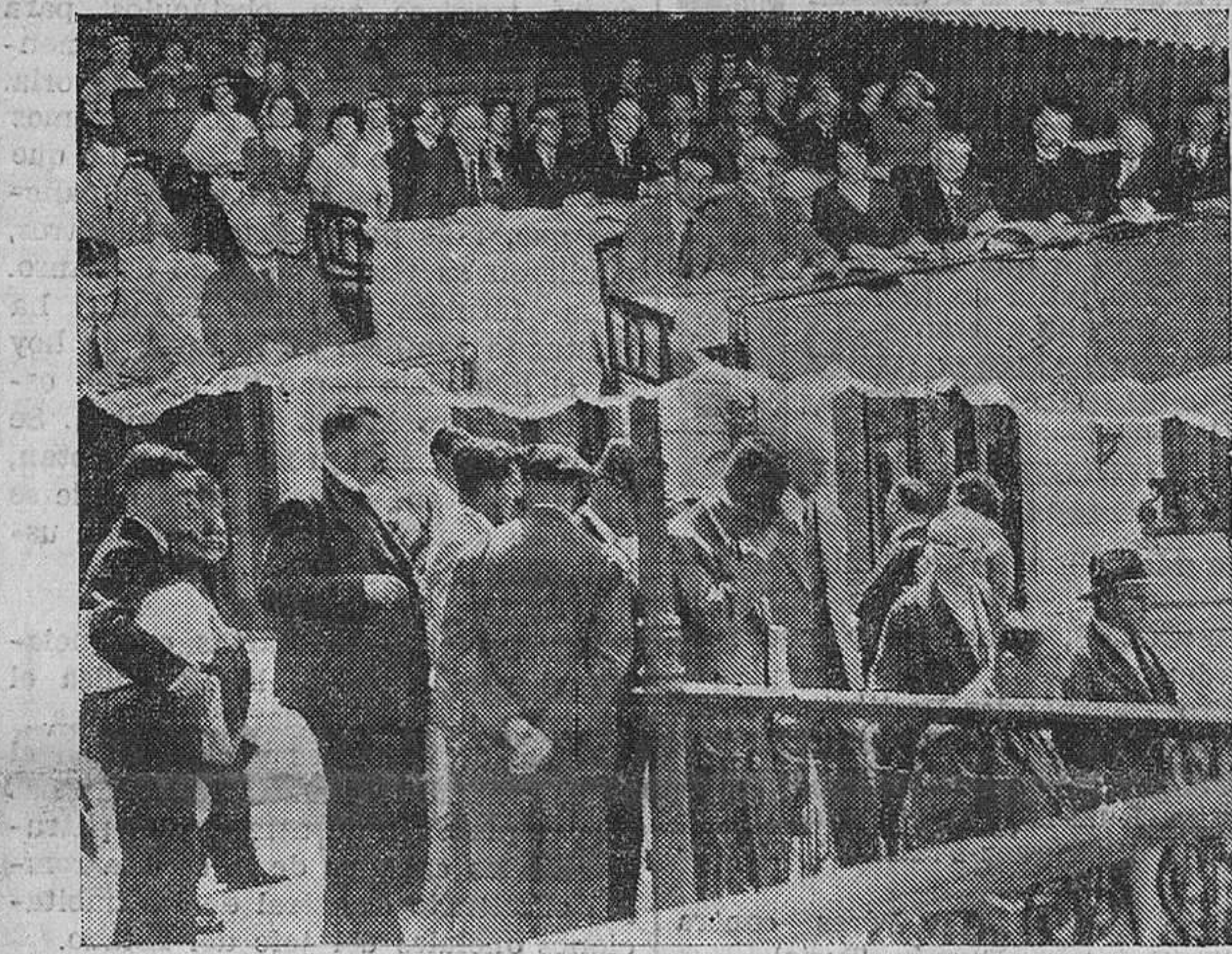
EL VI CONGRESO DE LA F. I. A. I. — Las mesas de los delegados, y éstos, al salir de una de las reuniones, que se celebran en el Gran Casino del Sardinero.

Ahora he visto la España que trabaja, la que se esfuerza por conquistar el alto puesto que la corresponde en el mundo, la España que realiza un gigantesco esfuerzo en el orden cul-