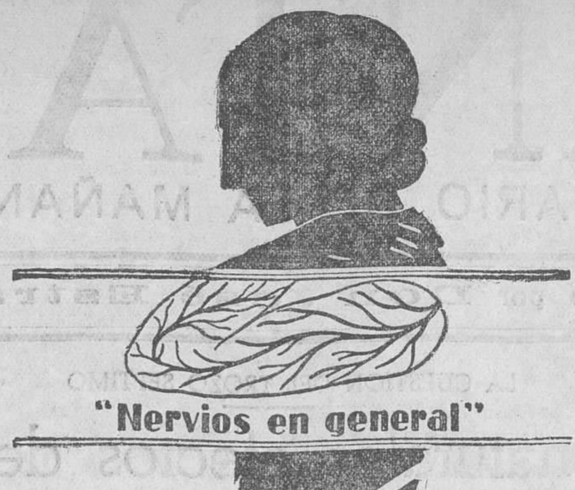
“Nervios en general”