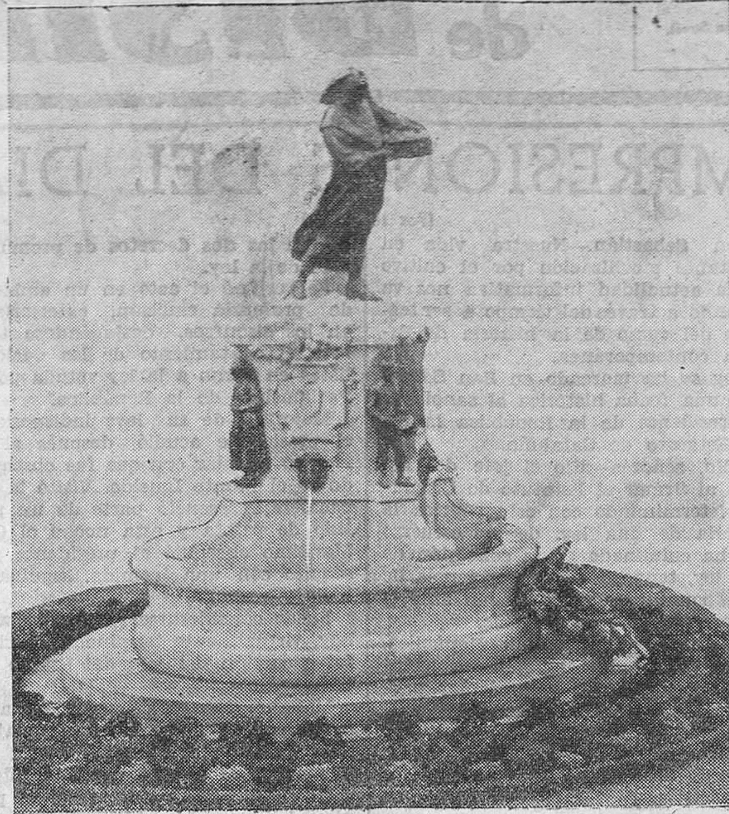
El magnífico y artístico monumento, obra del insigne escultor don Mariano Benlliure, que se inauguró hace unos días en Villaviciosa, en memoria del prestigioso industrial de aquella simpática población asturiana don Obisilio Fernández Pando.