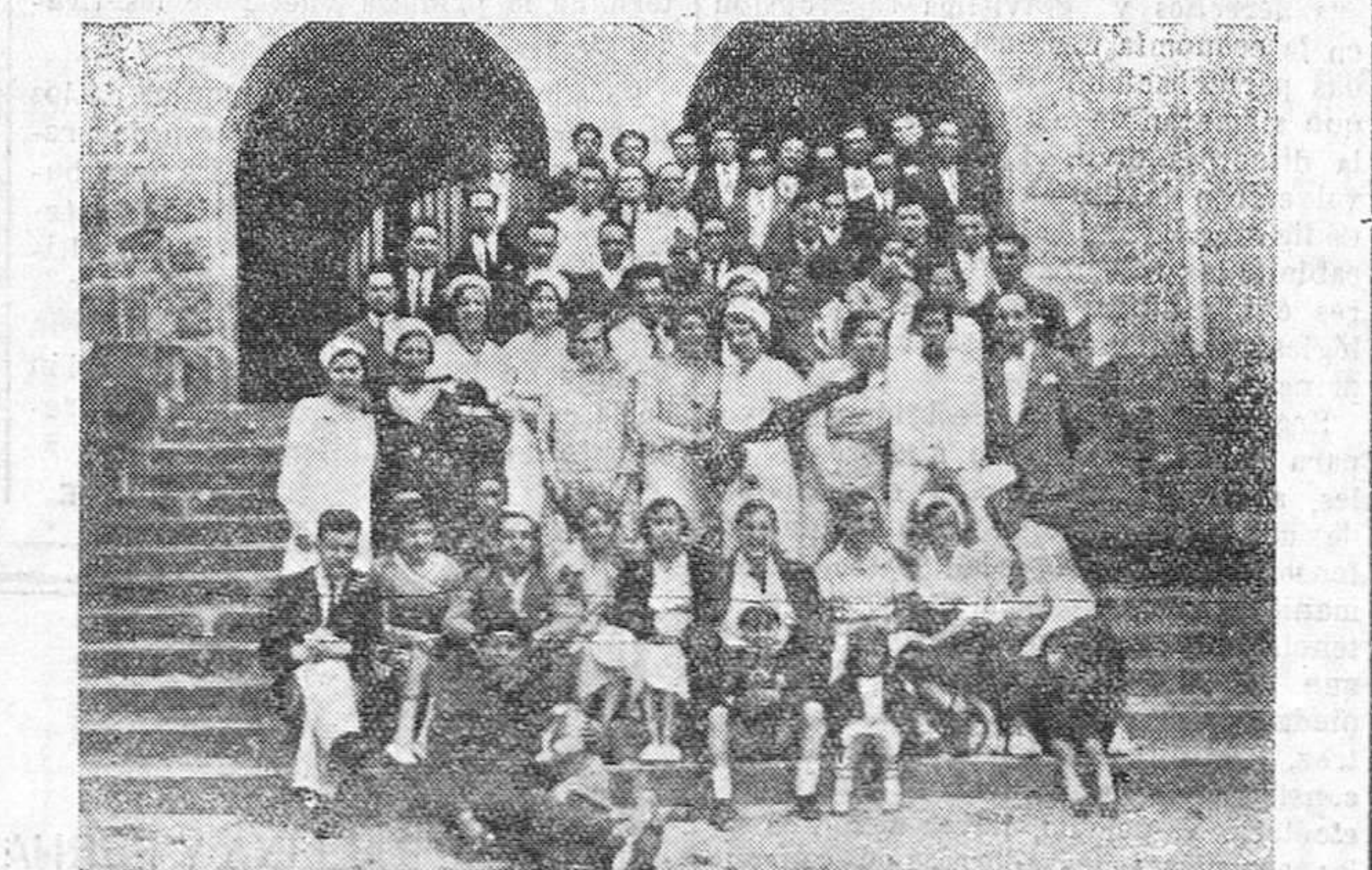
La Asociación de Dependientes de Comercio de Torrelavega, con sus compañeros de Reinosa, en la visita que los primeros hicieron el domingo último a la ciudad de Campoo,

En el mercado de raza porcina se notó algo más el alza en los precios. El de abastos se celebró con características de flojedad, pues el alcaide