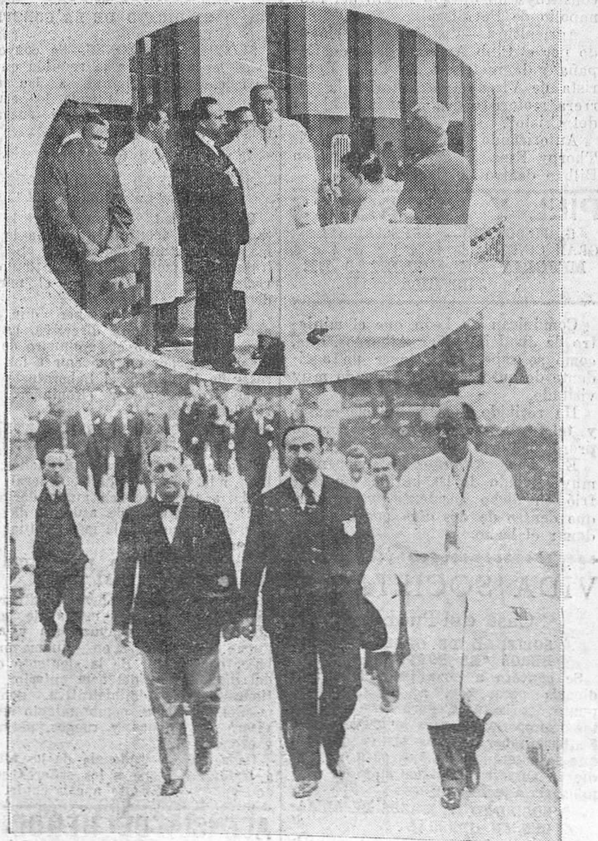
EL VIAJE DEL MINISTRO DE INSTRUCCION.— Don Fernando de los Rios, acompañado de los doctores Diaz-Ganeja y Picatosta en su visita a la Casa de Salud Valdecilla.