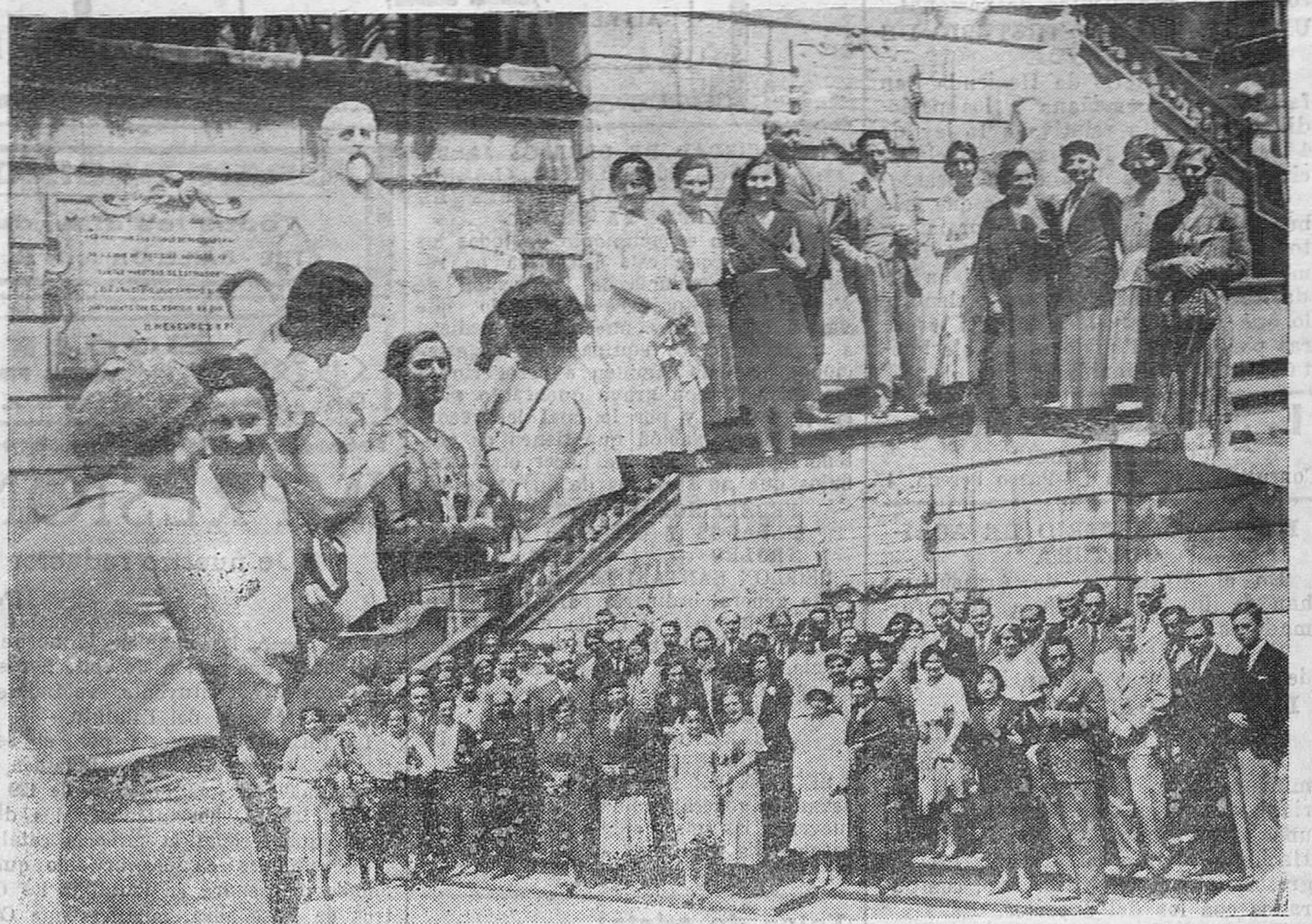
Grupo de estudiantes extranjeros, en el patio de la biblioteca de Menéndez y Pelayo, al inaugurarse los cursos que, como todos los años, se celebran en aquel centro.