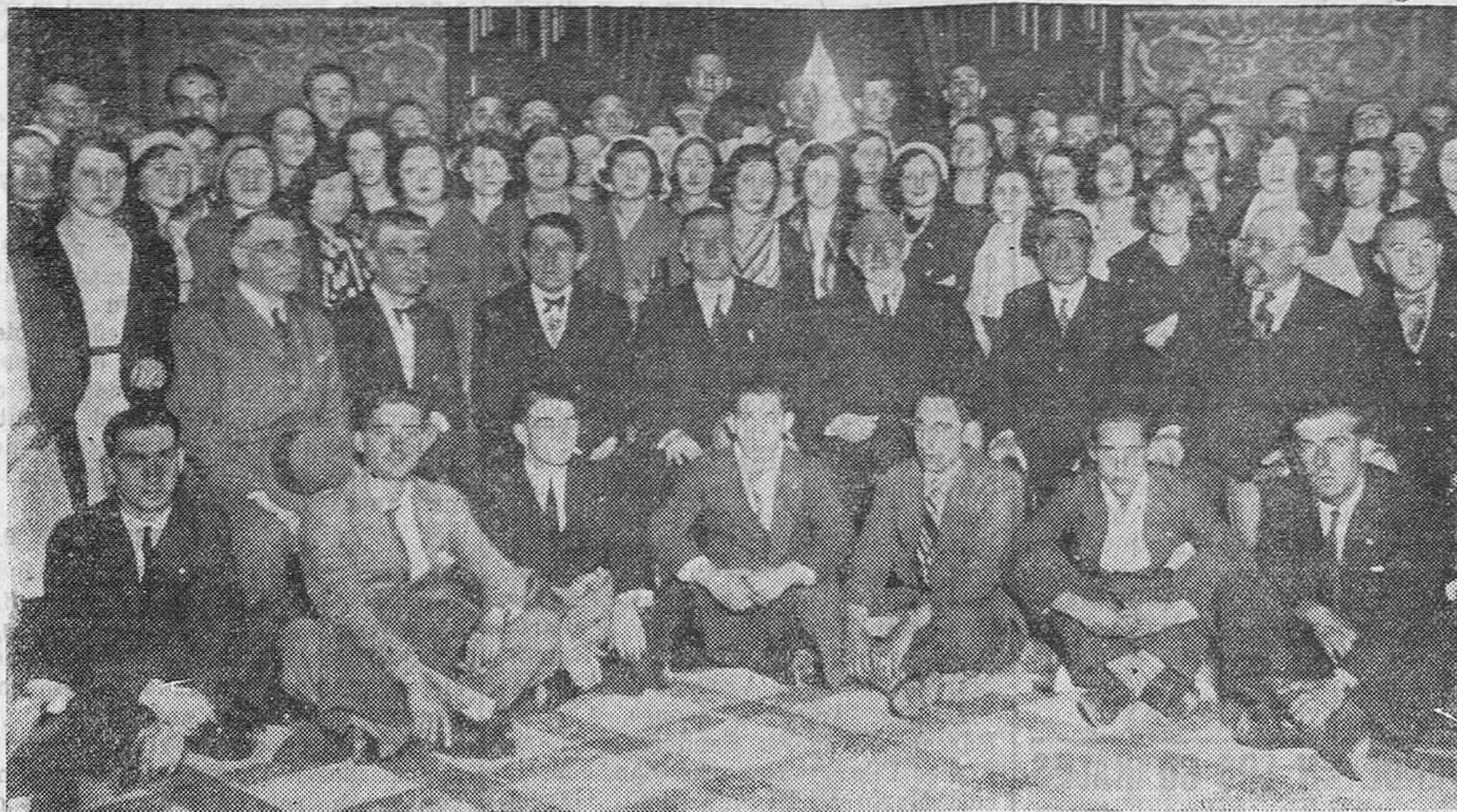
LA CORAL, EN SAN SEBASTIAN.—Grupo del alcalde y del presidente de la Diputación con los coralistas en la recepción celebrada en su honor en el palacio de la plaza de Guipúzcoa.

Siendo todos los discursos muy notables, para nosotros el más emocionante fué el de este último, pues dado el cariño que profesa a Santander, se puso en sus palabras todo el sentimiento y toda la emoción que el acto requería. Habló del cariño que en nuestra ciudad se siente por esta otra, de distinta nacionalidad, y de los lazos que en lo sucesivo las unirá más fuertemente. Refirió luego al intercambio de jóvenes estudiantes que introducen en los hogares el fuego santo de la familia, y terminó cantando un himno a la República española, que ha venido a colocar a nuestra patria a la cabeza de las naciones más adelantadas en materias políticas y social. Terminó el acto abra-