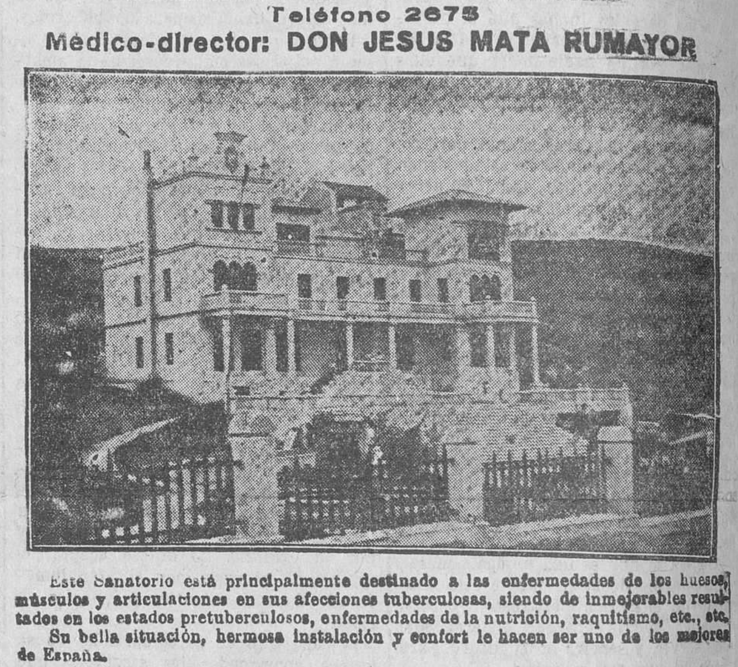
Este sanatorio está principalmente destinado a las enfermedades de los huesos, músculos y articulaciones en sus afecciones tuberculosas, siendo de inmejorable resultado en los estados pretuberculosos, enfermedades de la nutrición, raquitismo, etc., etc. Su bella situación, hermosa instalación y confort le hacen ser uno de los mejores de España.