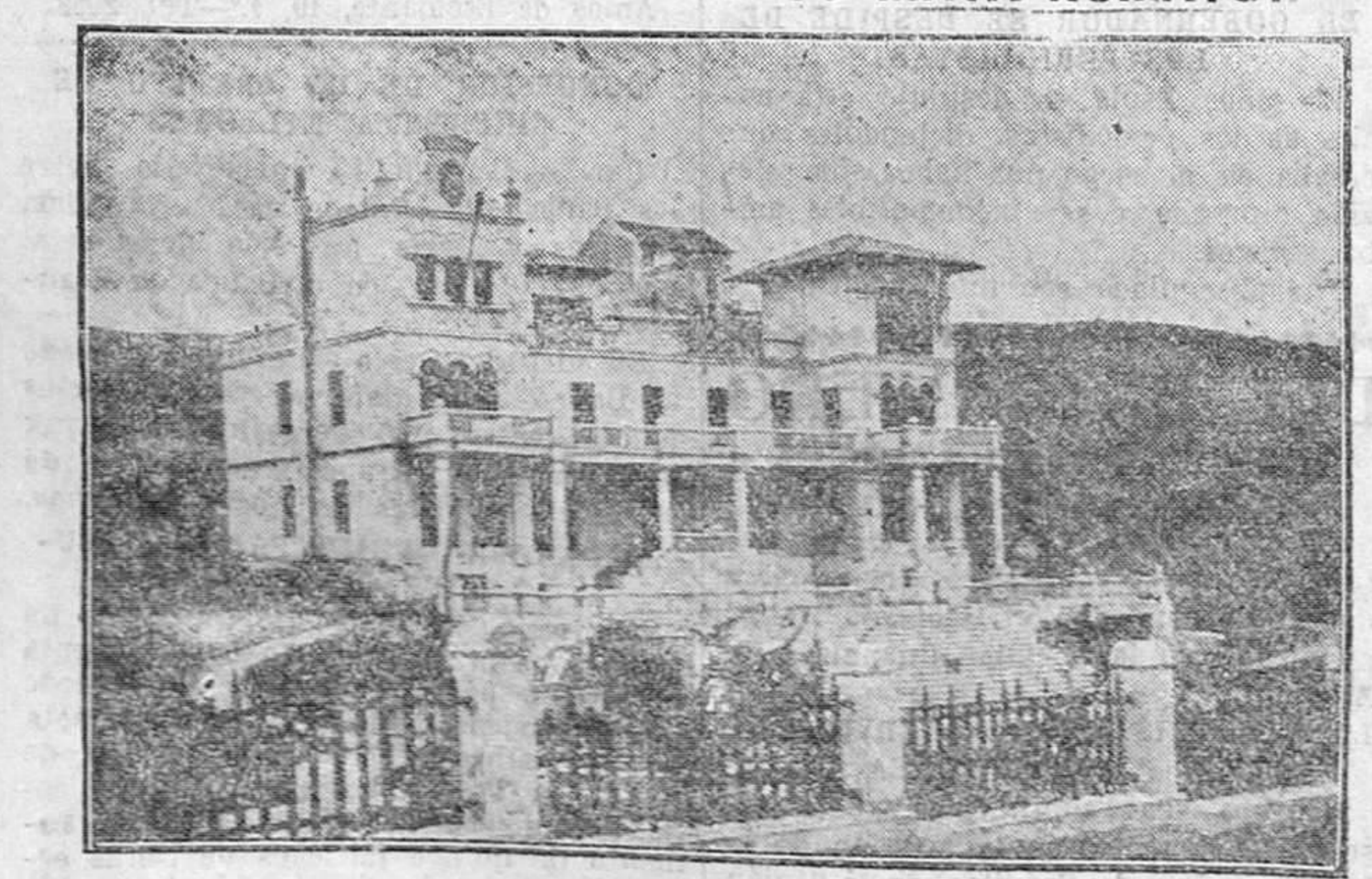
Este sanatorio está principalmente destinado a las enfermedades de los huesos, músculos y articulaciones en sus afecciones tuberculosas...