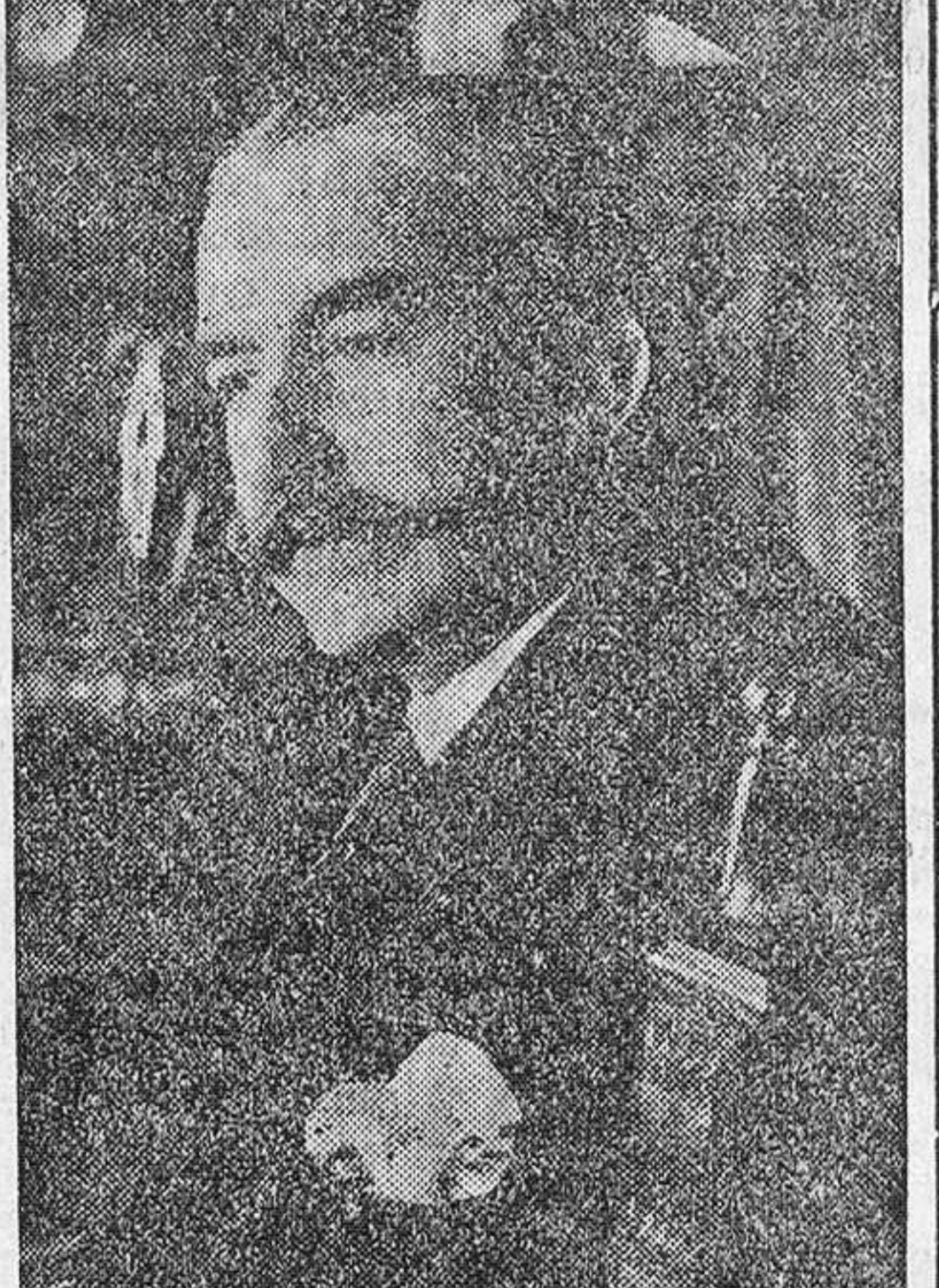
Este es el actor mencionado en el texto, quien participó en la obra teatral.