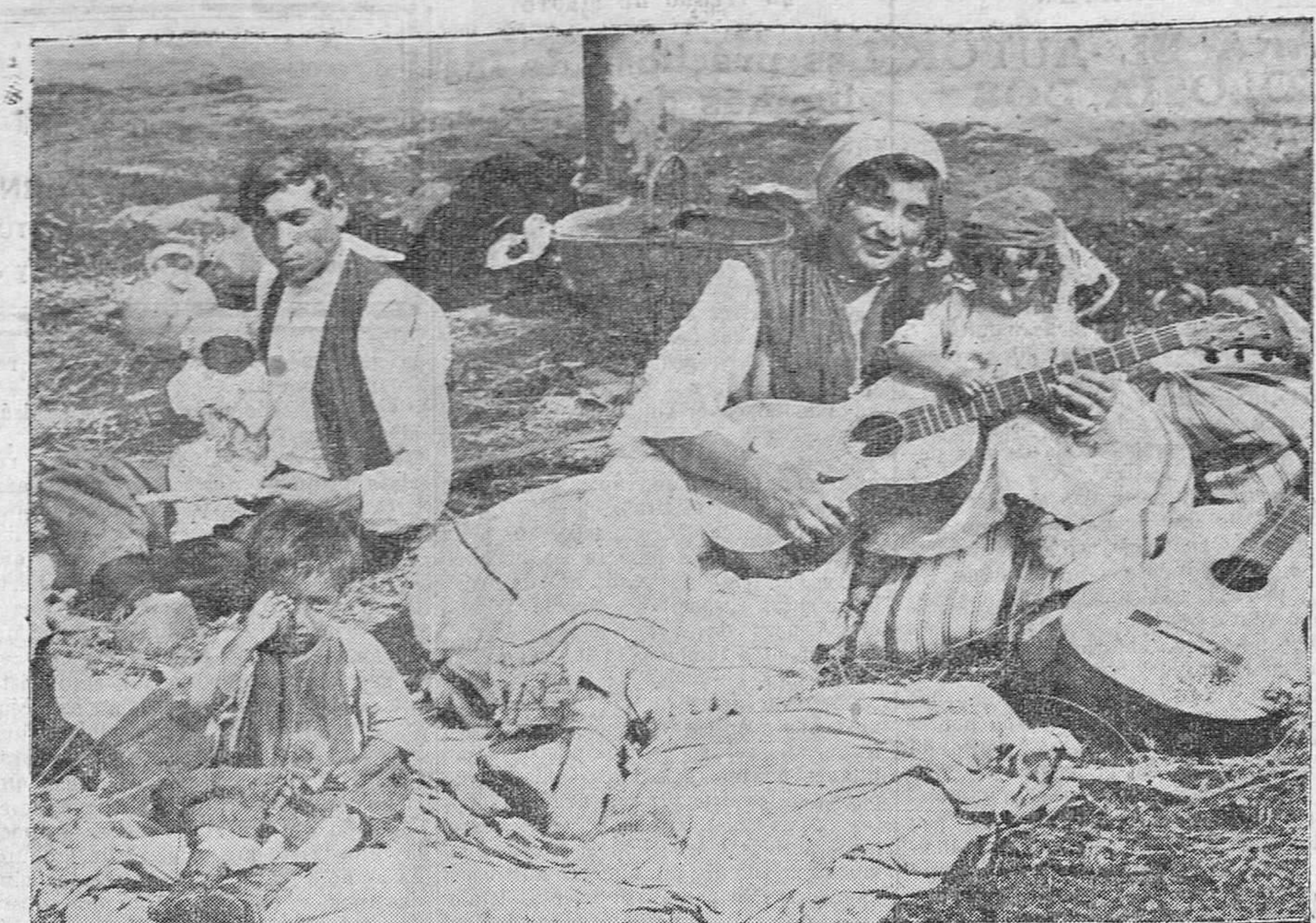
La familia de gitanos ha hecho alto en su caminar incansante. ¿Dónde irá mañana? Sólo sabe que ante ella se abrirá de nuevo el camino que atraviesa el mundo...