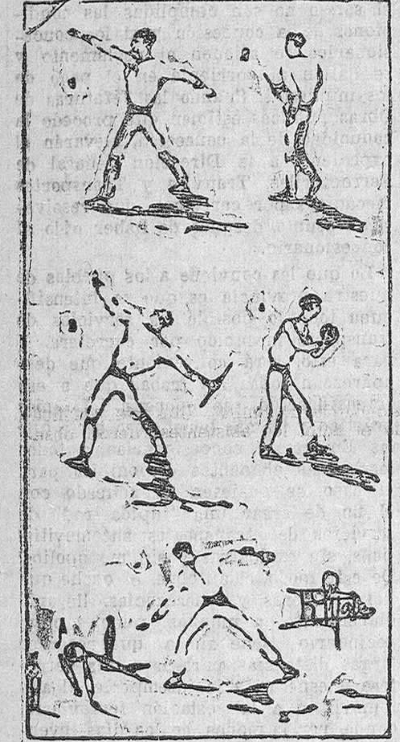
1, 2 y 3, Daniel Vega tirando la barra. 4 y 5, jugando a los bolos.