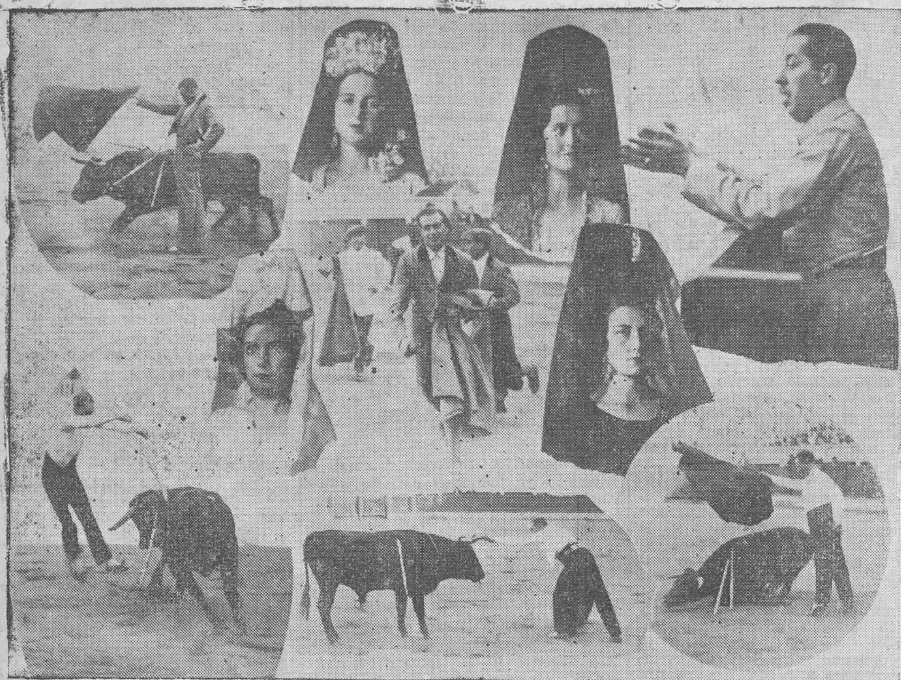
LA BECERRADA DE LOS HERMANITOS. — Varios momentos de la interesante fiesta, y los retratos de las encantadoras presidentas.

Una fiesta muy simpática que resulta muy entretenida.