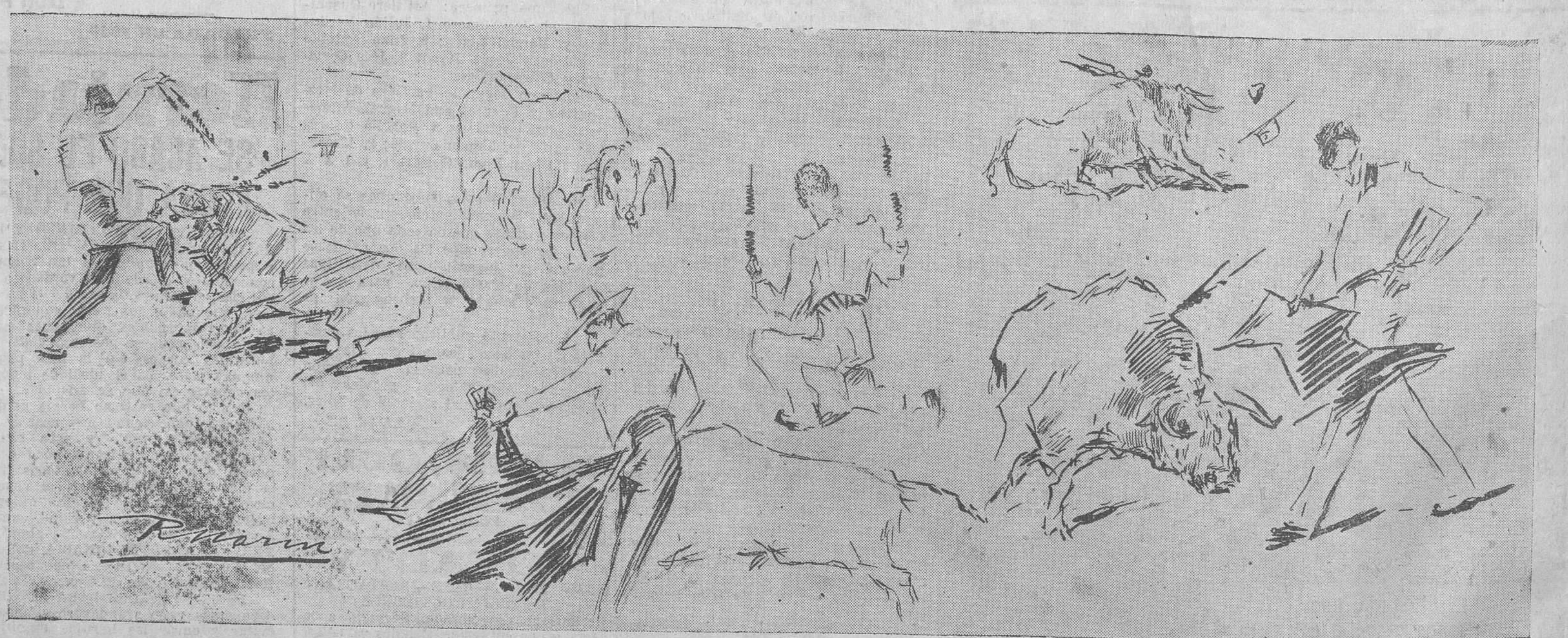
LA BECERRADA DE LOS HERMANITOS. — Varios momentos de la fiesta, vistos por el genial dibujante Ricardo Marín, que nos ha hecho el honor de brindárselas a EL CANTABRICO.