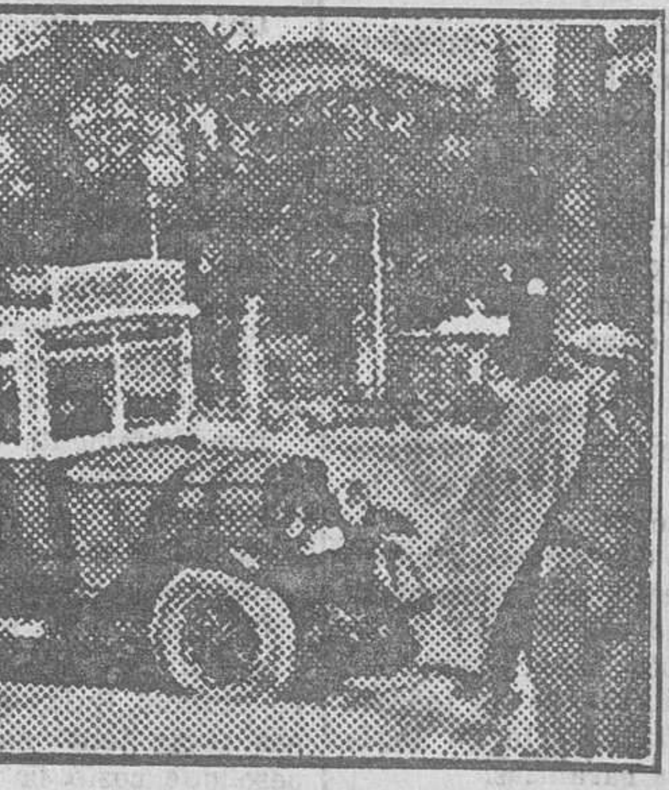
Los Chevrolet «Cibeles-Chamartín», en la plaza de la Cibeles

«Los dos últimos Chevrolet han recorrido 20.000 kilómetros cada uno sin que hayan dejado de prestar servicio un solo día por requerir reparaciones. Cada uno de los autobuses recorre unos 240 kilómetros diarios. Casi siempre están llenos.