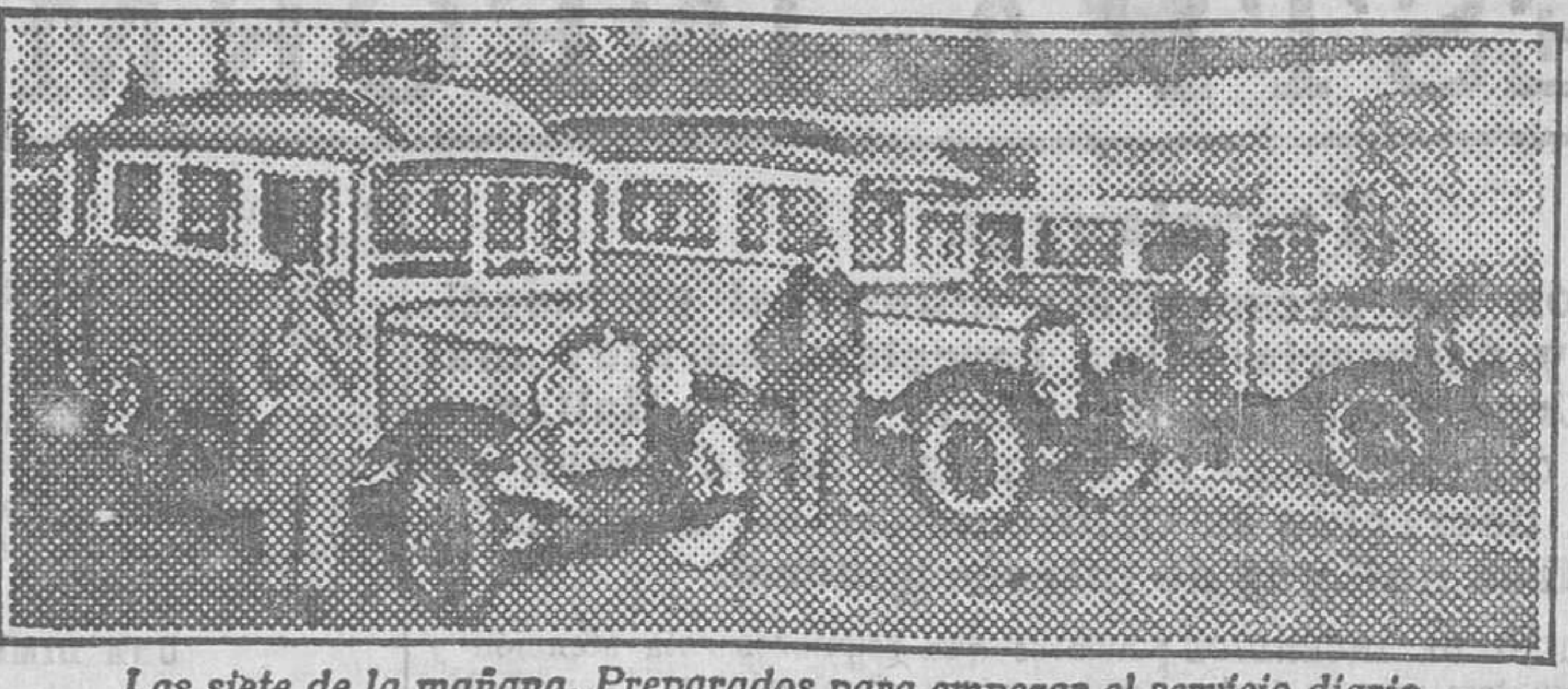
Las siete de la mañana. Preparados para empezar el servicio diario