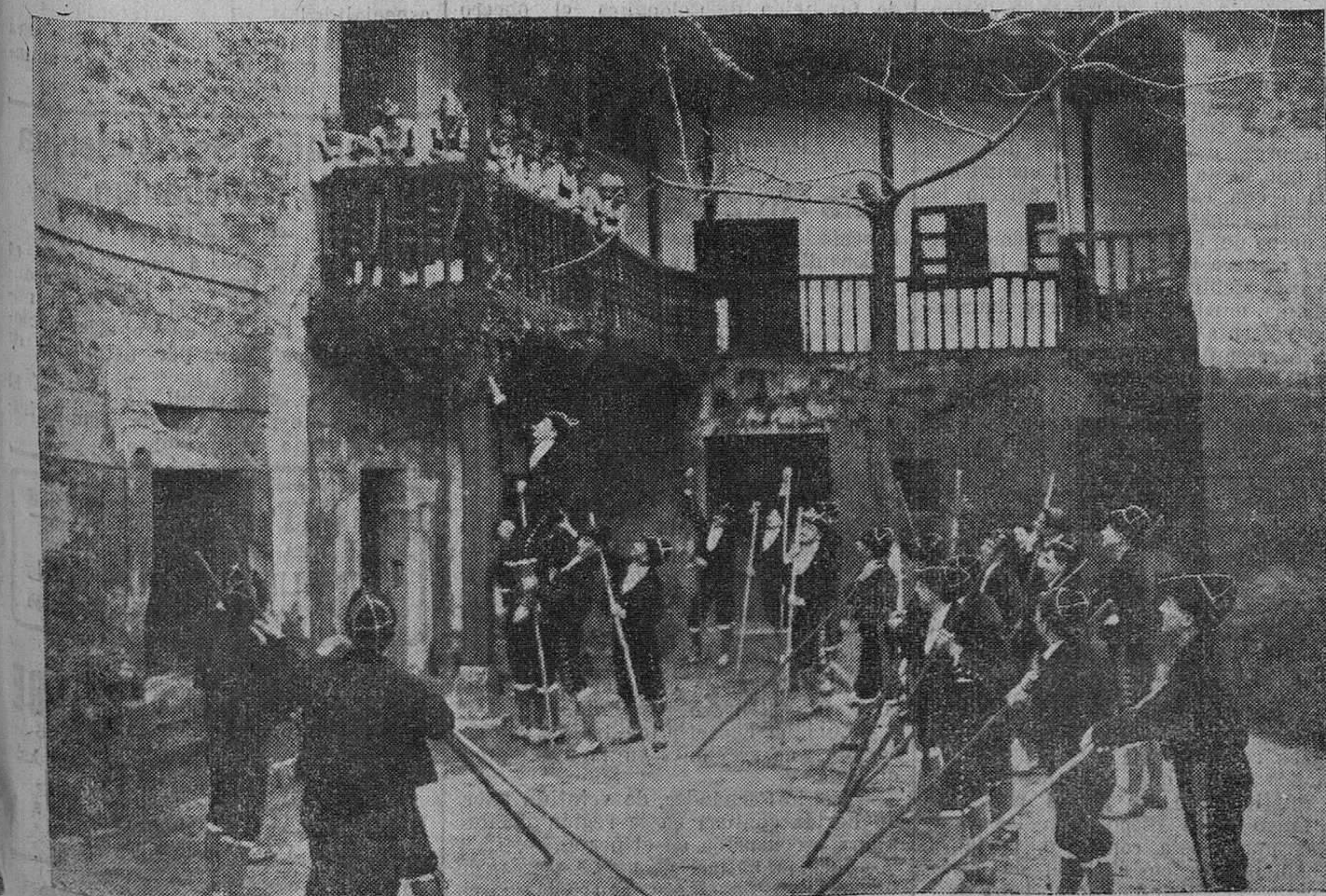
ESPERAS MONTANESAS. — Los simpáticos muchachos de los coros montañeses hacen una escena de amor y juventud en una vieja casona de Santillana. Mientras los mozos miran ansiosamente al engalanado balcón, las mozcucas rien aborrazadas y felices.