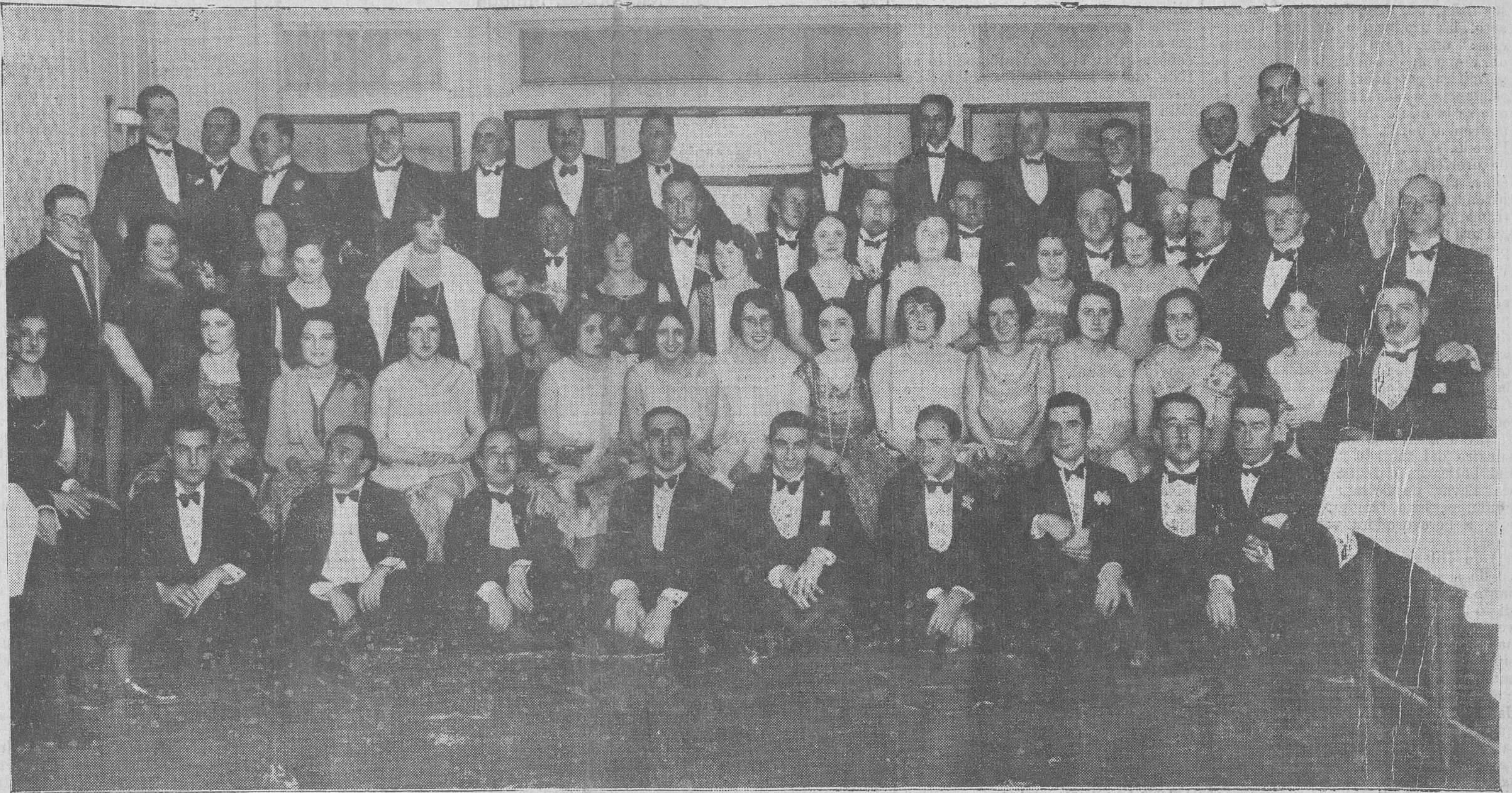
LOS ROTARIOS SANTANDERINOS EN LA FIESTA QUE CELEBRARON EL PASADO MIERCOLES, EN LOS SALONES DE ROYALTY.

Siempre hemos creído que no éramos ni peores ni mejores que los del resto del planeta, y que lo que en otros sitios hacían podía hacerse también aquí. Si, como vimos en Amberes, la Sociedad de tranvías