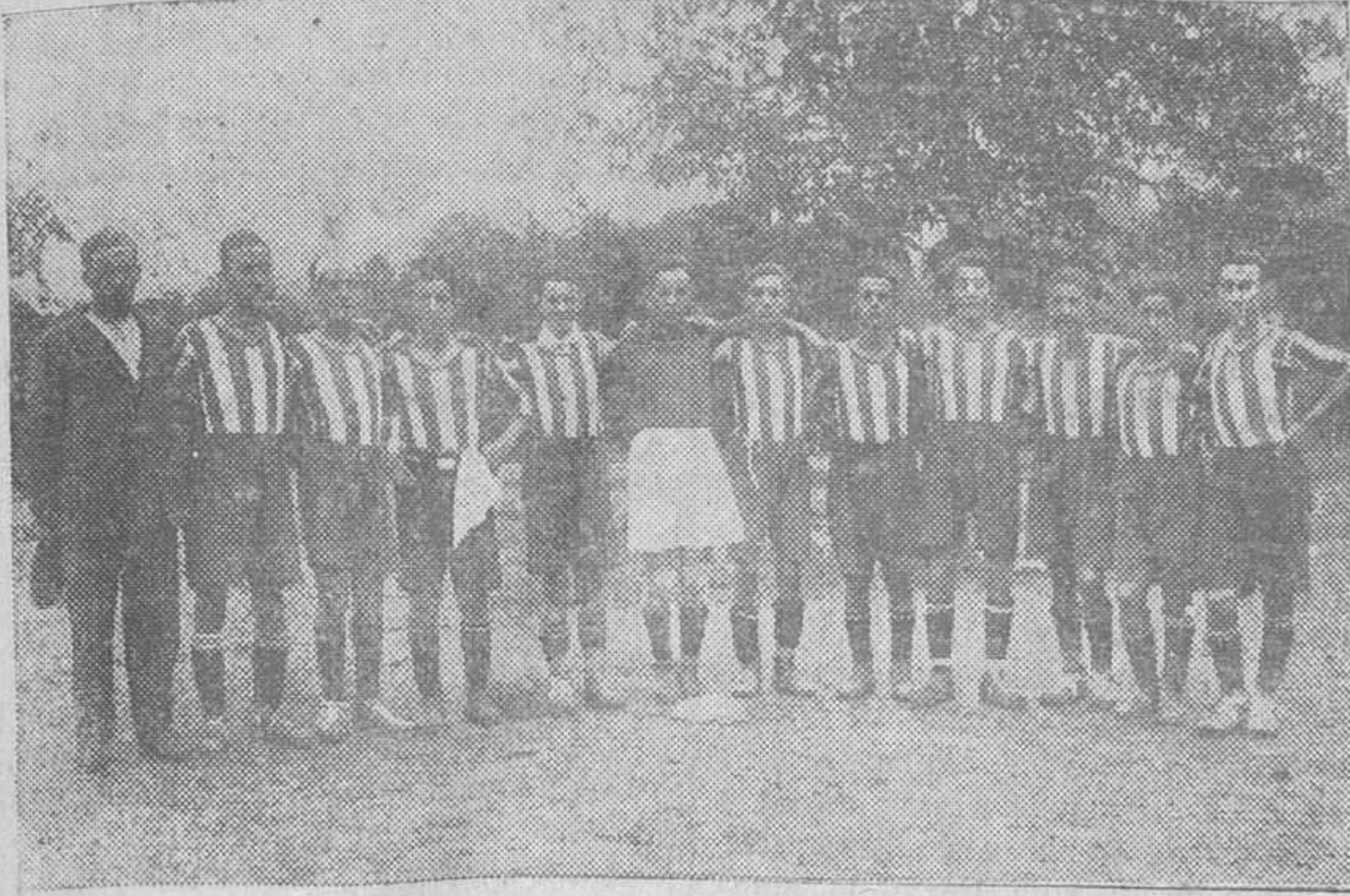
LOS CLUBS MODESTOS.—El Requejada F. C., de Torrelavega, que participará en el campeonato de EL CANTABRICO, que se jugará en aquella ciudad, y que será interesantísimo.

La suerte—escribe "Karaj"—no desatendió la idea de la Federación Cantabra. La velada del sábado ha despertado gran interés.