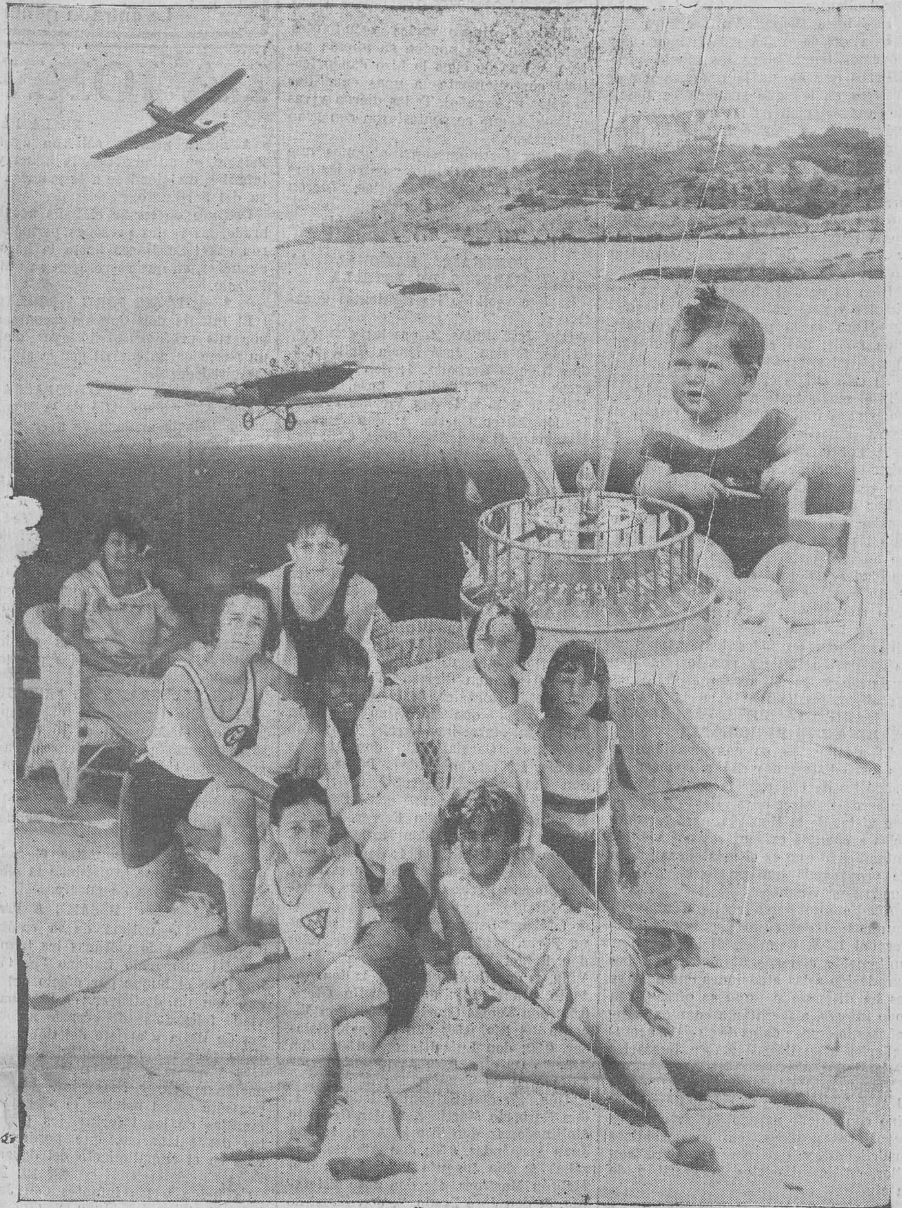
ESGENAS DE LA PLAYA.—EL AVIADOR REXACH, QUE TAN ATREVIDOS VUELOS ESTA HACIENDO ESTOS DIAS EN SU AVIONETA, EN DOS MOMENTOS DE LOS MISMOS.—UNA TIENDA DE PEQUEÑOS VERANEANTES.