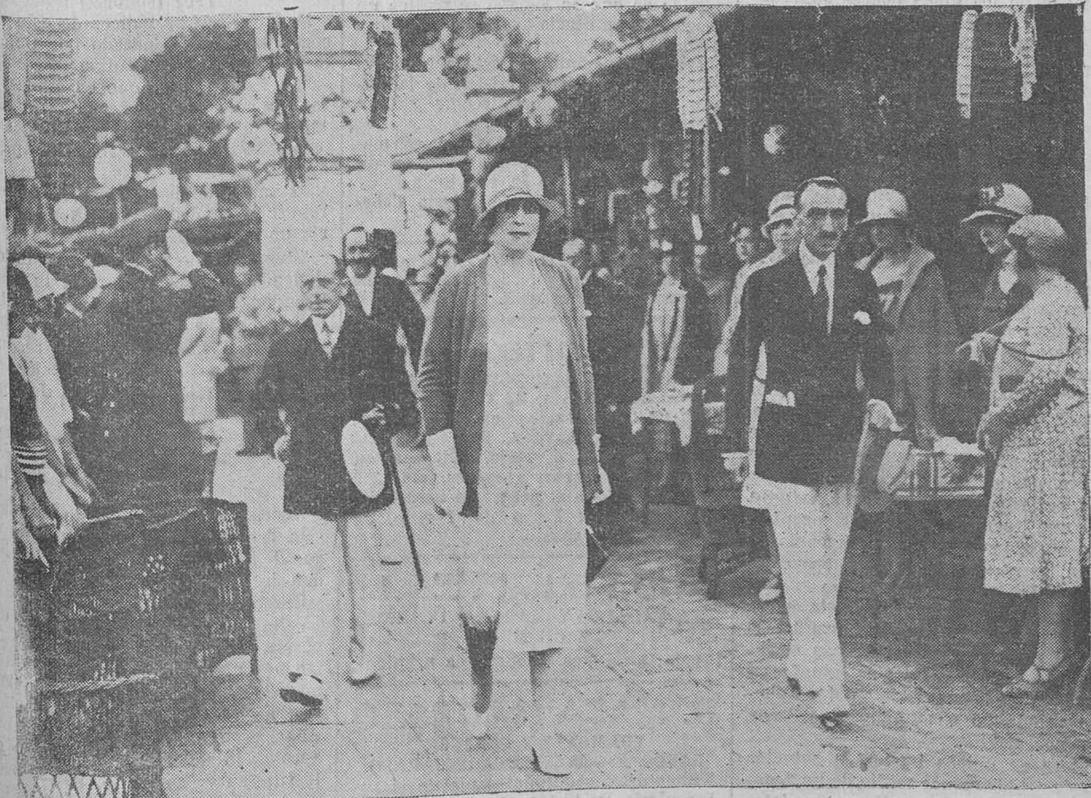
LOS REYES, SALIENDO DEL CAMPO DE TENNIS DE LA MAGDALENA, DESPUES DE VER JUGAR, ANTEAYER, A SUS AUGUSTAS HIJAS.

Vías urinarias, partos y enfermedades de la mujer.—DIATERMIA. Consulta de diez a una y de tres a cinco. Amós de Escalante, 10, 1.º.—Tel. 274