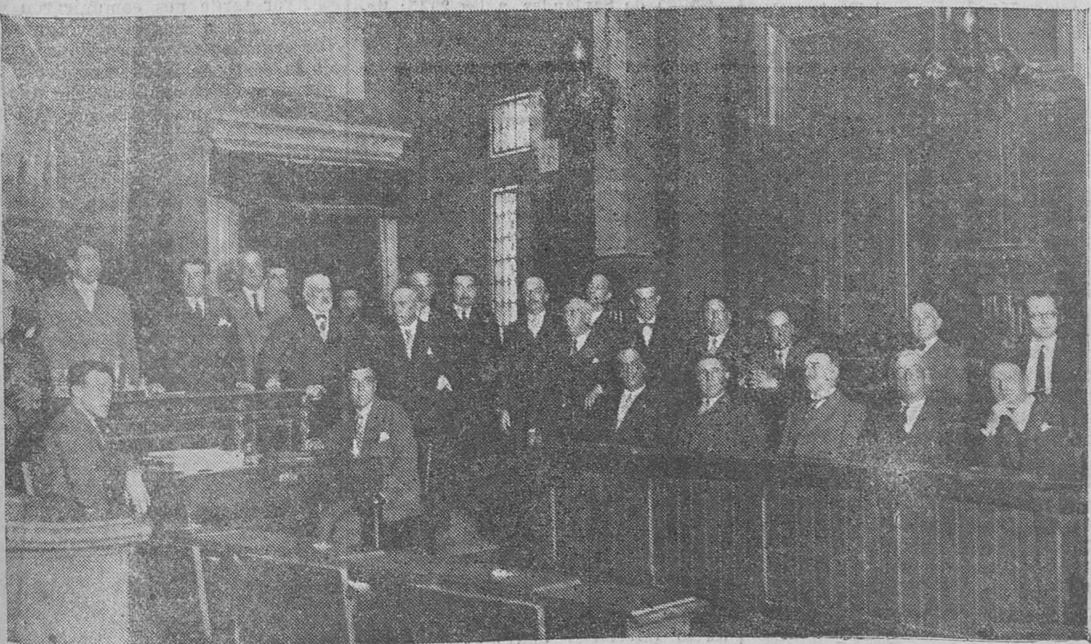
EL PLENO DE NUESTRA CORPORACION MUNICIPAL, MOMENTOS DESPUES DE ACORDAR ERIGIR UN MONUMENTO AL REY, COMO HOMENAJE DE LA CIUDAD A SU OBRA PRO-SANTANDER.

Esta cuestión promueve un debate interesantísimo, después de hacer una sucinta relación de hechos el señor Dorao, demostrando que aquel empleado adeudado al Ayuntamiento ochocientas y pico de pesetas, cobradas sin de-