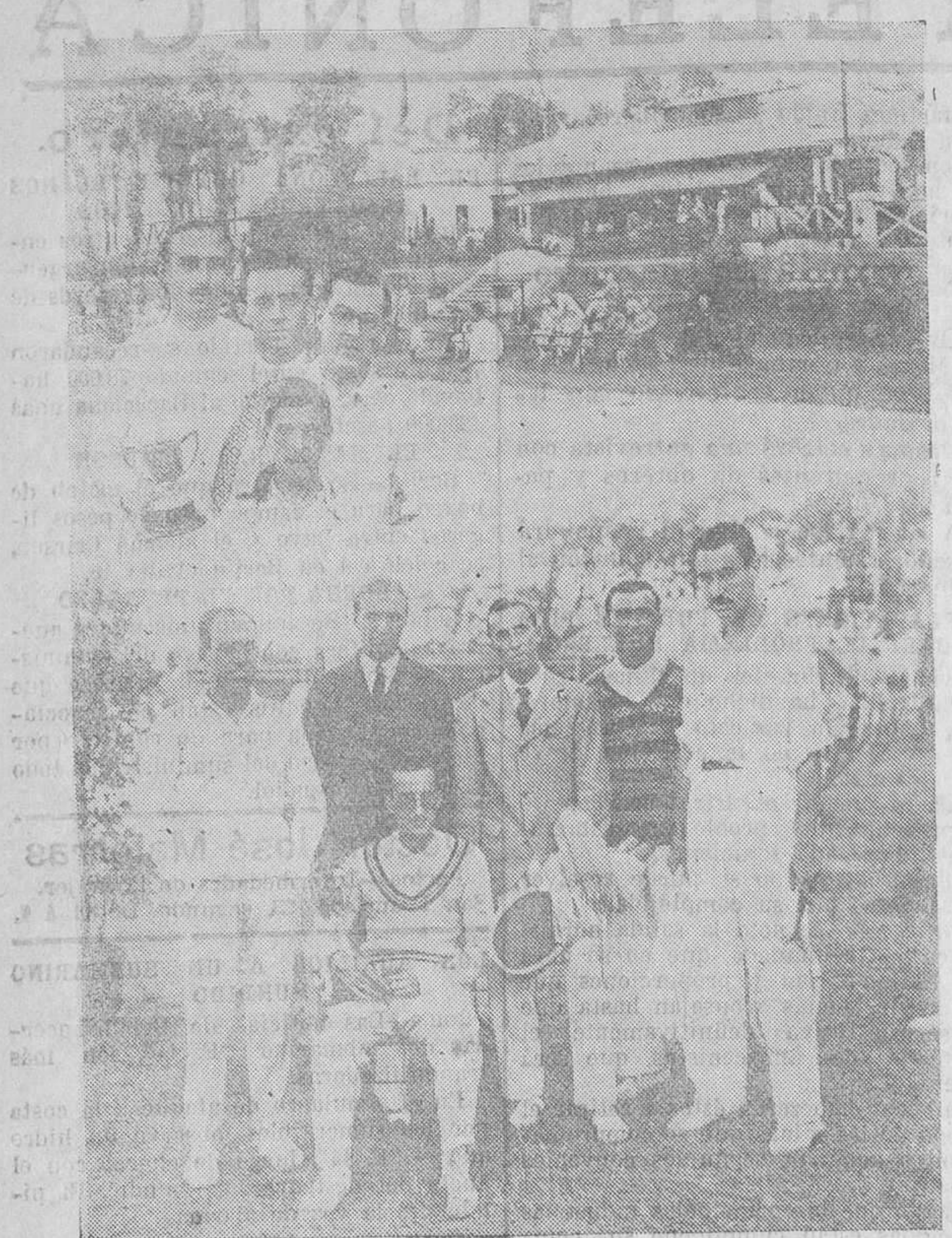
Jugadores vizcaínos y montañeses que tomaron parte en unos interesantes partidos en los campos de Tennis de la Magdalena, saliendo victoriosos los locales, que hicieron preciosas jugadas.