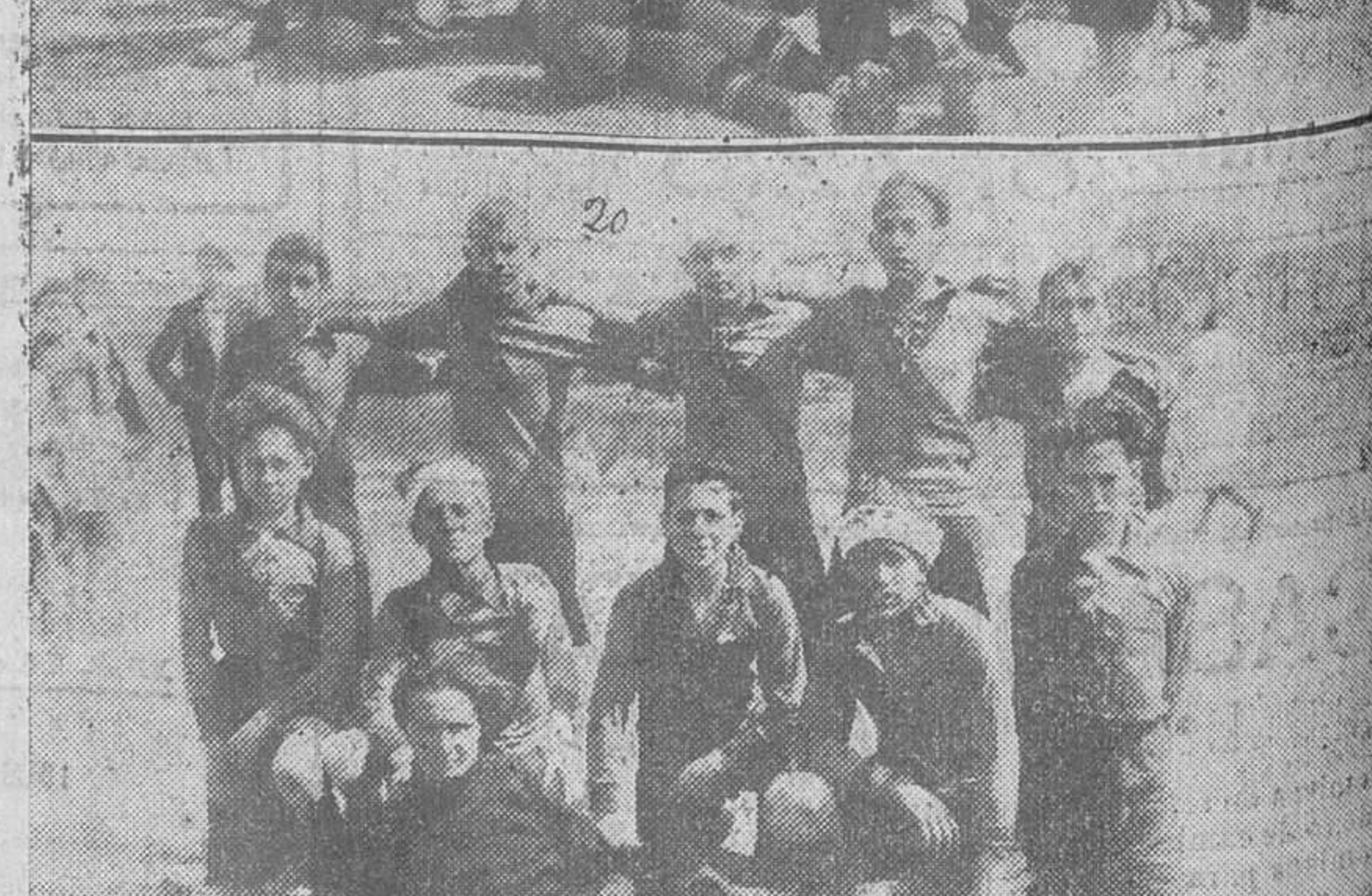
EL CAMPEONATO DE LOS CLUBS MODESTOS. — 1. La Unión Santanderina. — 2. Arenas Club. — 3. Deportivo San Martín. — 4. Deportivo Montaña. — 5. Deportivo Turin. — 6. Deportivo Carmen. — 7. Izarra F. C. — 8. Deportivo Méndez Núñez. — 9. Celta F. C. — 10. Deportivo Vista Alegre. — 11. Deportivo Español. — 12. Patronato Sport. — 13. Montaña Olimpia. — 14. Velarde F. C. — 15. Deportivo Reina Victoria. — 16. Deportivo Betis Balompí. — 17. Campogiro Sport. — 18. Deportivo Bustamante. — 19. Deportivo Maliaño. — 20. Deportivo Nelson, y los árbitros, señores Balbás, Varela, Real, Rodríguez, Rivero, Salaverri y Gutiérrez, que actuaron el pasado domingo.