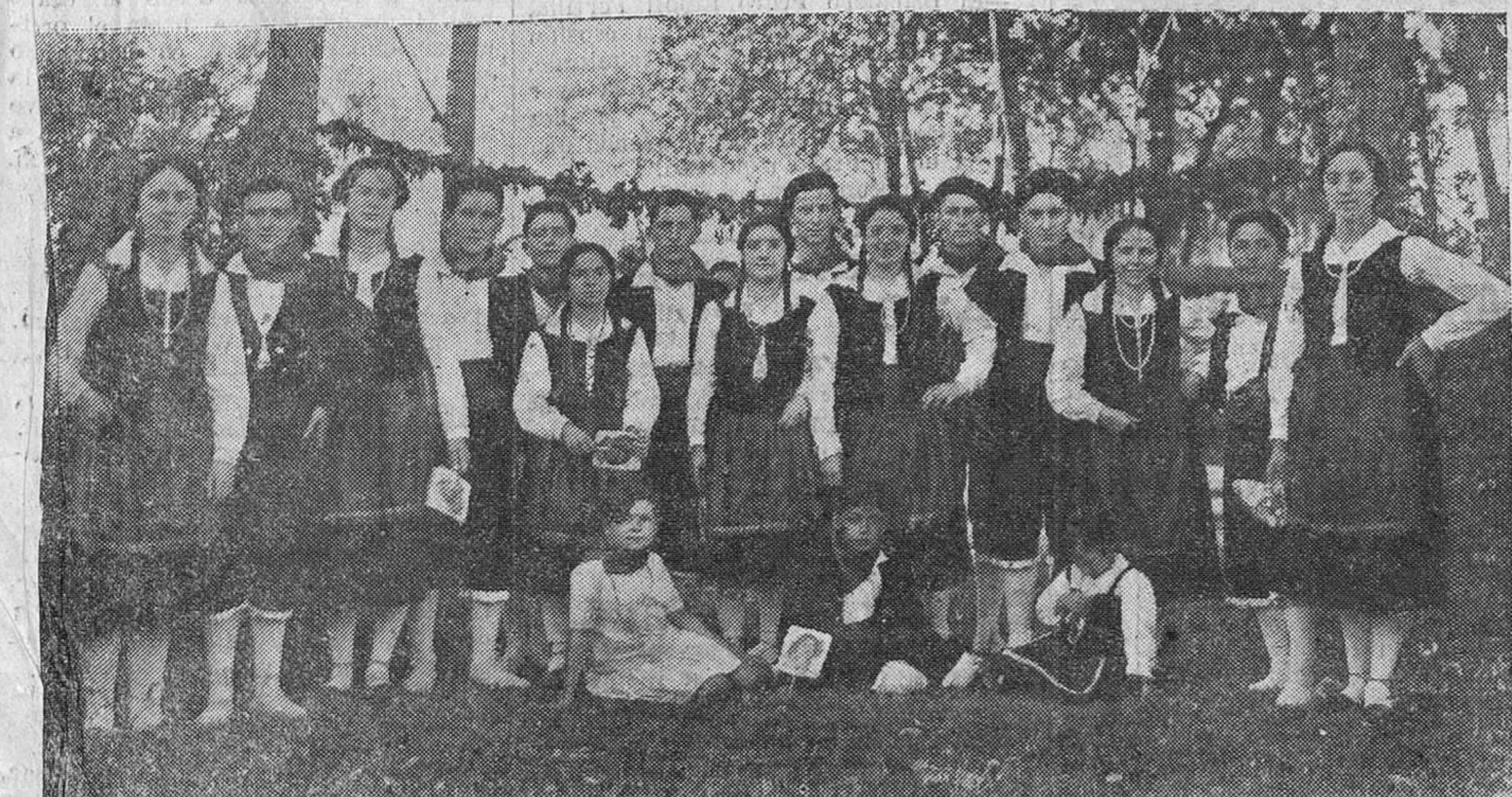
RAMALES.—LOS NUEVOS COROS "LA VICTORIA"

Vías urinarias, partos y enfermedades de la mujer.—DIATERMIA Consulta de diez a una y de tres a cinco. Amós de Escalante, 10, 1.º.—Tel. 2774