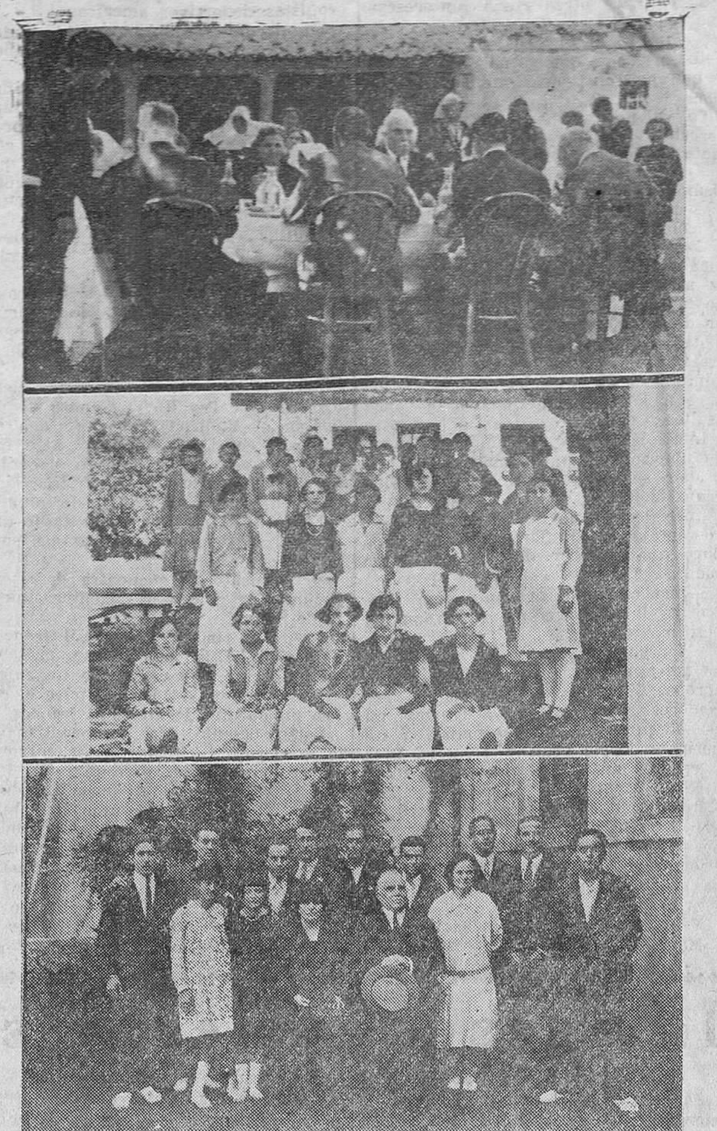
DEL HOMENAJE AL ILUSTRE GENERAL DON FERMIN SOJO Y LOMBA La mesa presidencial del banquete.—Símpiticos jóvenes del pueblo, que sirvieron la comida.—El señor Sojo y Lomba, rodeado de los jóvenes del pueblo que cantaron la misa.