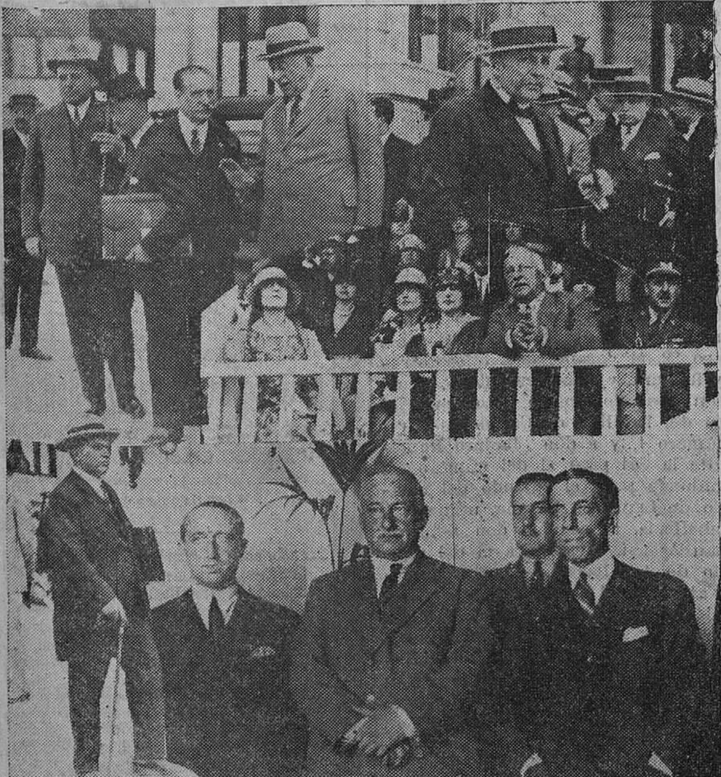
El general Primo de Rivera y los ministros, al dirigirse a Palacio para celebrar el Consejo presidido por el Rey. — El presidente con el embajador de Italia, después de firmado el tratado comercial aéreo. — En el centro, Primo de Rivera, en el Concurso hípico celebrado ayer.

El ministro de Hacienda, que, como es sabido, se hospeda en dicho hotel, subió a saludarle, permaneciendo ambos en conferencia hasta la llegada de los restantes consejeros.