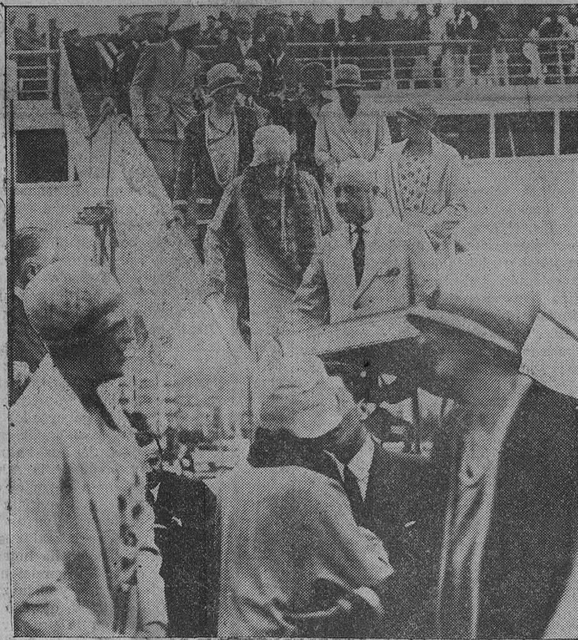
Su Majestad la Reina y sus augustos hijos, al abandonar el "Reina María Cristina", después de recibir a su hermano, que llegó ayer a esta ciudad, para pasar unos días en la Magdalena. — Su Majestad, abrazando a su hermano en la cubierta del "Cristina".

A su paso se encontró el presidente con el agregado militar de Italia, a quien rogó que indicase al embajador de su país que pasase luego para fir-