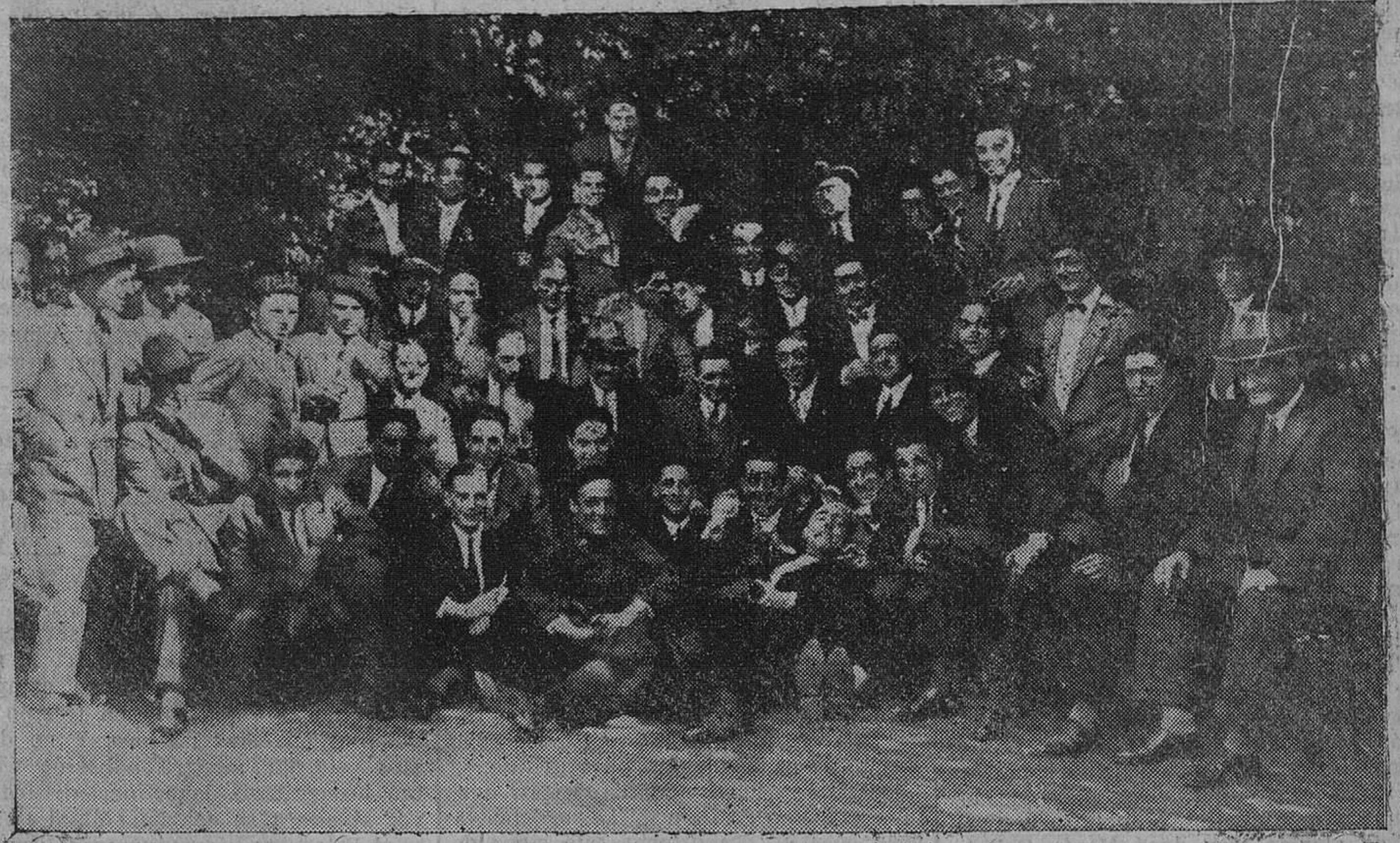
Los jugadores de los equipos Gelta y Racing Club, con los directivos y periodistas que asistieron al partido que tuvo lugar por el equipo campeón a los jugadores gallegos.

Se comenzó por adquisiciones directas, que bien fácil hubiera sido ampliar en grandes proporciones; pero se suspendió el procedimiento en seguida. ¿No aprecian en esta suspensión una atención de sus intereses y un buen deseo manifestado los aldeanos campurrianos? ¿No ven claramente la preferencia del expediente, por ligero