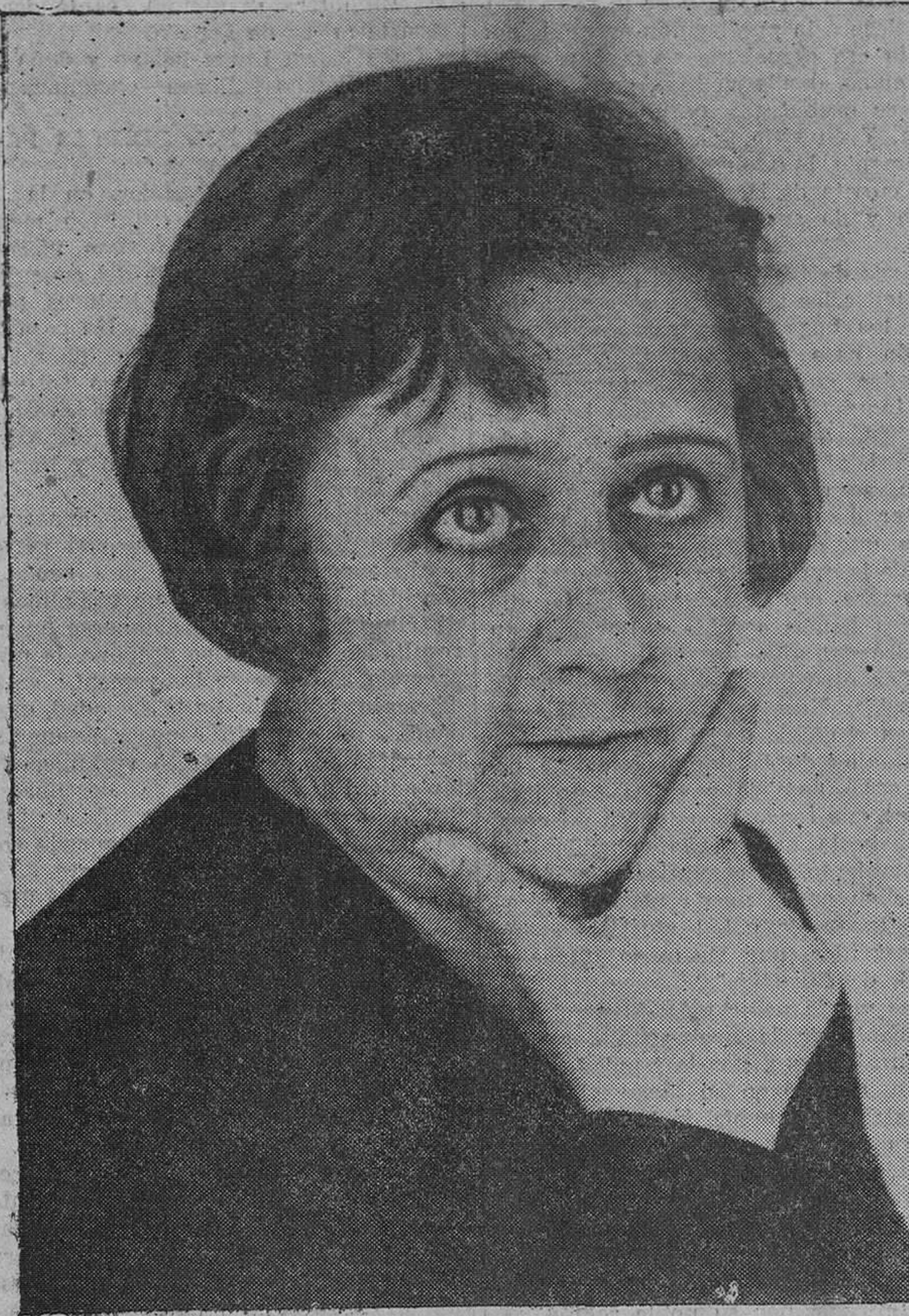
La ilustre actriz Rosario Pino, que hoy debuta en el Teatro Pereda.

Expuso la iniciativa de la Cámara de Comercio de Burgos, de dirigirse a todas las de España y al Consejo Superior de Cámaras de Comercio, y la actuación de este Círculo, para solicitar de todos los de España igual apoyo, a