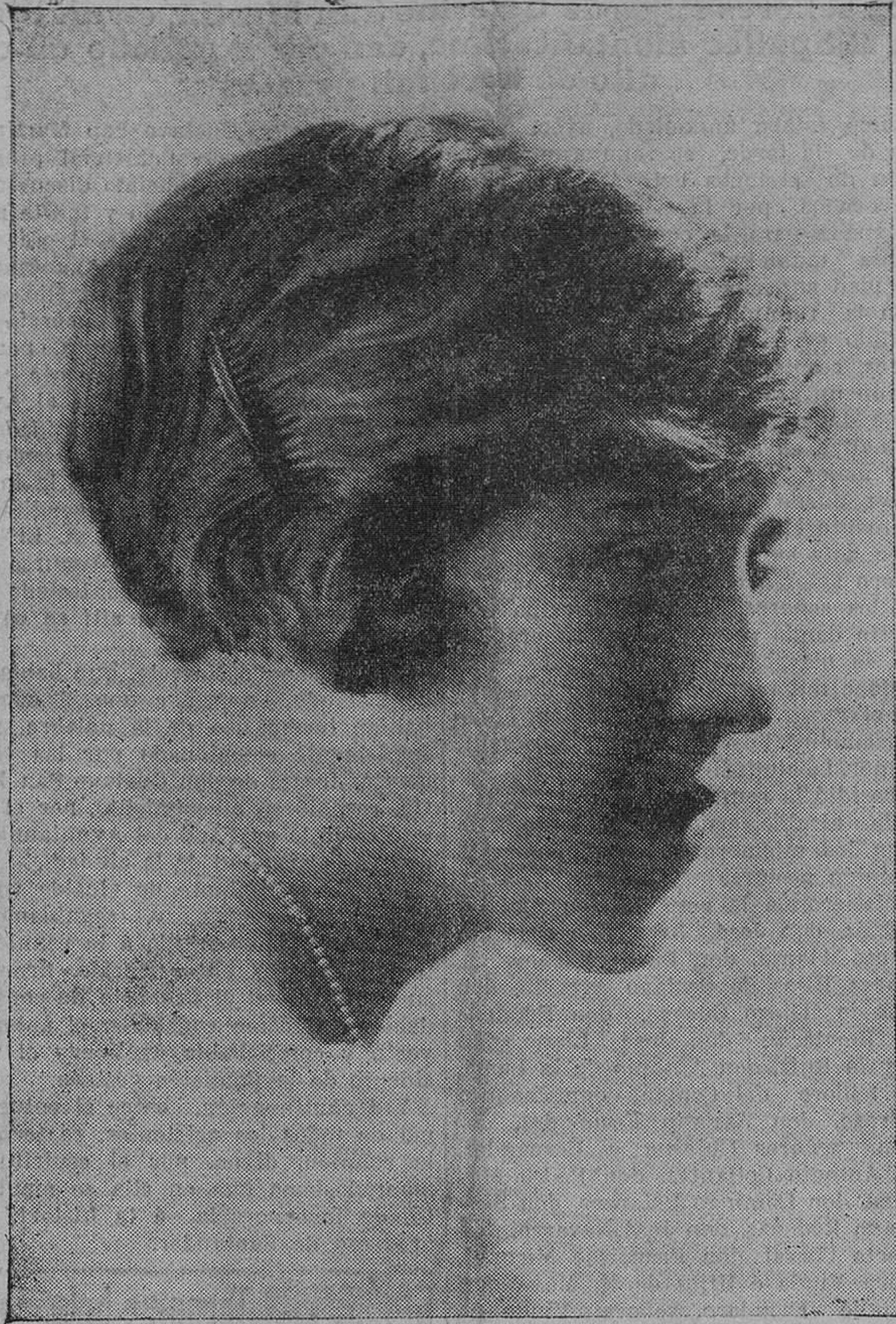
La genial y exquisita artista montañesa, Rosario Iglesias, que esta tarde debuta en el Teatro Pereda.