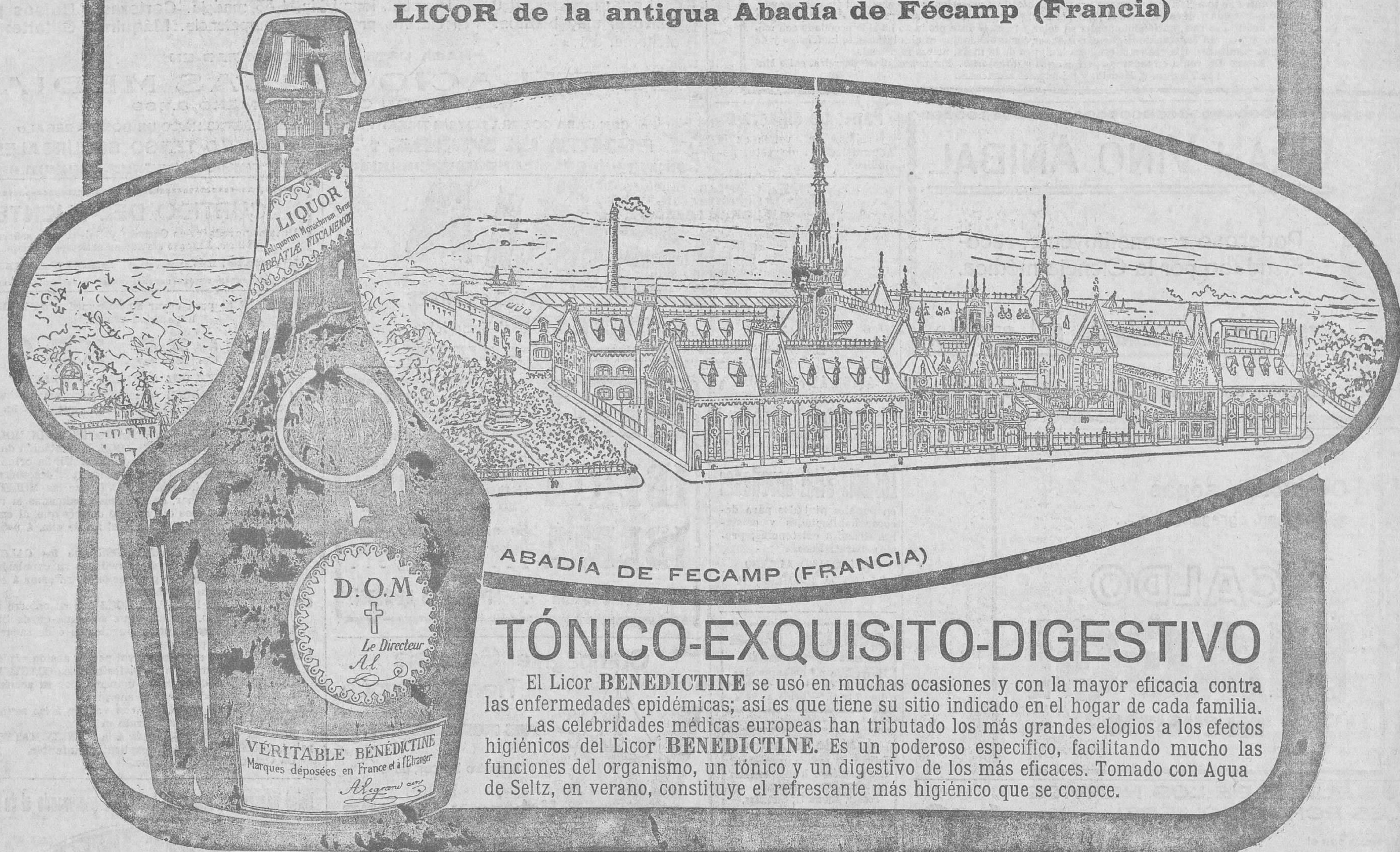
ABADÍA DE FECAMP (FRANCIA)

LICOR de la antigua Abadía de Fécamp (Francia)