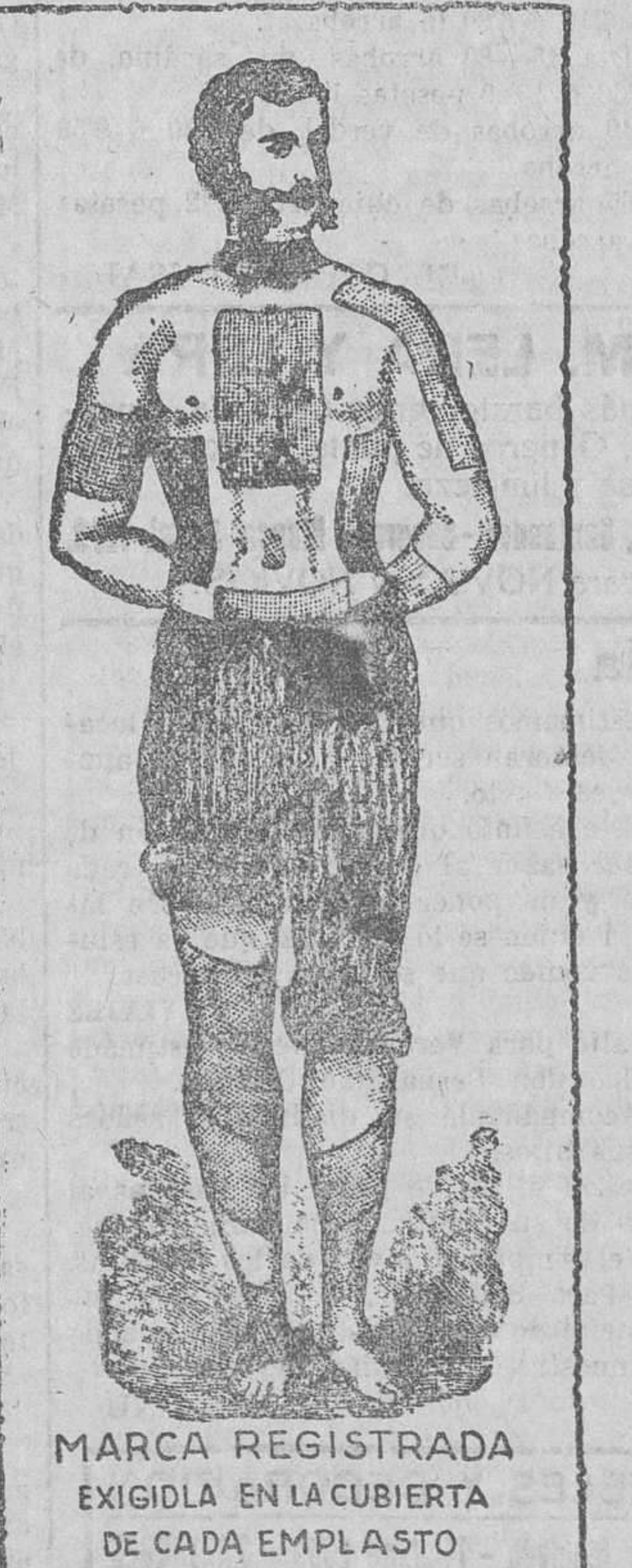
MARCA REGISTRADA EXIGIDA EN LA CUBIERTA DE CADA EMPLASTO

No usen otro que el legítimo y para evitar imitaciones no pida un parche poroso, sino un EMPLASTO del Dr. WINTER de fieltro rojo perforado.