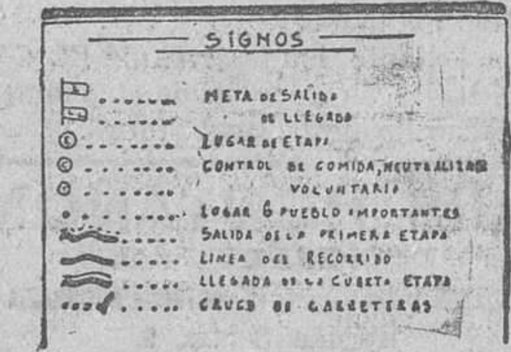
LA II VUELTA A CANTABRIA.—Plano del recorrido que realizarán los routiers que toman parte en esta prueba, recorrido que solo podrá hacerse mediante un esfuerzo formidable, que patentizará las grandes condiciones físicas de los que le realicen.

Pasa á hablar del socialismo del Estado, y afirma que Inglaterra es el país clásico del individualismo, no obstante lo cual sus políticos liberales tienden á ocuparse de los problemas de beneficencia, sanidad, etcétera. El Estado debe ser justo y bueno. El radio de acción de la moral es mayor que el del Derecho. La previsión es una manifestación de la política social. El problema de la previsión y el seguro es reciente; no así el de beneficencia, que responde al sentimiento de fraternidad. Se extiende después en consideraciones diversas sobre los conceptos de ahorro y seguro, haciendo una atinada observación acerca de la avaricia. Dice que la elasticidad de las necesidades, en sentir de un escritor, es maravillosa; que es preciso organizar el ahorro, que es la previsión de primer grado, y hace un merecido elogio de la Caja de Ahorros de Vizcaya, que está muy por encima de sus más renombradas similares extranjeras, porque su espíritu no es meramente económico, sino de moral social y de fraternidad cristiana; de un elevado sentimiento de solidaridad. Al terminar su elocuente disertación, el señor Gascón y Marín fué calurosamente ovacionado.