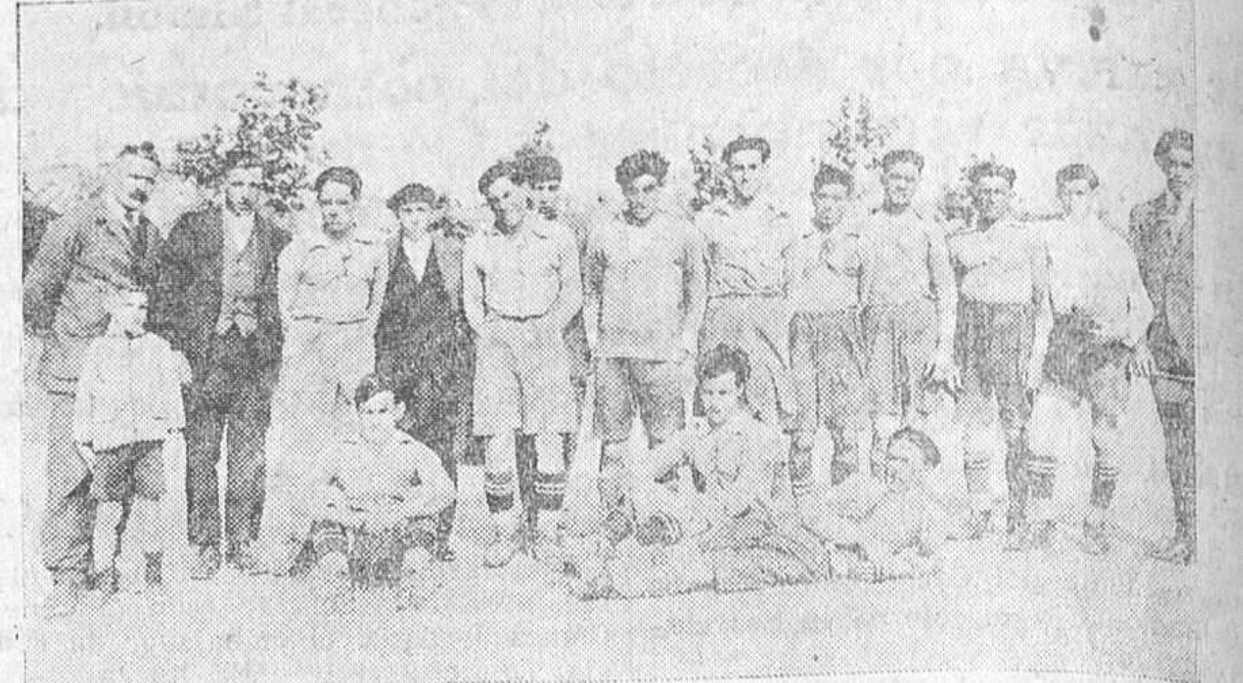
La Unión Deportiva, de Parbayón, proclamado oficialmente campeón de la serie C.