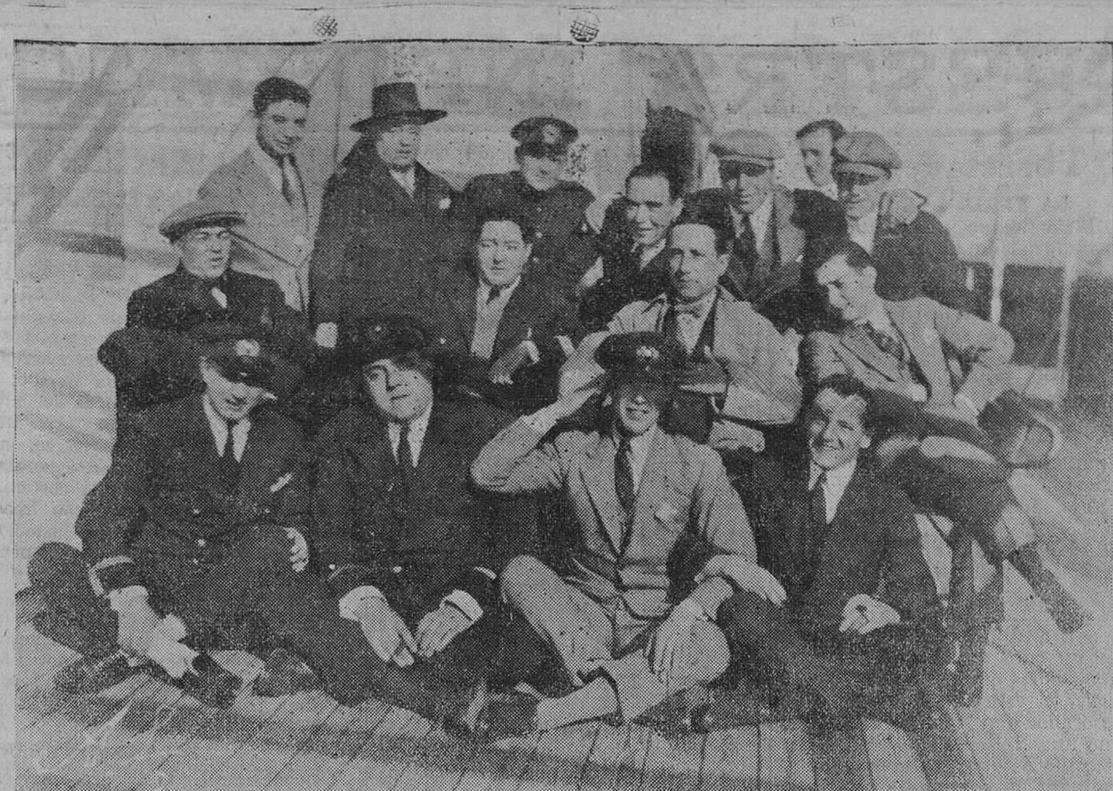
La oficialidad del "Cristóbal Colón", con algunos pasajeros, entre ellos varios diestros, después de una fiesta a bordo del buque

Los novios salieron luego a recorrer varias poblaciones de España y del extranjero.