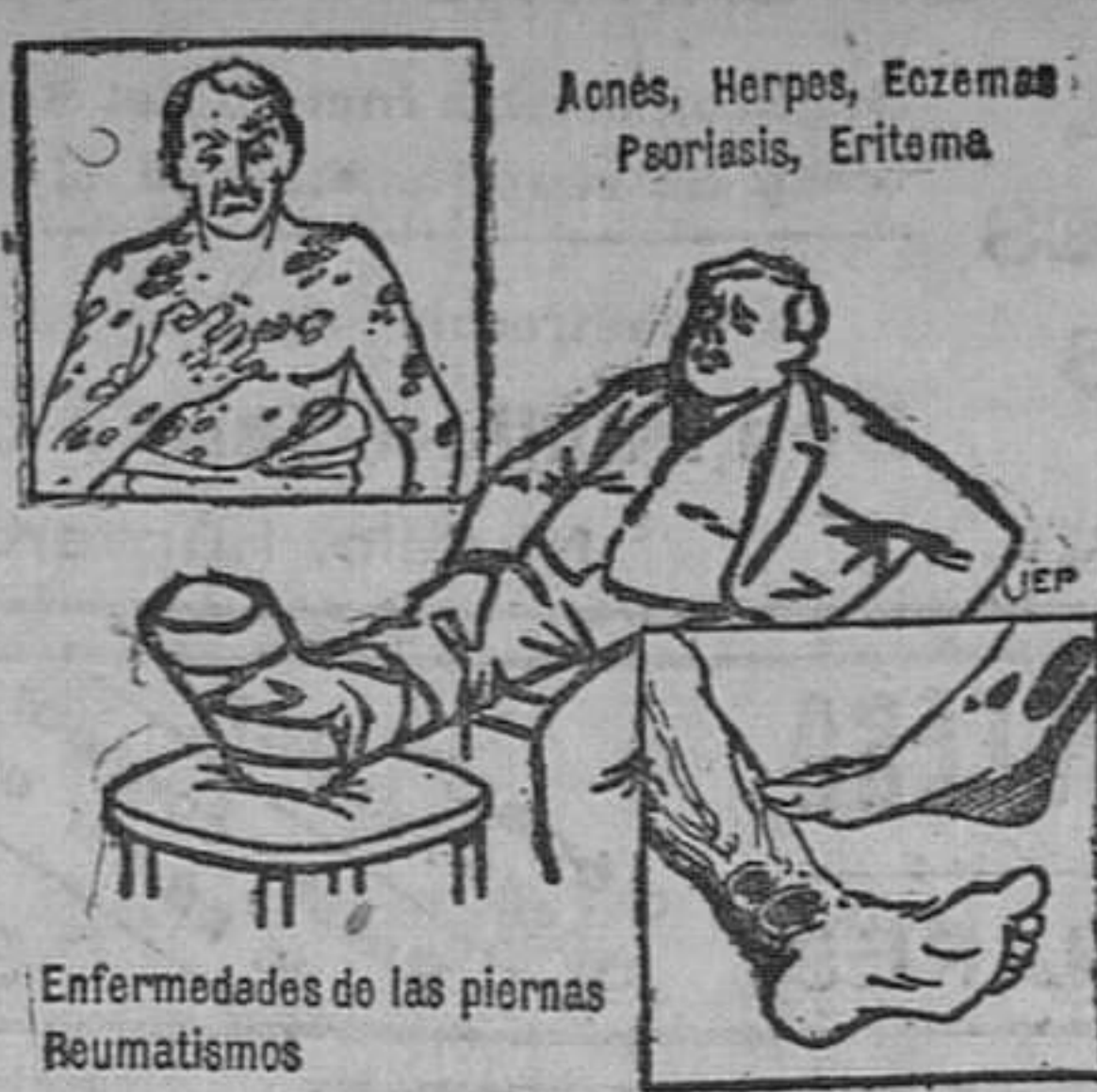
Enfermedades de las piernas Reumatismos

saldrá de Coruña el día 14 de MARZO para Vigo, Lisboa, (facultativa) y Cádiz, de donde saldrá el 18 para Cartagena, Valencia, Tarragona (facultativa) y Barcelona, y de dicho puerto, el 24 de marzo para Port Said, Suez, Colombo, Singapur, Manila, Hong Kong, Yokohama, Kobe, Nagasaki (facultativa), y Shanghai, admitiendo pasaje y carga para dichos puertos y para otros puntos para los cuales haya establecido servicios regulares desde los puertos de escala antes indicados.