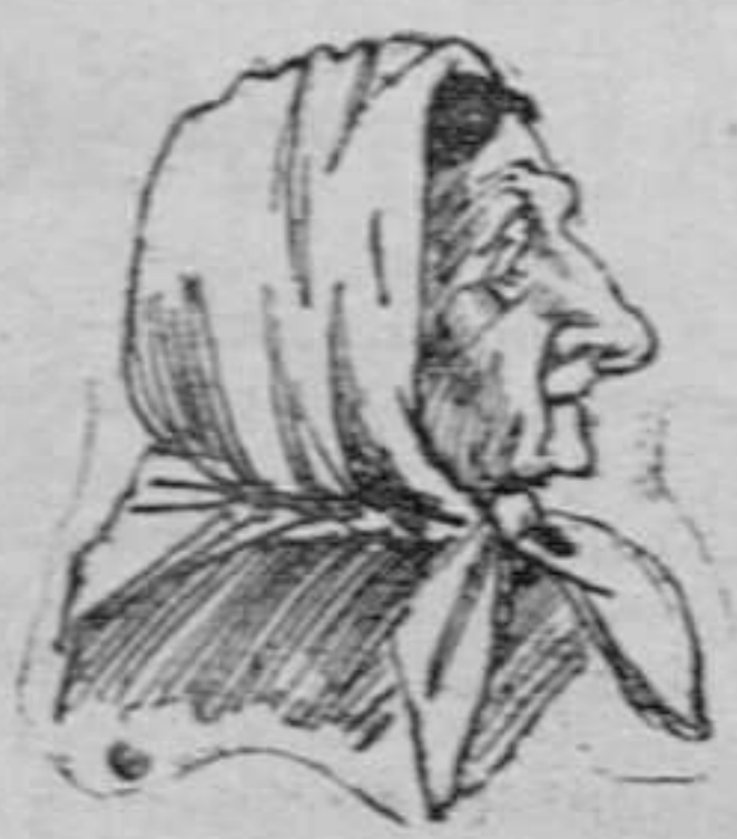
La portera del número 109 de la calle de Fuencarral.

Antes de preguntarle la acción popular, dice: —No, señor. (Risas.) A.—¿No vió usted á un sujeto que desde la misma puerta de su casa se hacia señas con otra persona que estaba en un balcón del piso segundo del 109? T.—No, señor; nada. A.—¿No le ha dicho usted á alguien que sí lo había visto y que lo echó usted de allí? T.—No, señor.