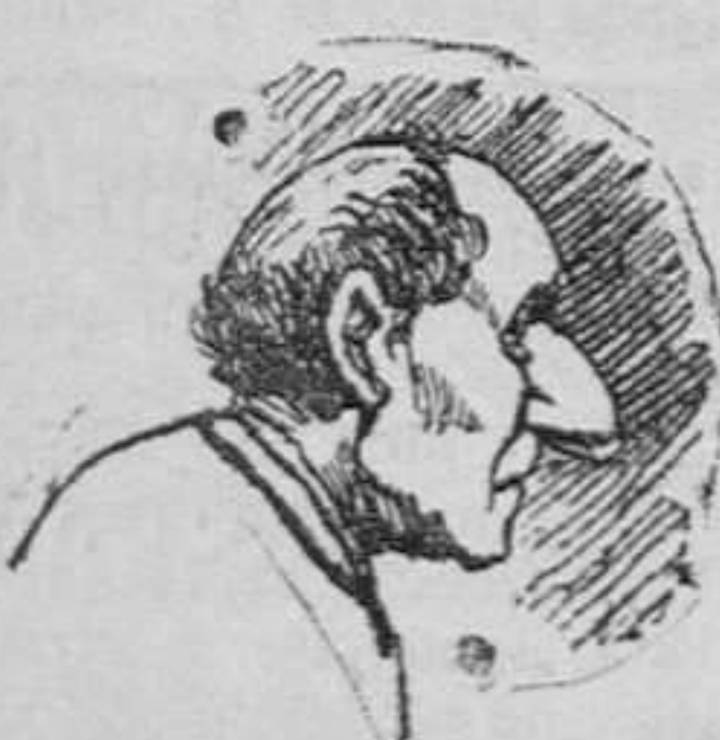
El portero del número 109 de la calle de Fuencarral.

Portero que fué de la casa de la calle de Fuencarral frente á la del crimen.