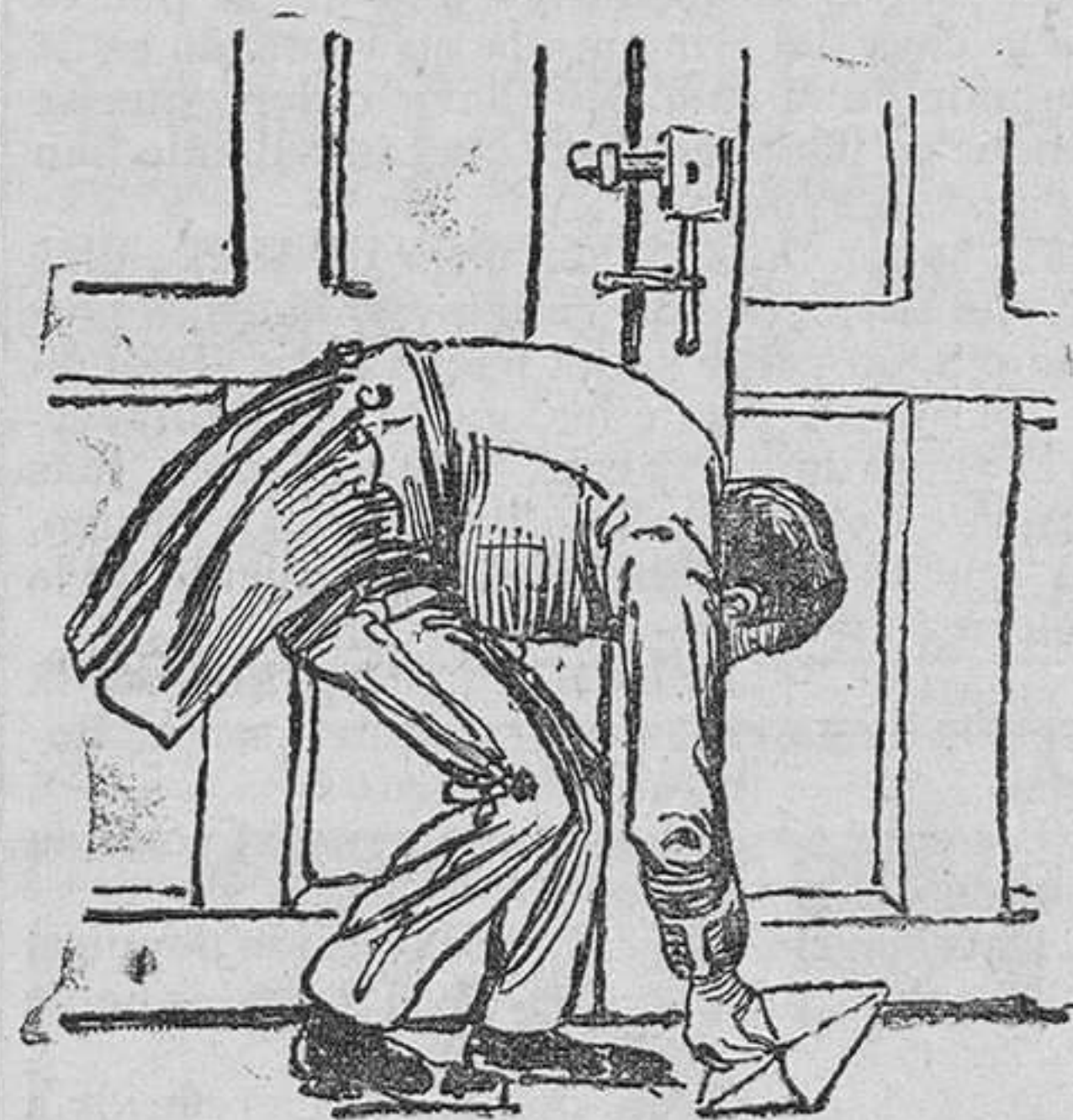
Procedimiento para enviar las cuartillas á los periódicos.