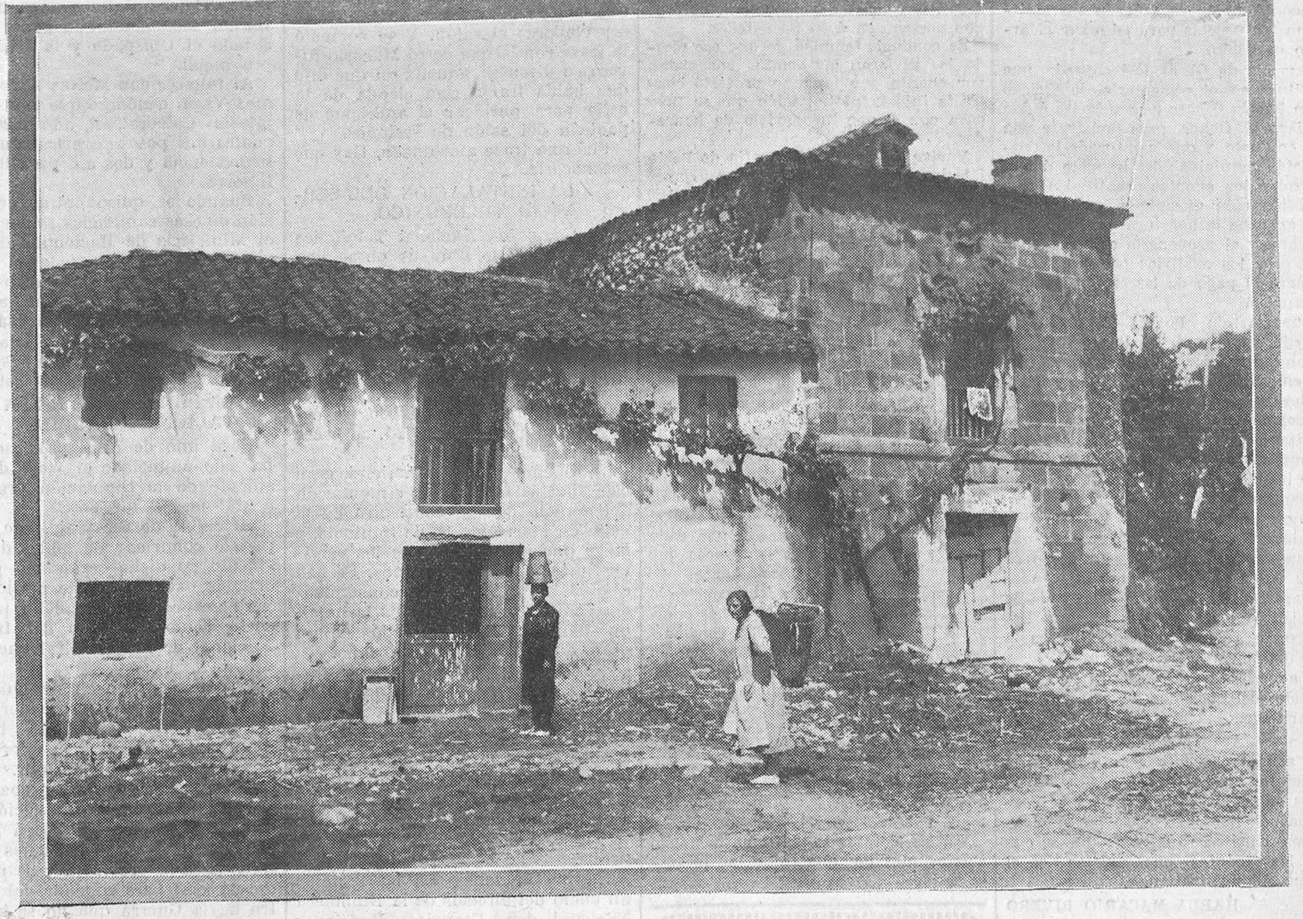
SOLARES.—Una de las más típicas casas solariegas de la Montaña.

Dr. J. MURIEDAS Especialista en garganta, nariz y oídos Consulta de 9 a 12 y de 2 a 3. Daoiz y Velarde, 1, 2.º - Santander.