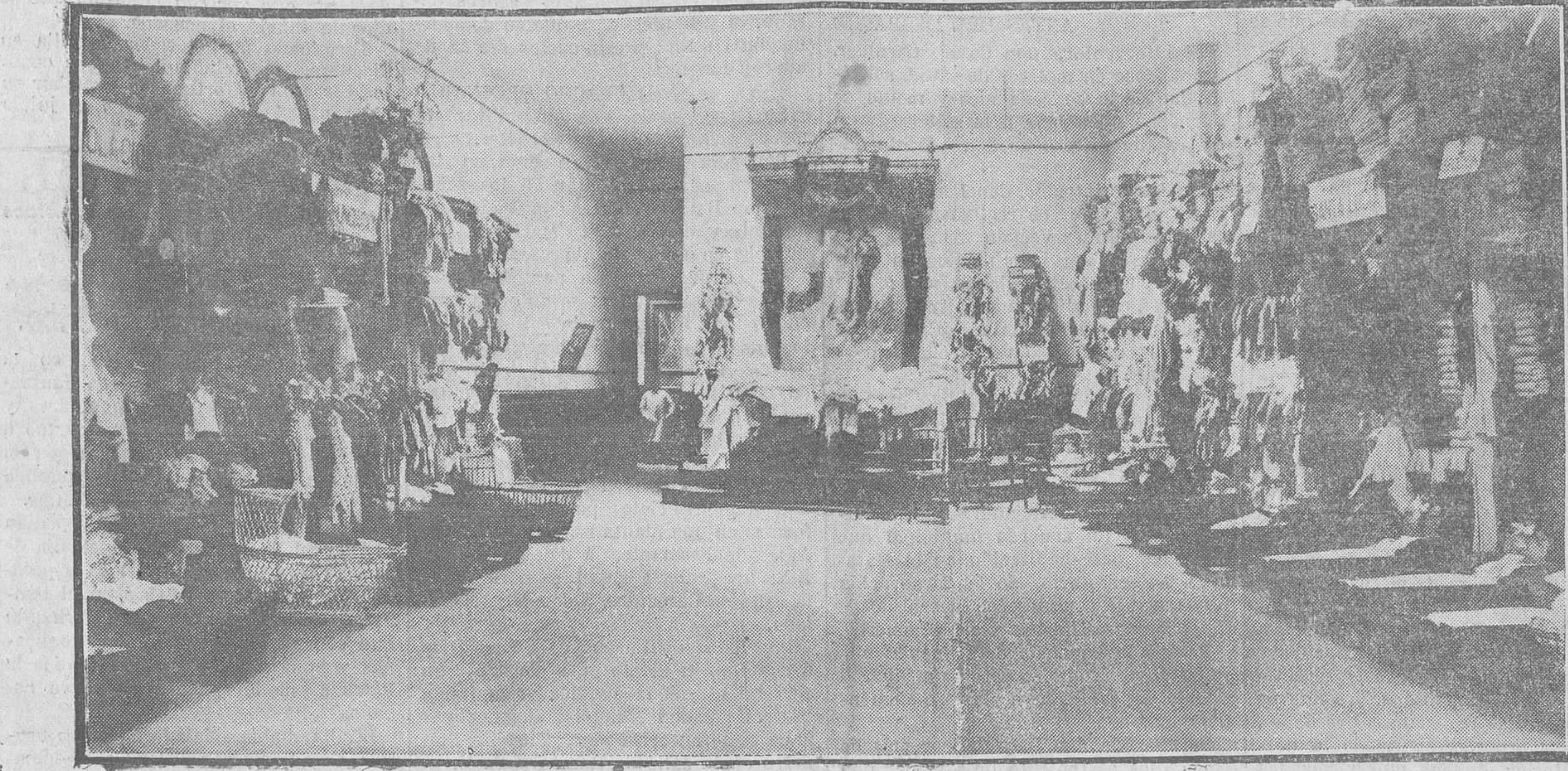
ROPERO SANTA VICTORIA. -- Detalle de la exposición que, desde hoy, puede visitarse en la Residencia de la Armada (Calle de la Armería).

—A nosotros nos parece muy bien, le decimos al buen hombre de café que acostumbra á resolver fácilmente sobre la mesa los magros problemas del mundo. Pero al buen ciudadano sigue pareciéndole mal. No está conforme con que á la Casa Krupp—que no poseerá la mayoría de las acciones—se le conceda el derecho exclusivo á nombrar y disponer del personal técnico y directivo de la industria. Eso, no. Es de una inferioridad para nuestro pres-