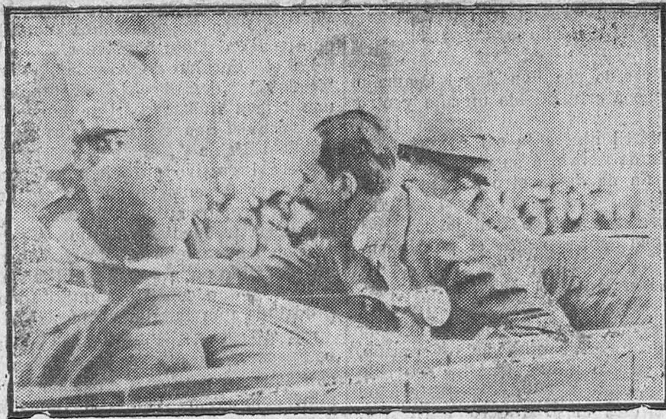
Los Reyes saludando á las autoridades, á su entrada en la población (Foto. Del Río).

En el Palacio de la Magdalena quedaba la real familia española,