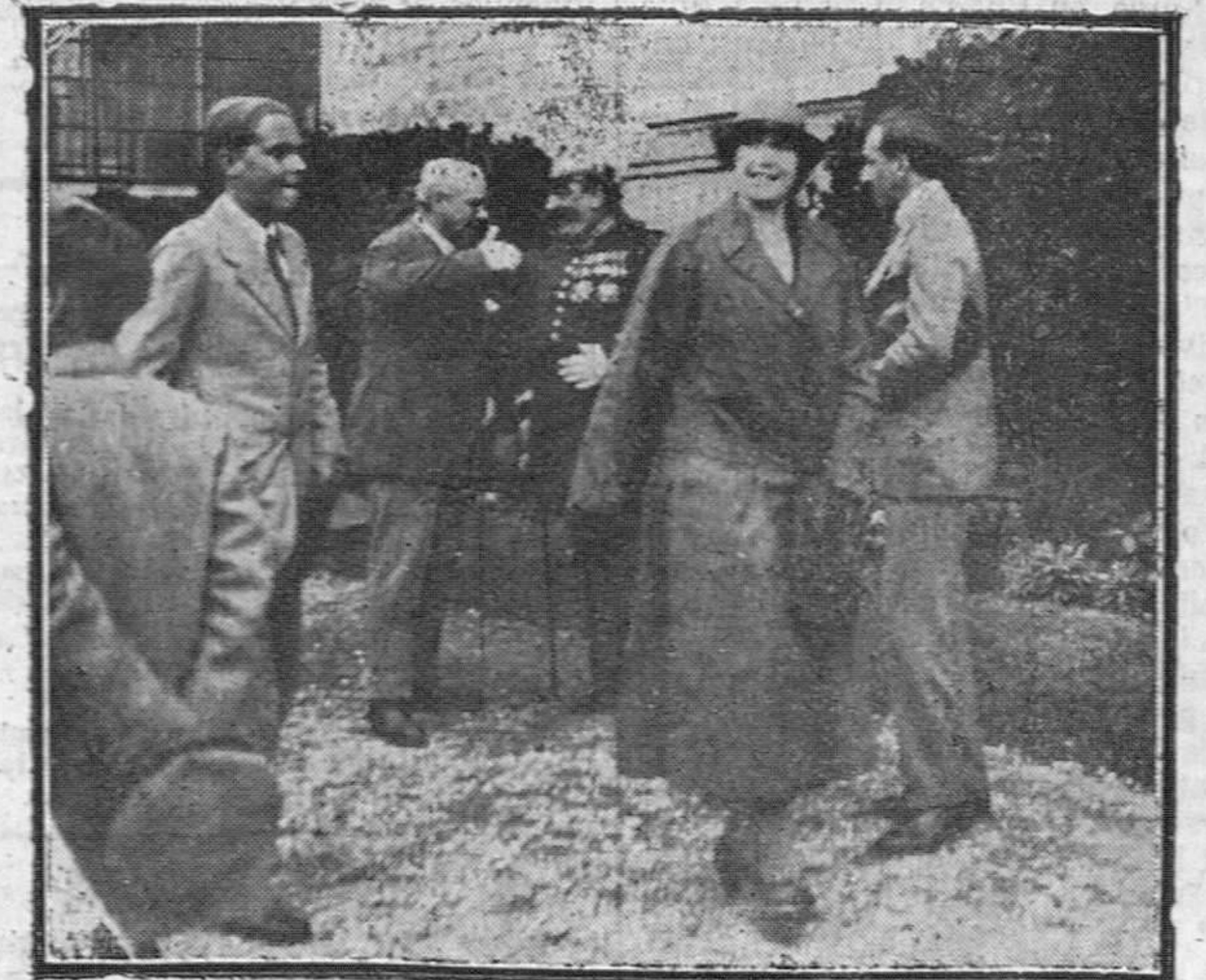
Los Reyes y el Príncipe de Asturias, á su llegada á Palacio.

La Reina y el Rey, como sorprendidos por ese recibimiento inesperado, saludaban sonrientes y emocio-