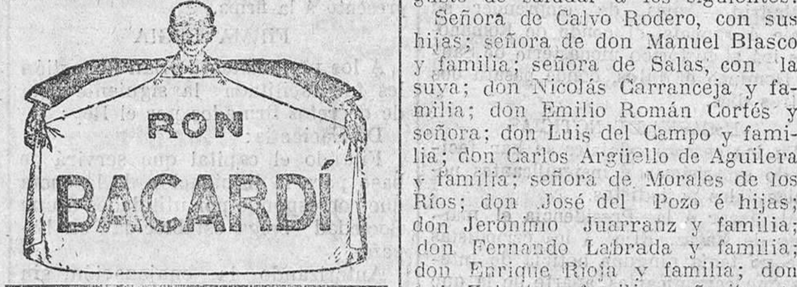
RON BACARDÍ Benjamín