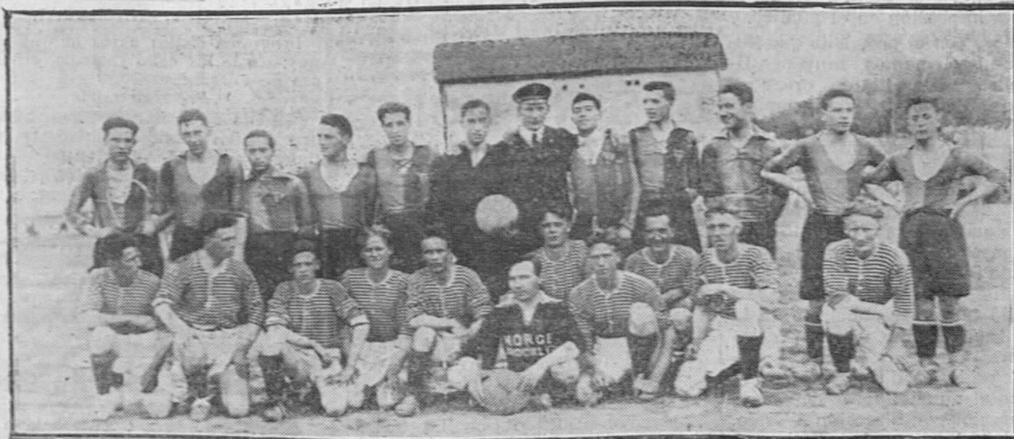
El equipo Unión Montañesa y selección del crucero "Tordenskjold", que jugaron el domingo en Miramar.

ABOGADO. Consulta, hasta nuevo aviso, únicamente viernes y sábados, de 9 á 1 de la mañana y de 3 á 5 de la tarde. Amós de Escalante, 42, primer derecha.