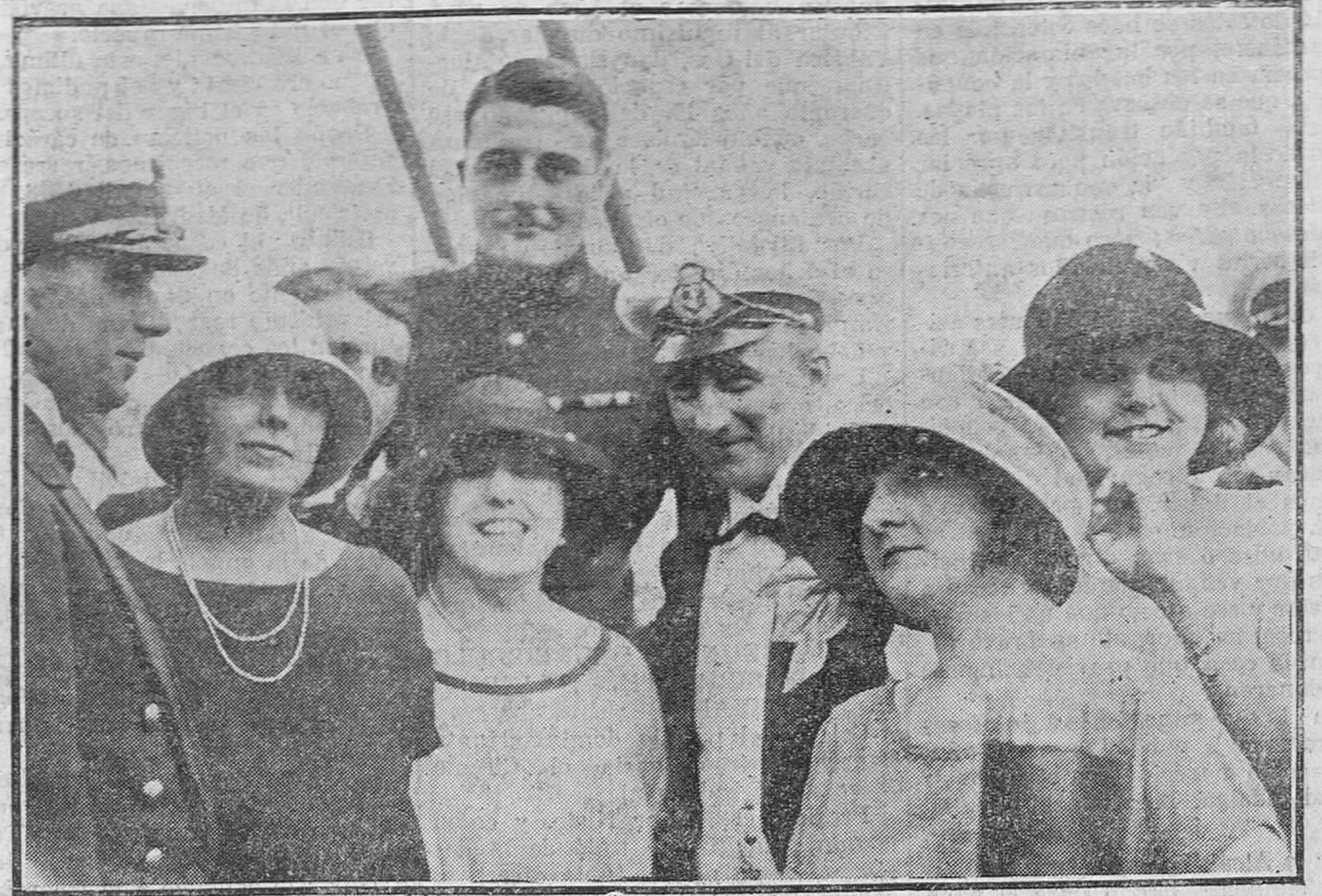
Grupo de asistentes al baile celebrado en el crucero "Tordenskjold".

CARLOS M o CONACHY DENTISTA Calle Castelar, 4