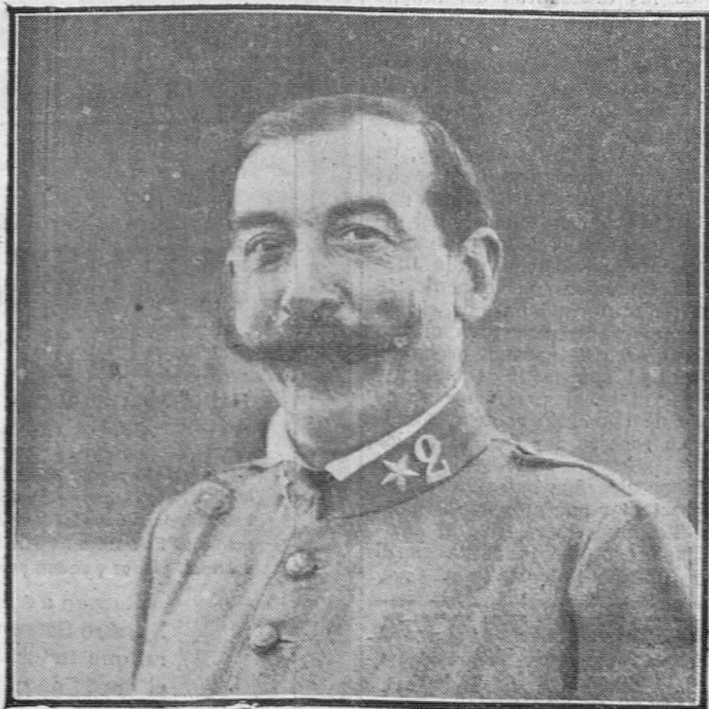
El gobernador civil de la provincia, general don Andrés Sallquet.