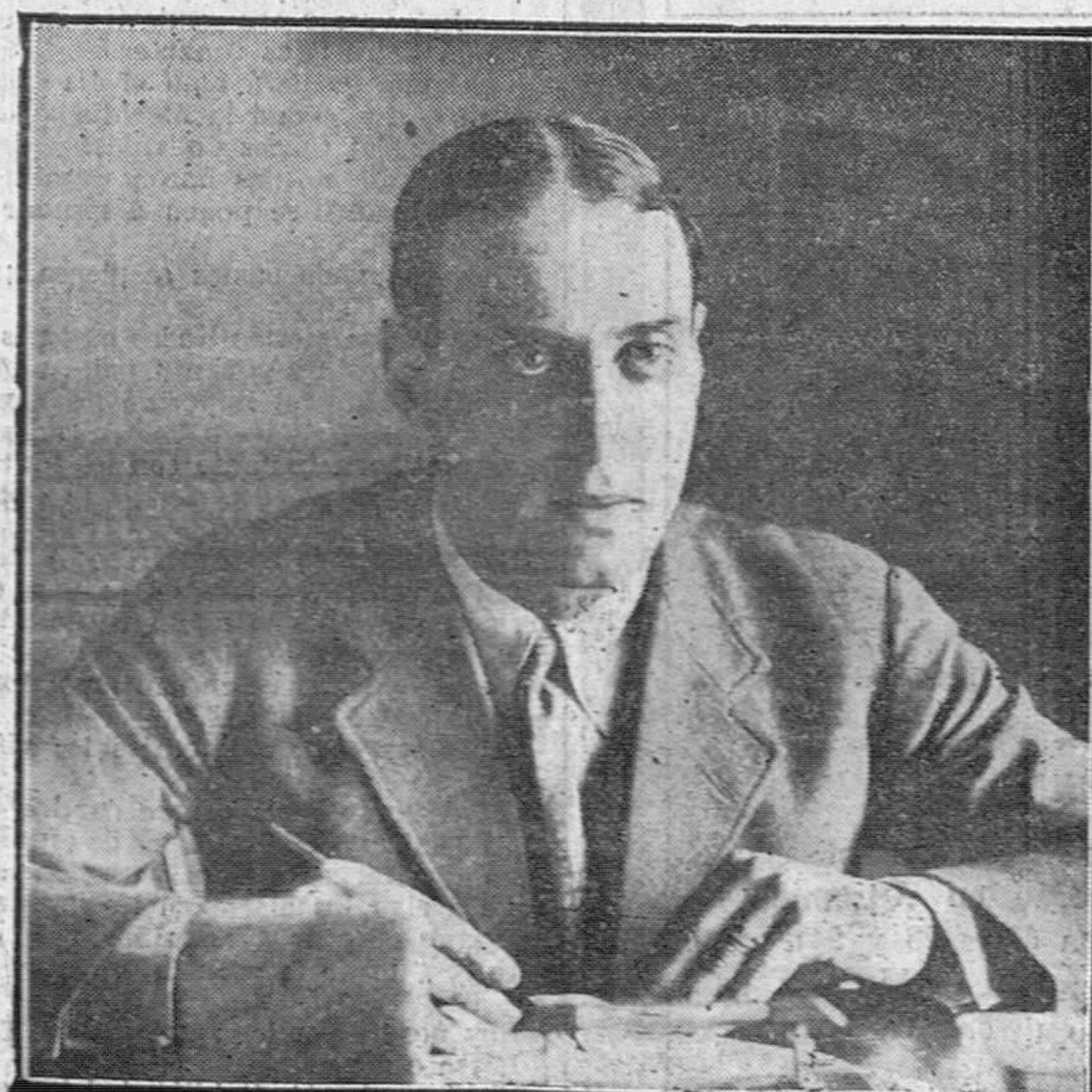
El alcalde de Santander, don Rafael de la Vega Lamera.