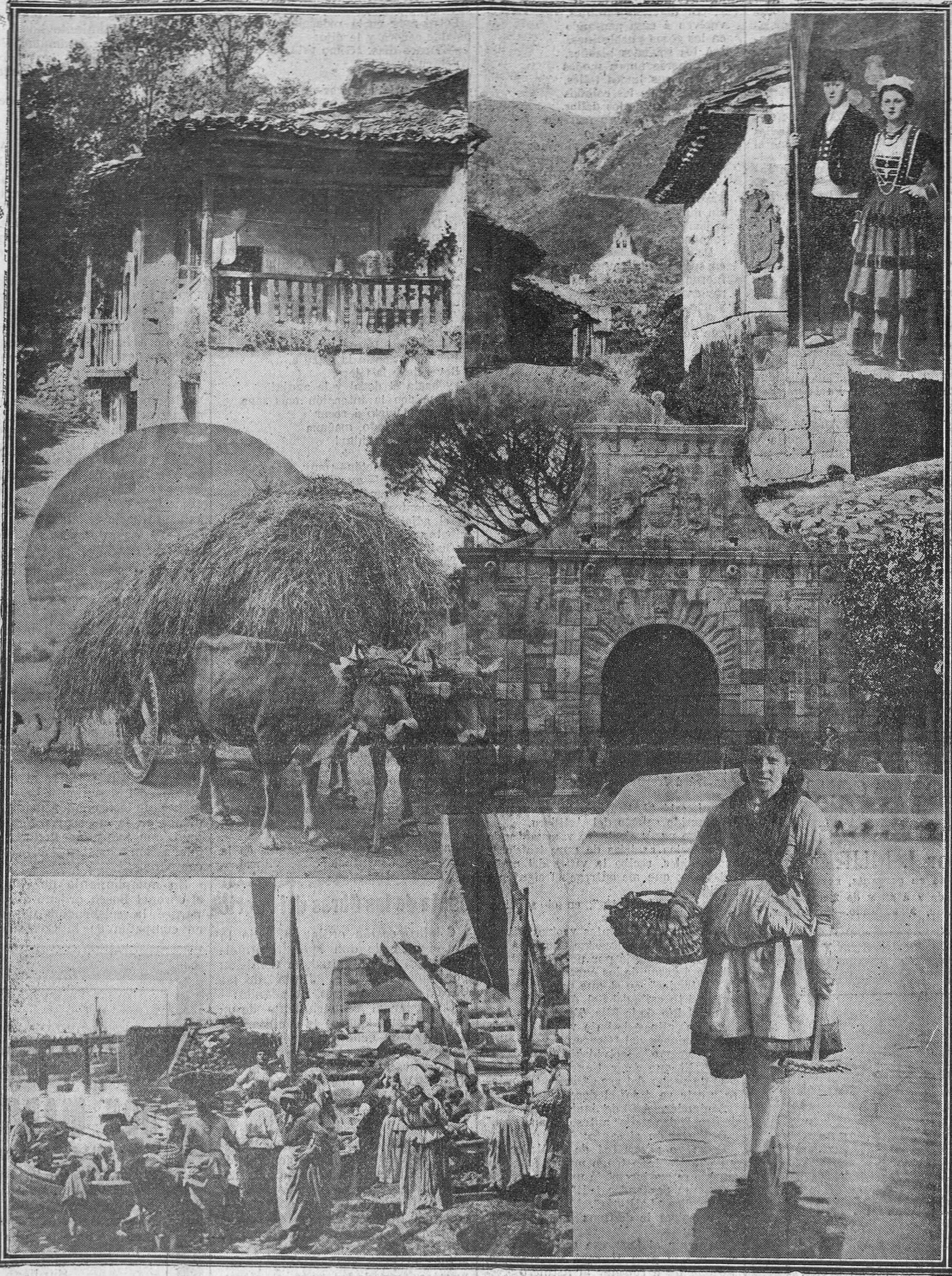
Artística composición de motivos montañeses, original del notable fotógrafo señor Duomarco.

A la armonía que reina en el seno de la entusiasta Asociación de los periodistas santanderinos, han respondido los vientos de cordialidad que acarician hoy á todos los suelos de la Montaña. ¿Qué fué de aquellas viejas rivalidades de unos pueblos con otros muy próximos? ¿Qué de aquellos rencores entre convencios: de aquellas animadversiones que, avivadas por las conveniencias de algunos astutos, hacían imposible la paz de la aldea, tan dulcemente cantada en las tiernas églogas de los poetas bucólicos? ¡En al-lido de lobo se había ido convirtiendo, en la placidez de los más bellos paisajes, el tierno balido de la oveja!... Pero ya todo pasó, y en cuanto se ha dicho: "¡Arriba los co-