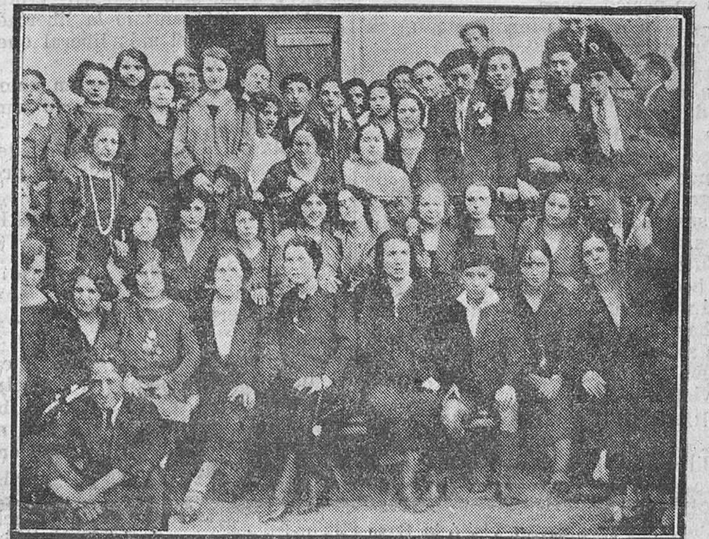
Un grupo de obreras del Sindicato de la aguja.