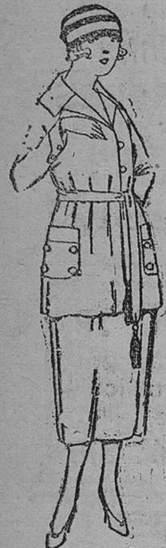
Paletots de punto de seda, en negro y colores, de ptas. 85 á 220.

Camisería, Géneros de punto, Corbatería, Guantería, Sombrerería, Zapatería, Paraguas, Bastones y Artículos de Viaje