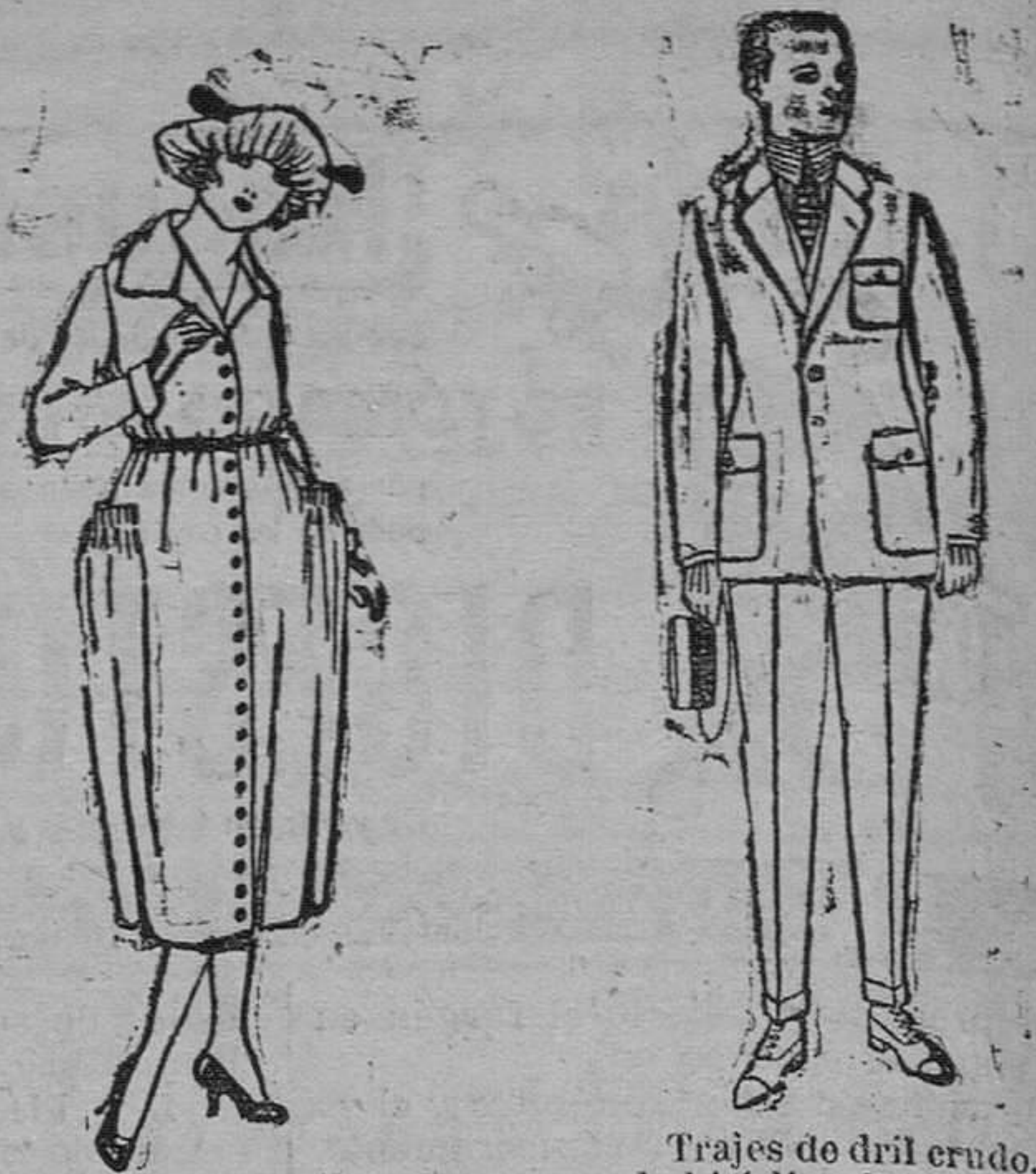
Vestidos de gabardina, lanilla, estambre, etc., en negro, azul y color, de ptas. 100 á 120.