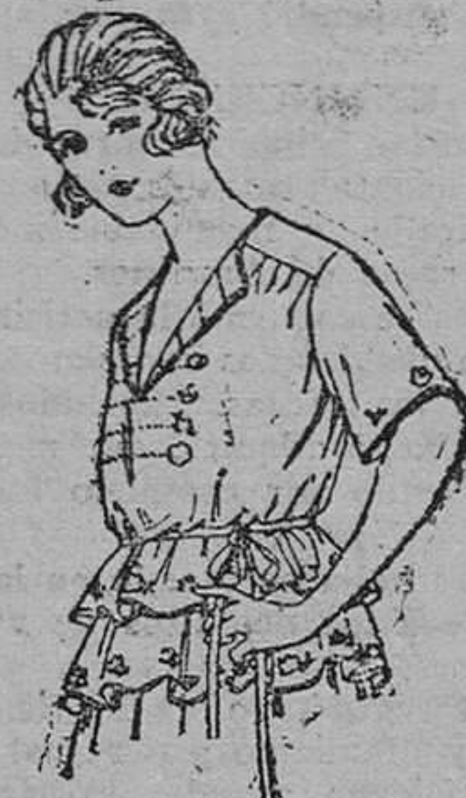
Blusas de voile de seda calados y bordados hechos á mano, de ptas. 48 á 52.