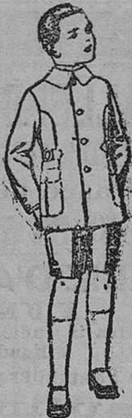
Trajes modelo Sport, de lanilla, estambre, melton, etcétera, para niños de 4 á 9 años, de ptas. 30 á 48.