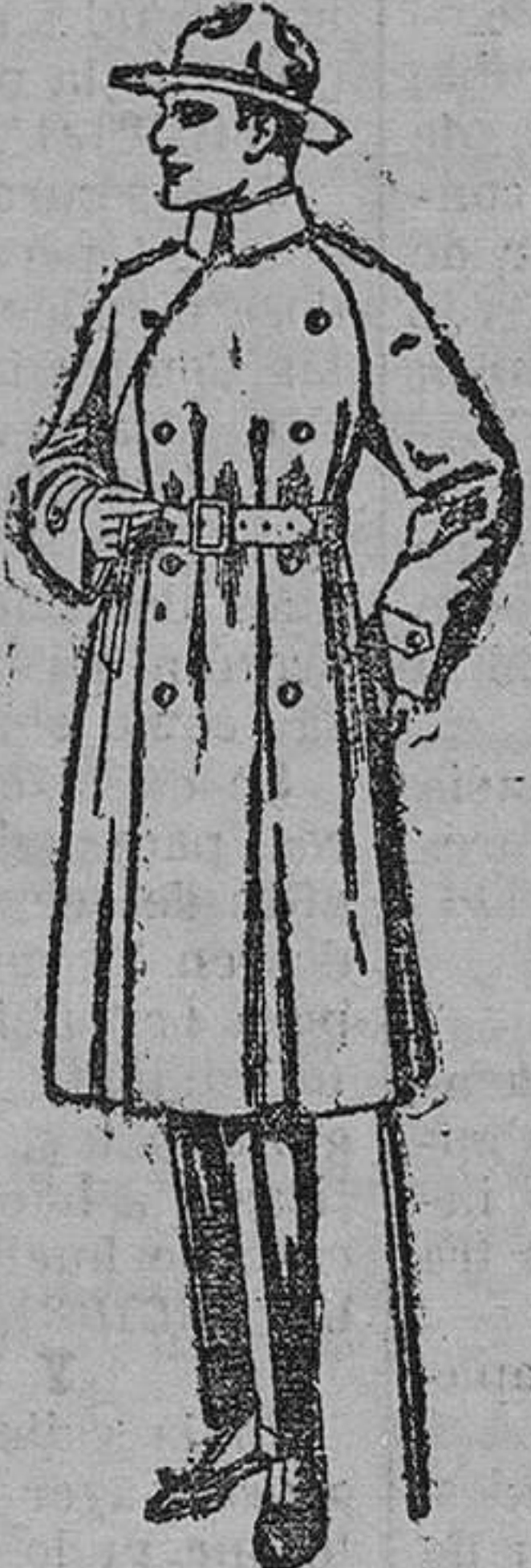
Gabanes impermeabilizados con cinturón «American trench coat», de ptas. 200 á 350.