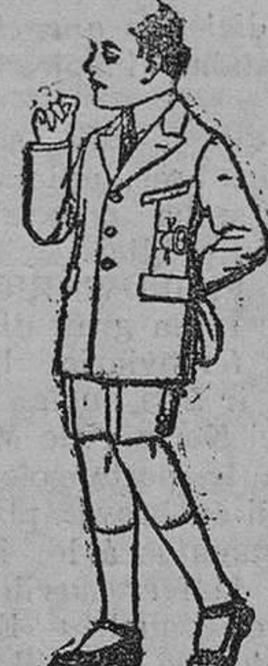
Trajes modelo Sport, de lanilla, estambre, melton, etcétera, para niños de 7 á 12 años, de ptas. 28 á 50.