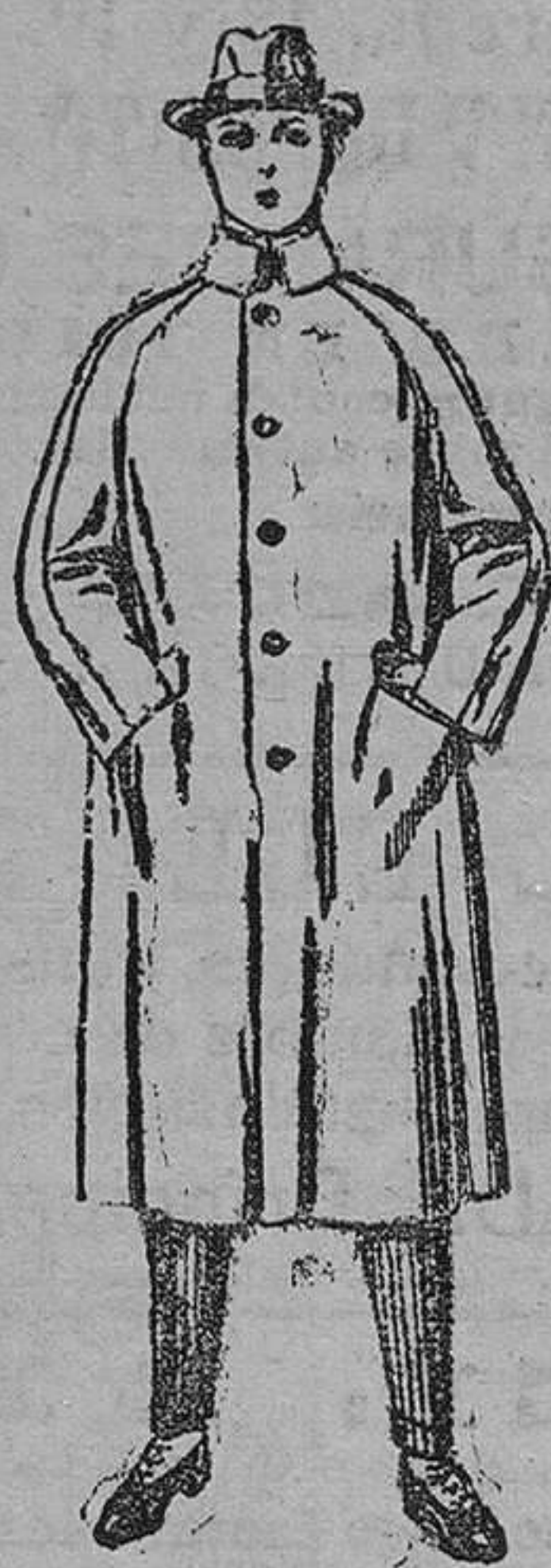
Gabanes de patin choviot ó cover, de ptas. 80 á 160.