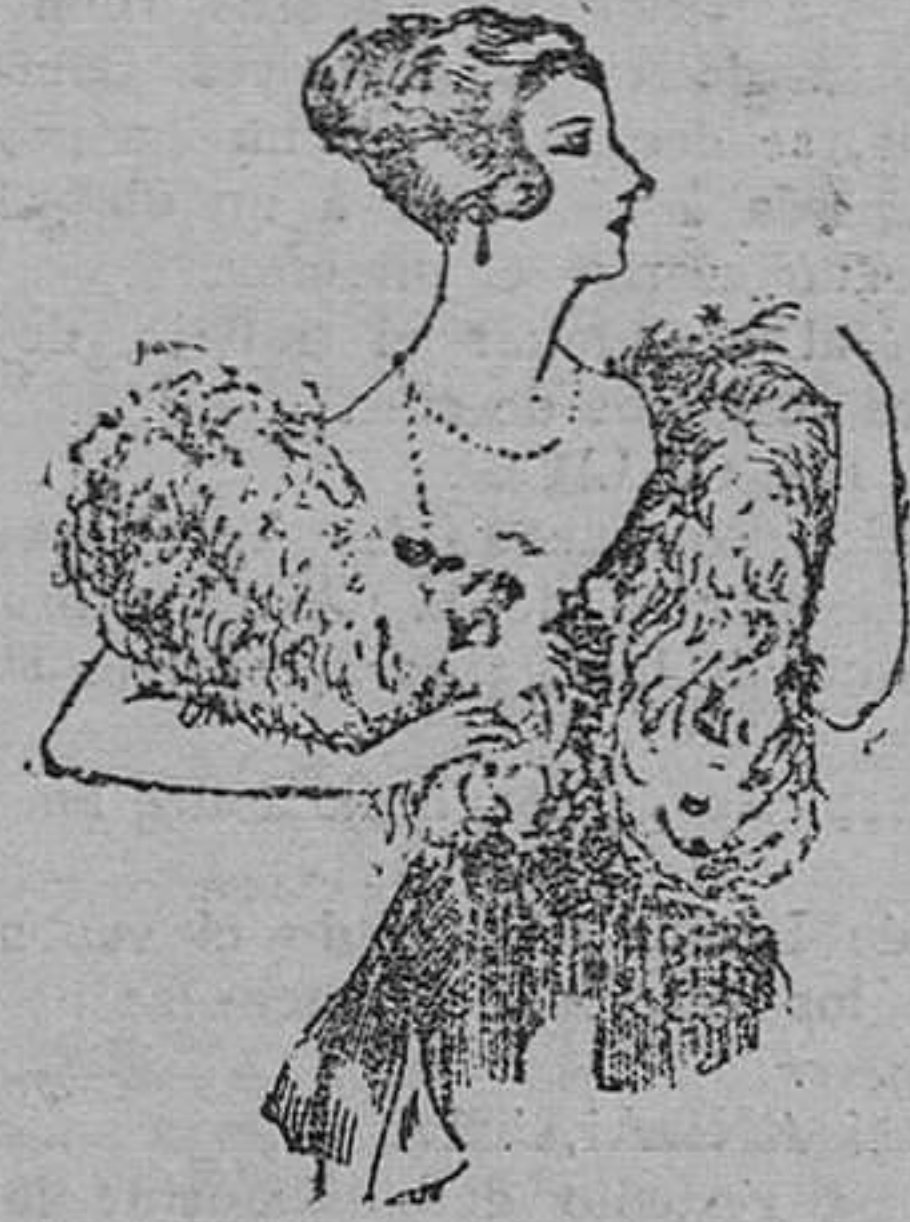
Boas pluma, gran surtido en tamaños y colores, de ptas. 30 á 90. Gran surtido en capelinos marabú de ptas. 33 á 85.