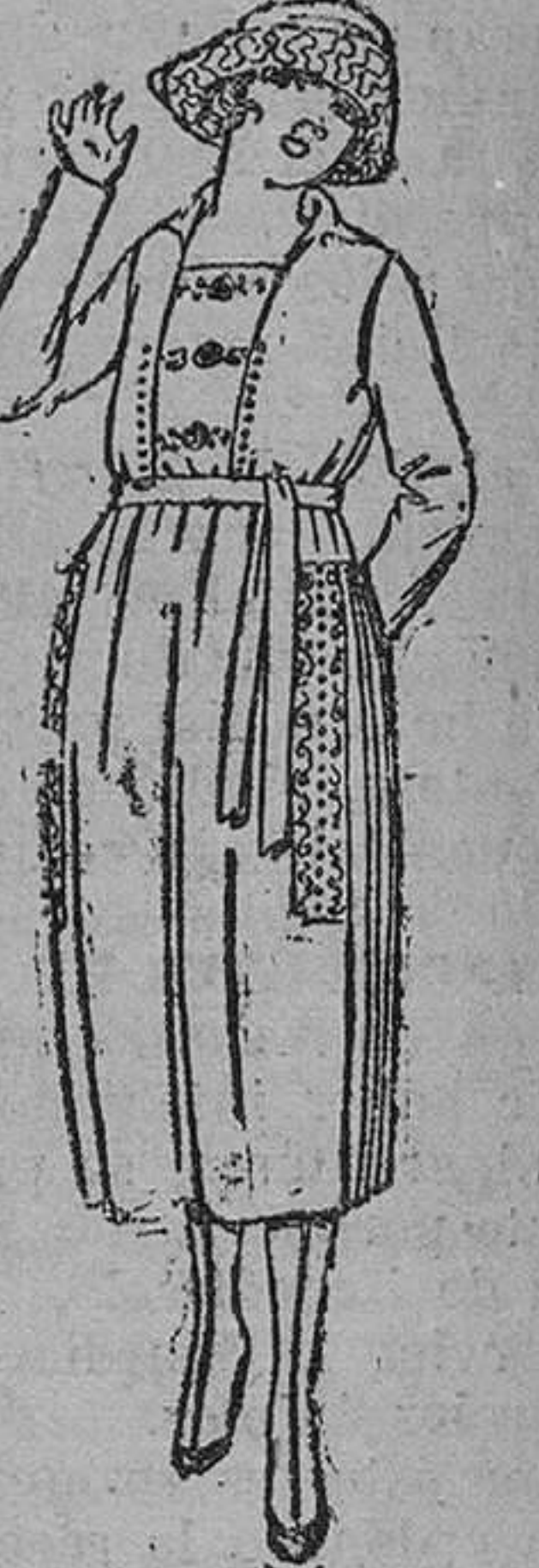
Vestidos de sarga inglesa, lanilla, etc., en negro, azul y color, adornos bordados, de ptas. 105 á 120.