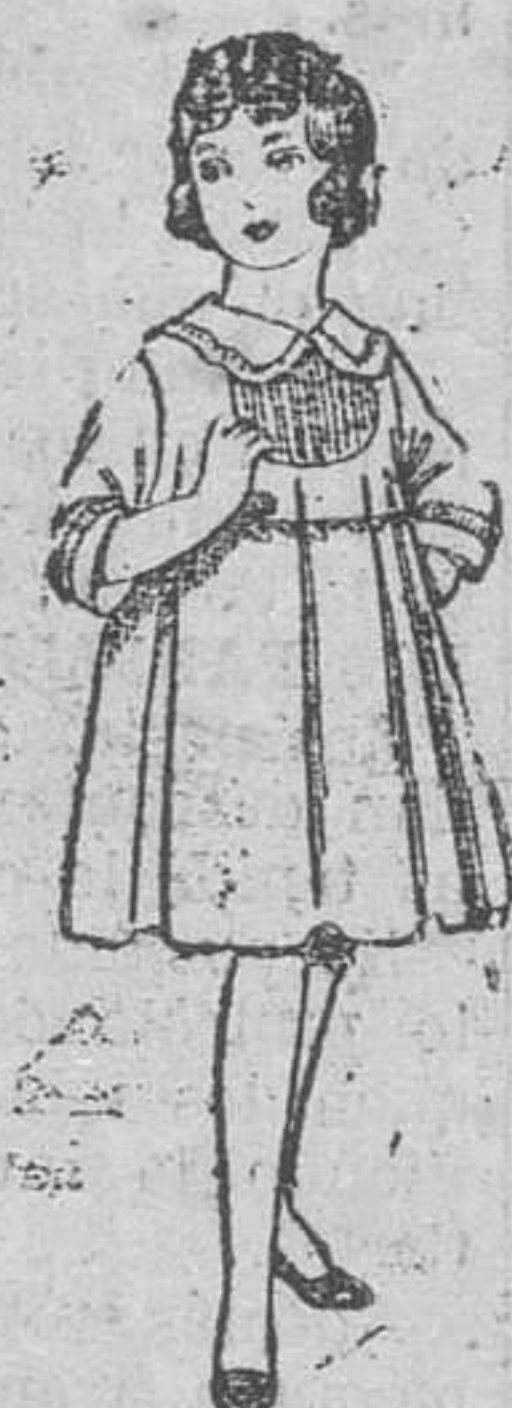
Vestido de lanilla azul, con bordados, para niñas de 4 á 9 años. De pesetas 22 á 28.