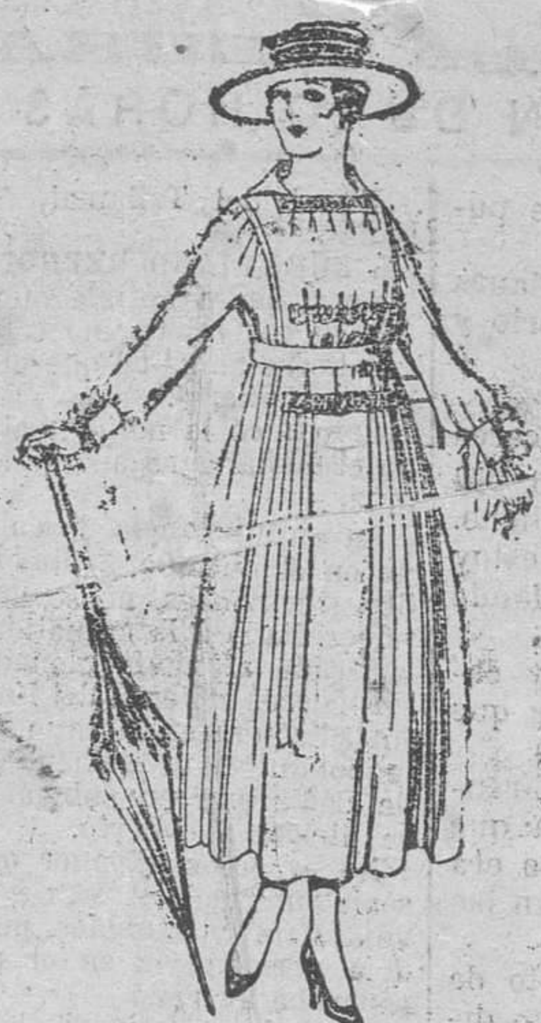
Vestido de lanilla, negro, azul y color. De pesetas 60 á 70.