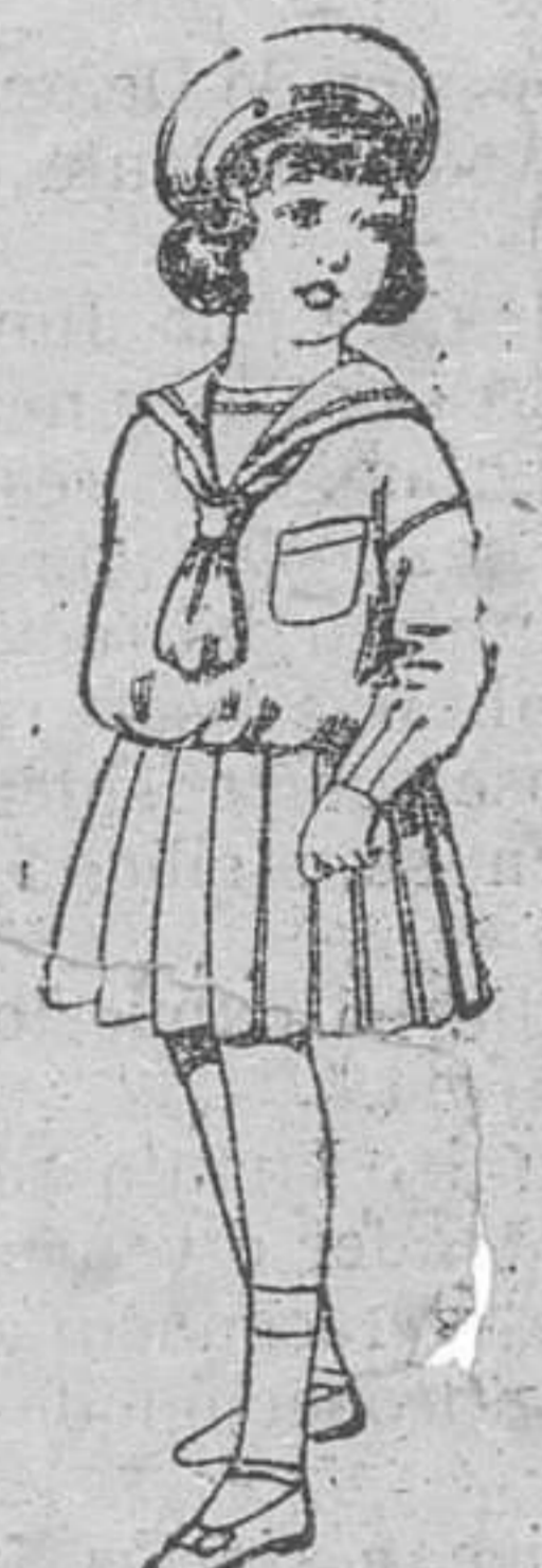
Trajes mariposa, de lanilla azul, para niñas de 4 á 9 años. De pesetas 32 á 39.