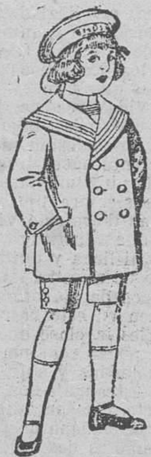
Traje modelo sport, de lanilla, etc. etc. para niñas de 4 á 9 años. De pesetas 14 á 32.