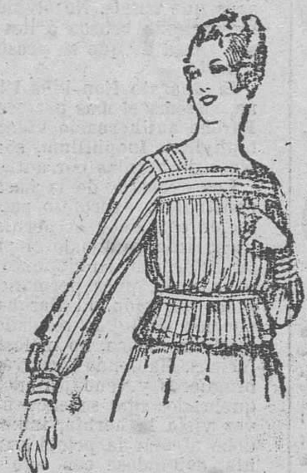
Blusa de batista listada. A pesetas 4'50.