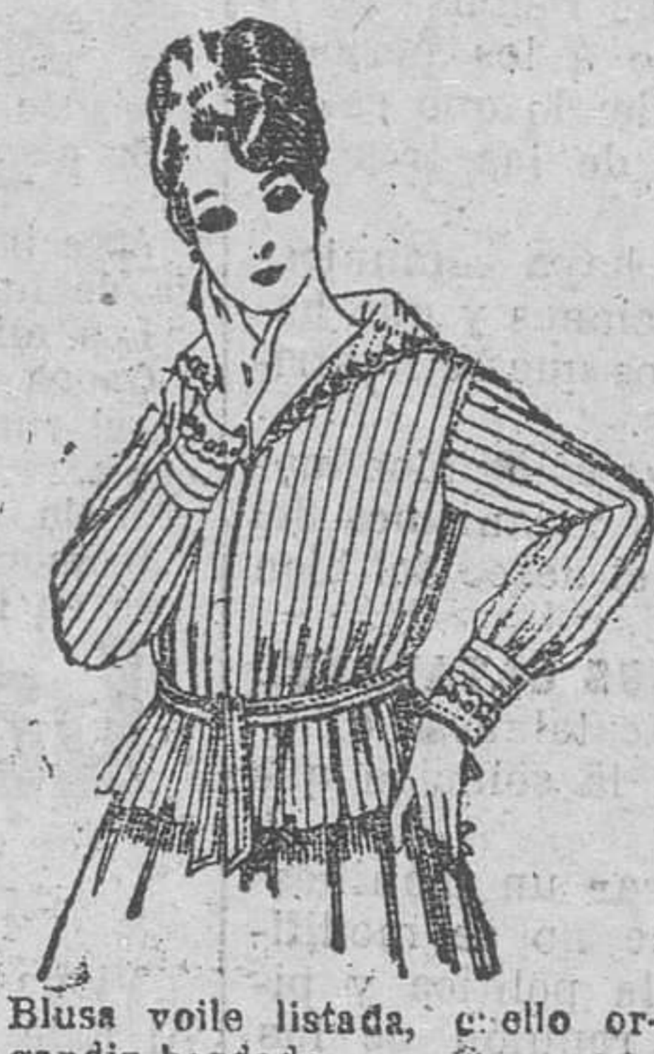
Blusa voile listada, cuello organdín bordado. A pesetas 9'50.