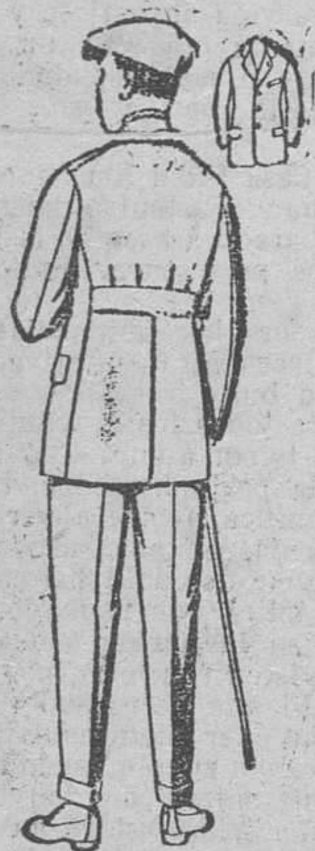
Traje modelo sport, de lanilla, etc. etc. para jovenes de 10 á 18 años. De pesetas 27 á 52. Los mismos en dril. De pesetas 11 á 21.