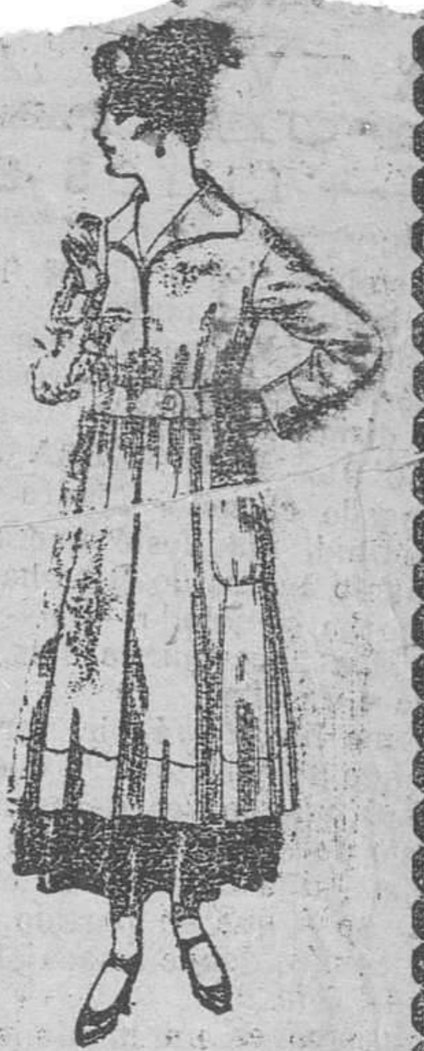
Abrigo de tricot de lana, colores lisos. De pesetas 68 á 75.