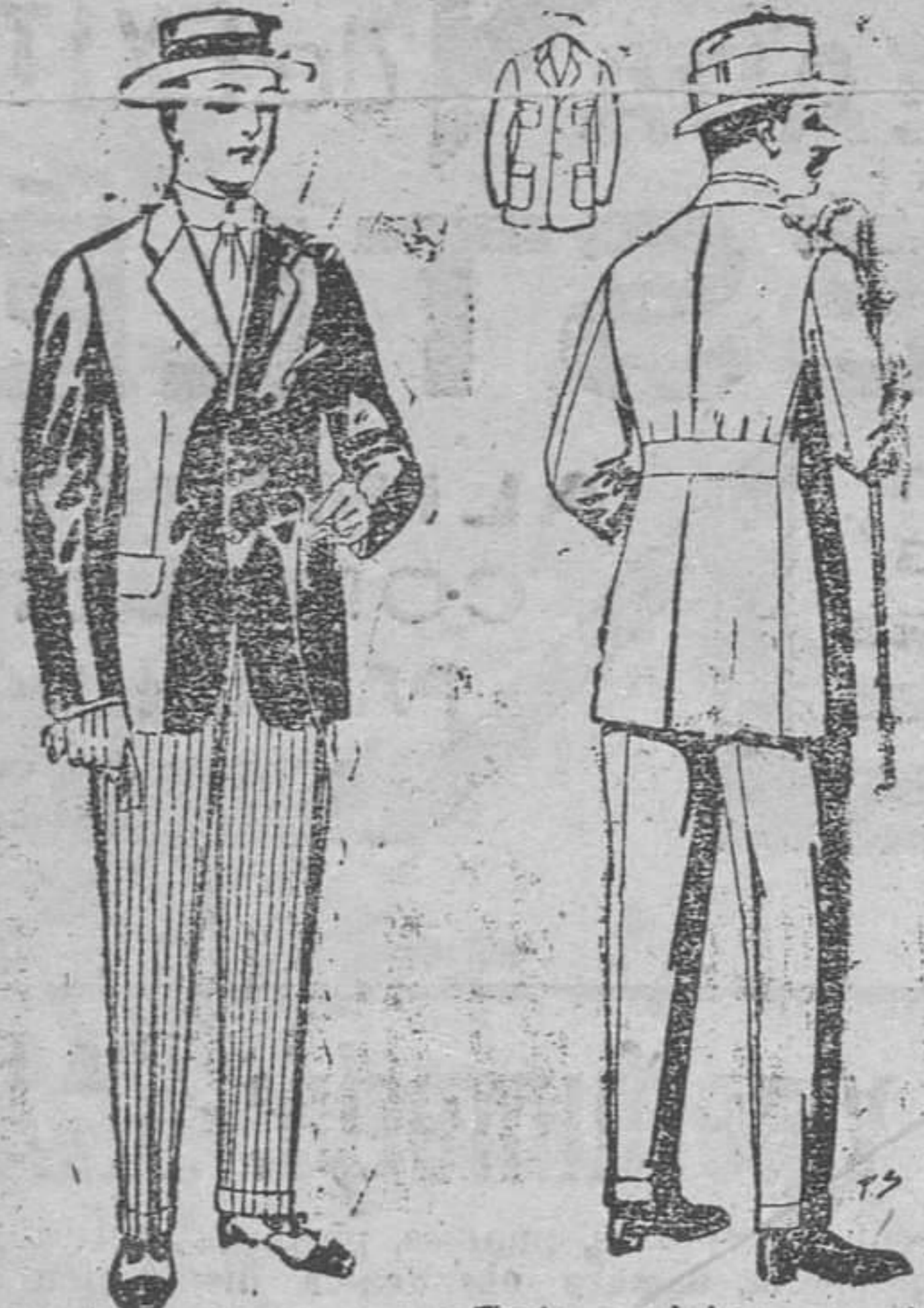
Traje de alpaca negra. De pesetas 32 á 16. Pantalones de franela blanca ó listada. De pesetas 15 á 25.