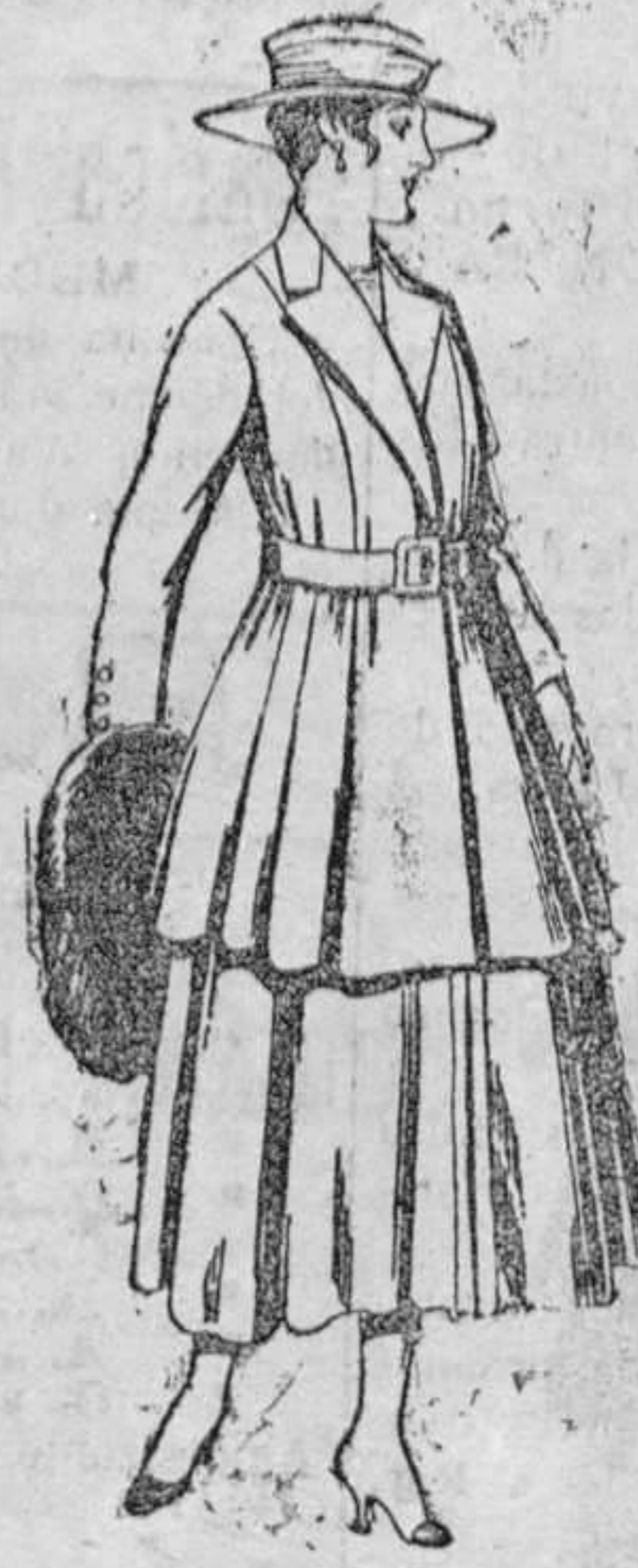
Traje de lana, para señora, en color negro y azul. De pesetas 85 á 100.