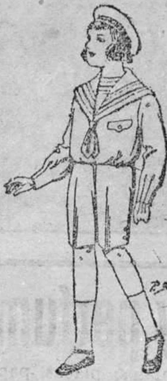
Traje de jerga azul para niños de 4 á 9 años. De pesetas 9 á 22.