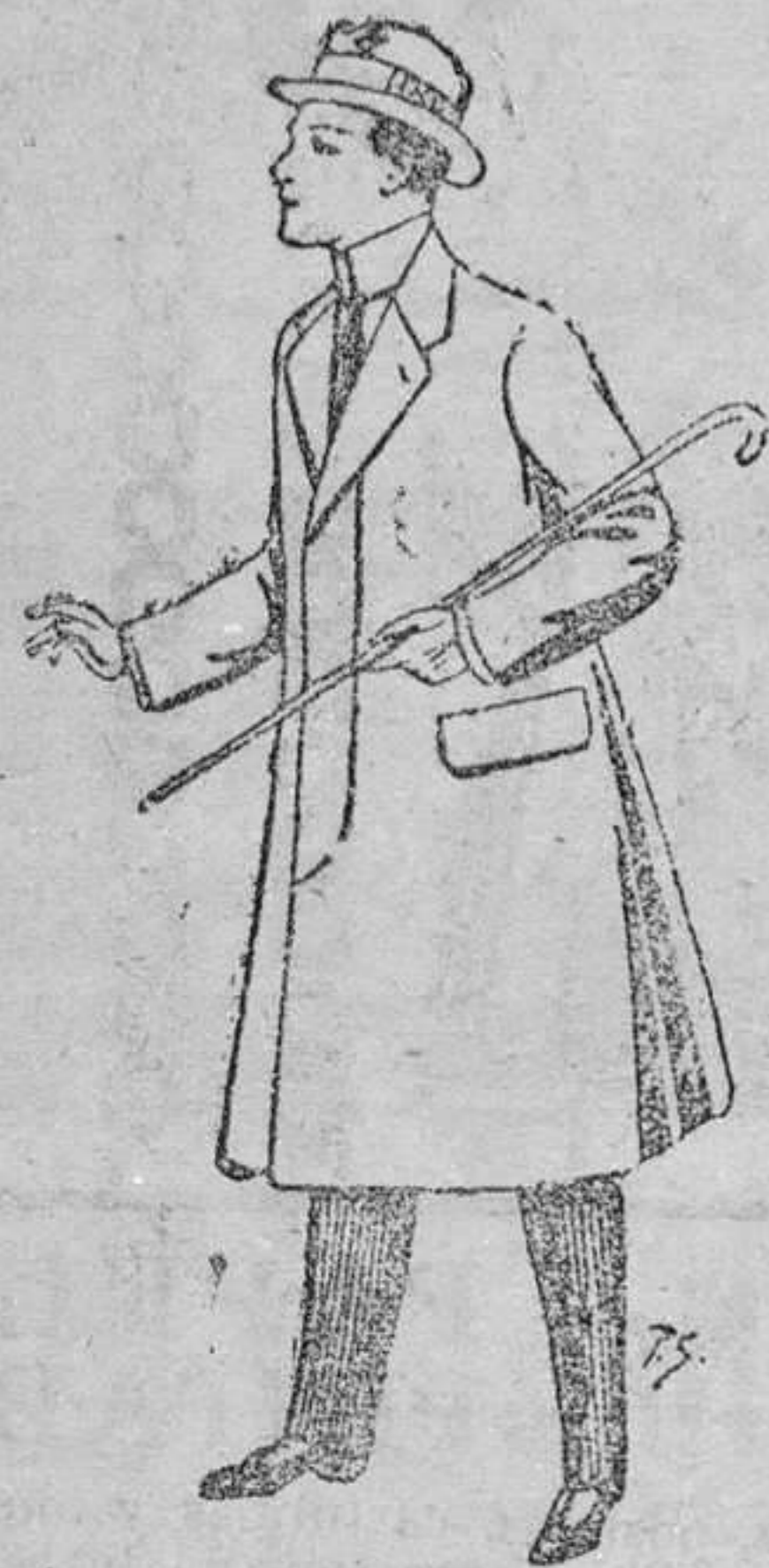
Gabanes de lana ó melton con forro satén ó seda, para niños de 10 á 16 años. De pesetas 20 á 56.