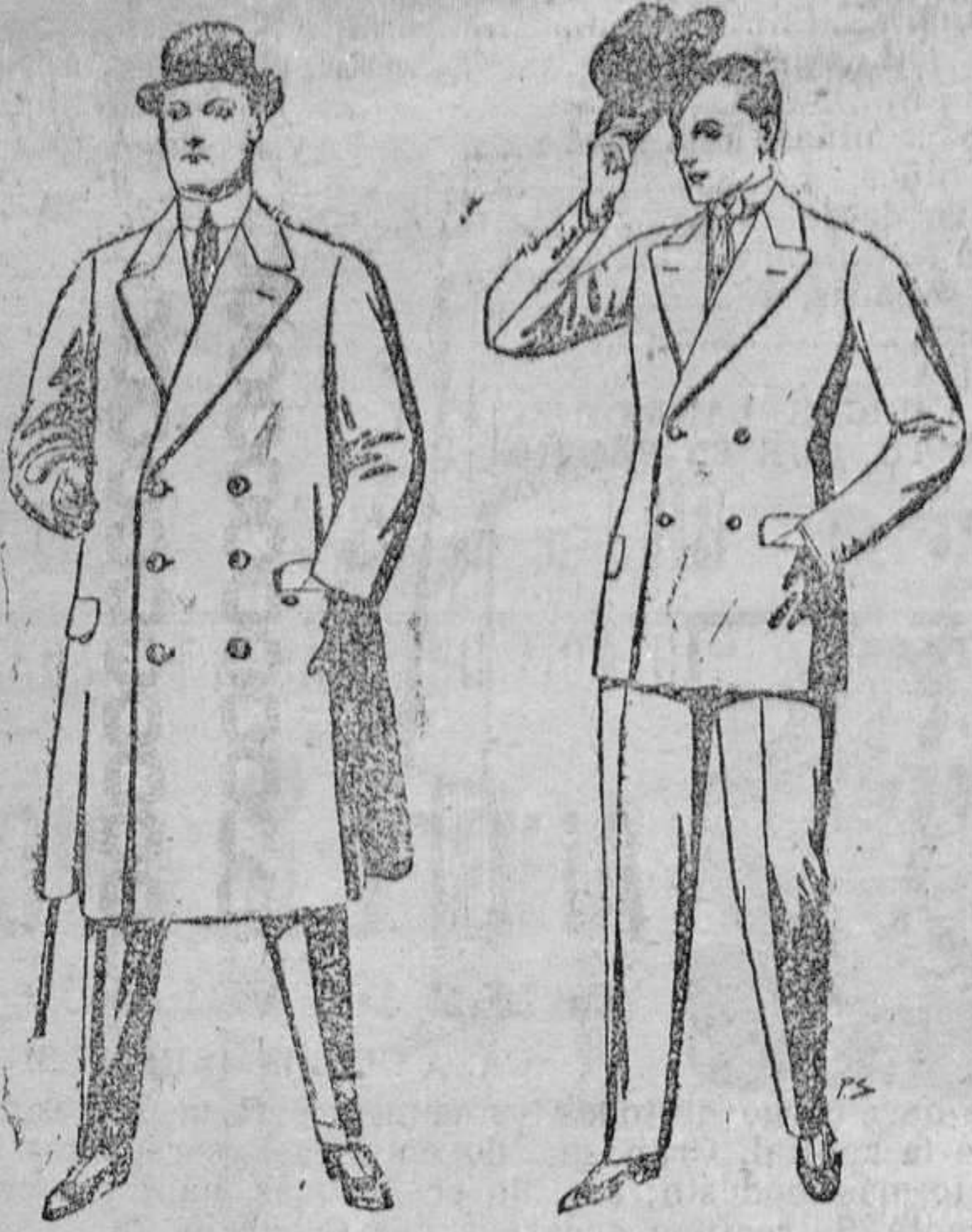
Gabanes de patén ó cheviot, con cinturón De pesetas 59 á 110.