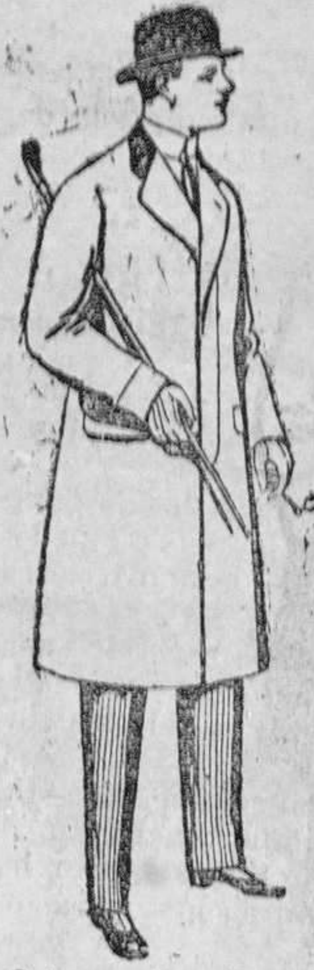
Gabanes de patén, melton y cheviot, con forros seda satén ó escocés. De pesetas 35 á 100.