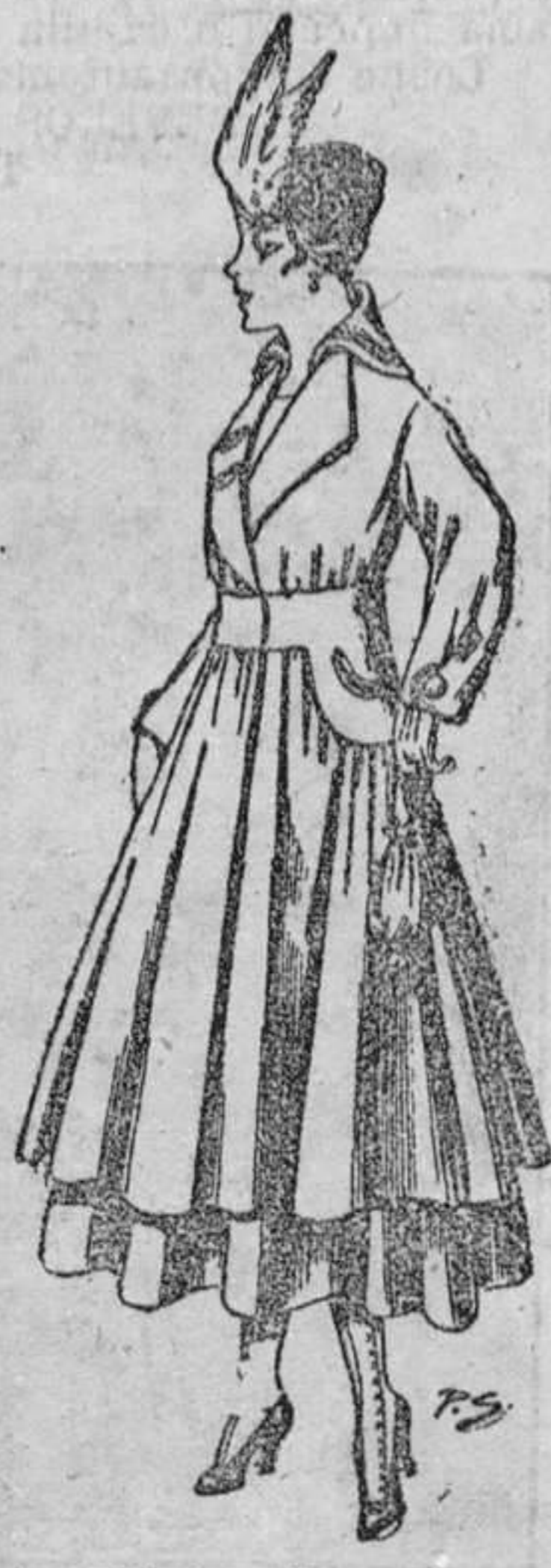
Abrigo de patén, color, para señora. De pesetas 80 á 100.

Camisería, Géneros de punto, Corbatería, Guantería, Peletería, Sombrerería, Zapatería, Paraguas, Bastones y Artículos de viaje