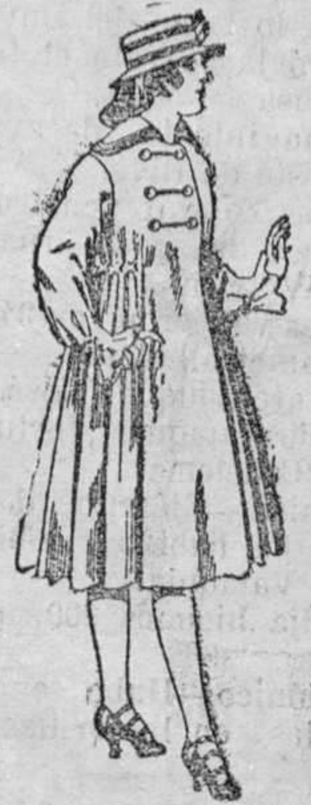
Abrigos de patén para jovencitas de 11 á 15 años. De pesetas 35 á 50.