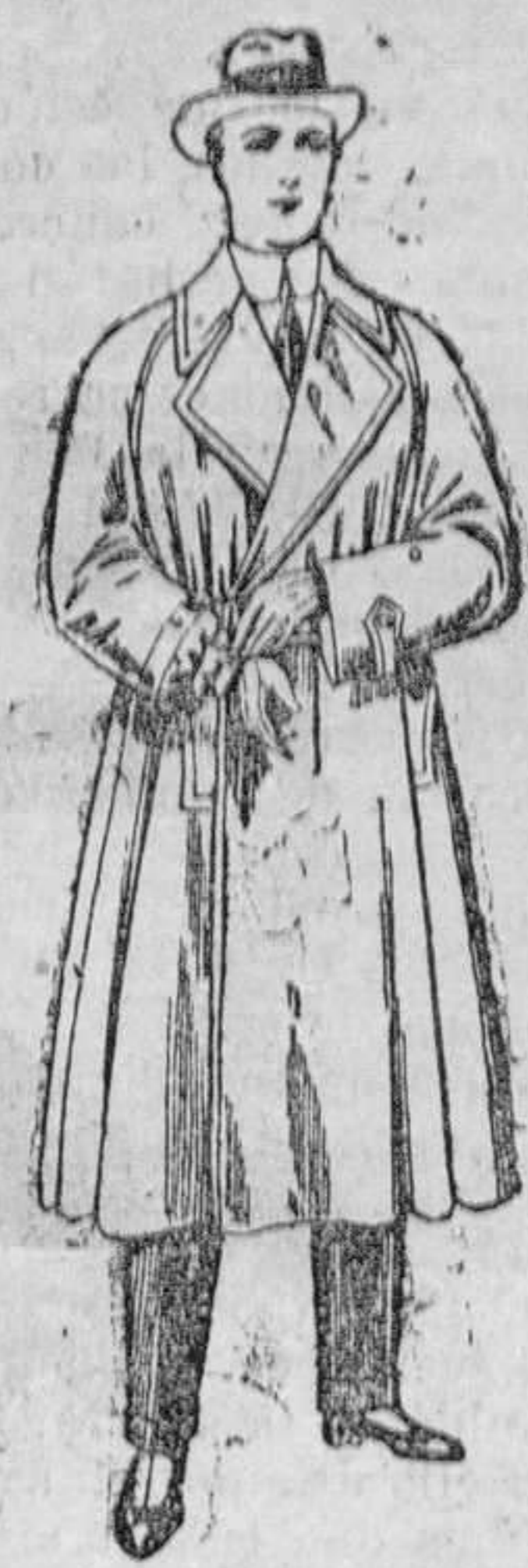
Gabanes impermeabilizados con cinturón, color beige. De pesetas 45 á 110.