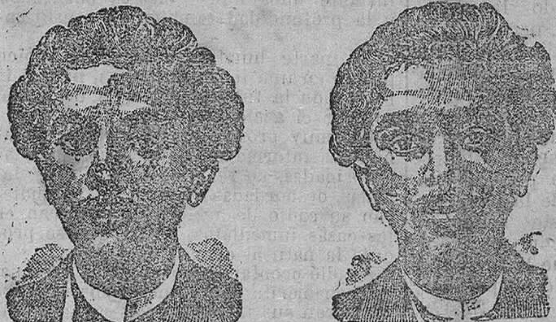
Antes de la Curación. Después de 15 días de tratamiento.

Para todas las Enfermedades de la PIEL, LLAGAS de las PIERNAS, ARTRITISMO, REUMATISMO, GOTA, DOLORS, etc., etc.