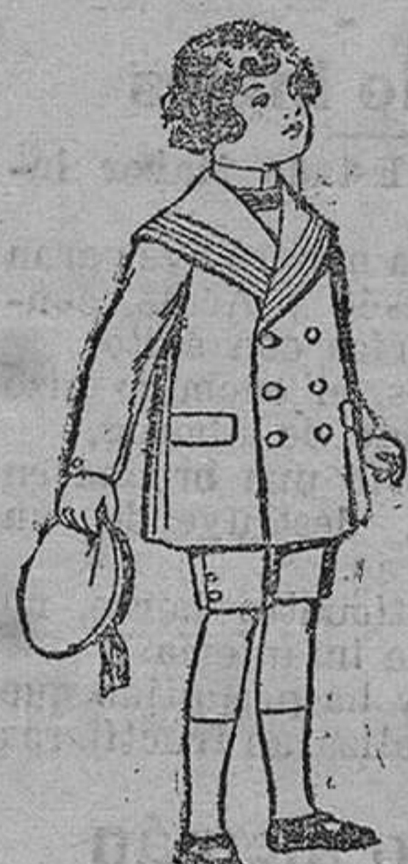
Trajes modelo matelot, de vicuña azul para niños de 4 á 9 años. De pesetas 12 á 31.