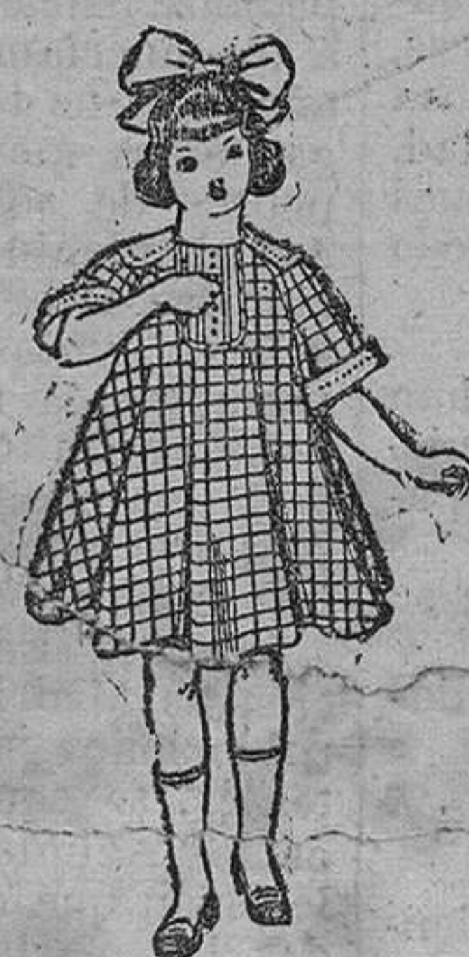
Vestidos de lanilla, para niñas de 4 á 9 años. De pesetas 15 á 25.