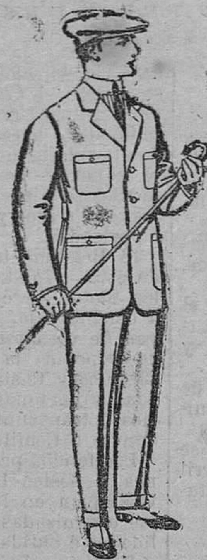
Trajes modelo Sport, de lanilla, cheviot, etc. De pesetas 40 á 47.