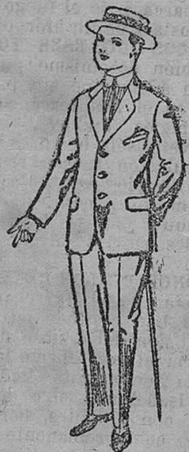
Trajes de lanilla, vicuña, etc. para jovencitos de 10 á 16 años. De pesetas 14 á 43.