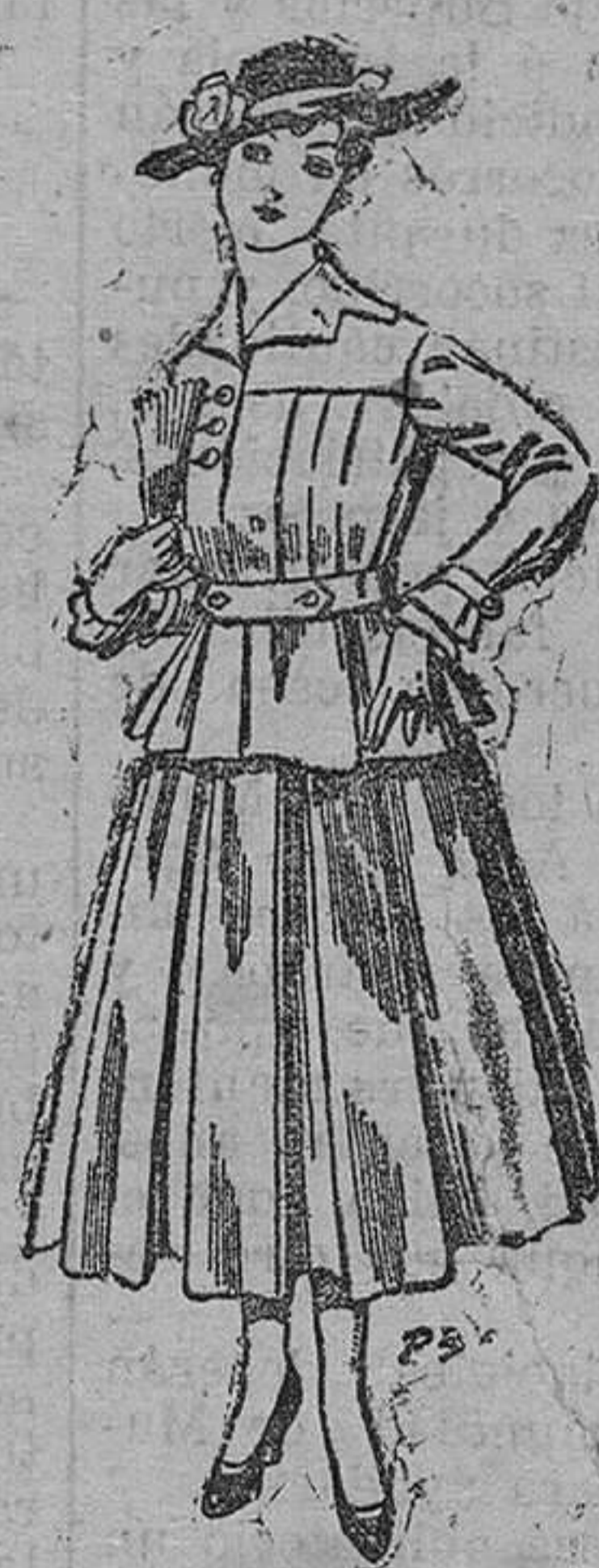
Trajes de lanilla negra, azul y color, para señora. A pesetas 105.