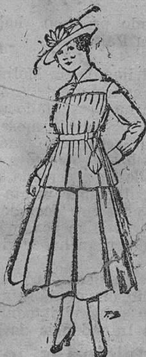
Trajes de lanilla, negra, azul y color, para jovencitas de 13 á 16 años. De pesetas 50 á 55.