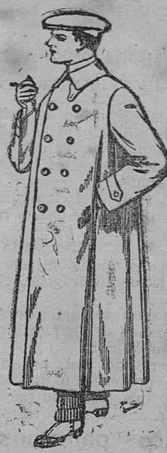
Guardapolvos de dril, crudo ó gris. De pesetas 12'50 á 30.