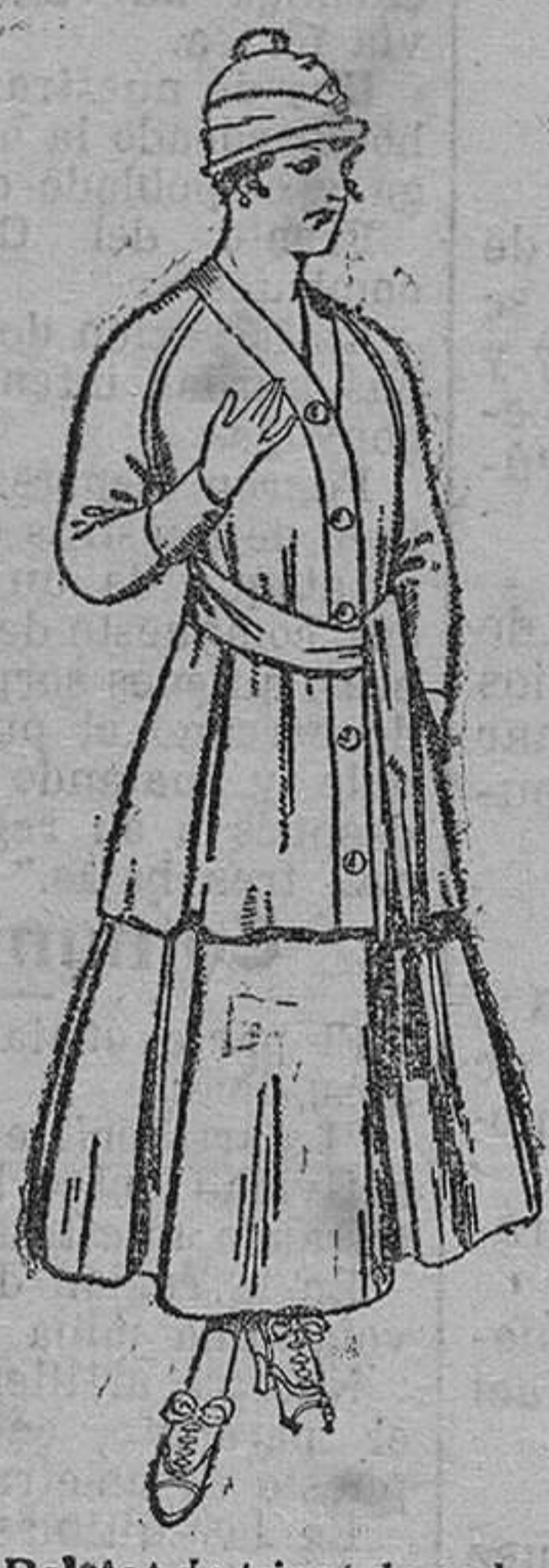
Paletot de tricot de seda, colores lisos. A pesetas 35.