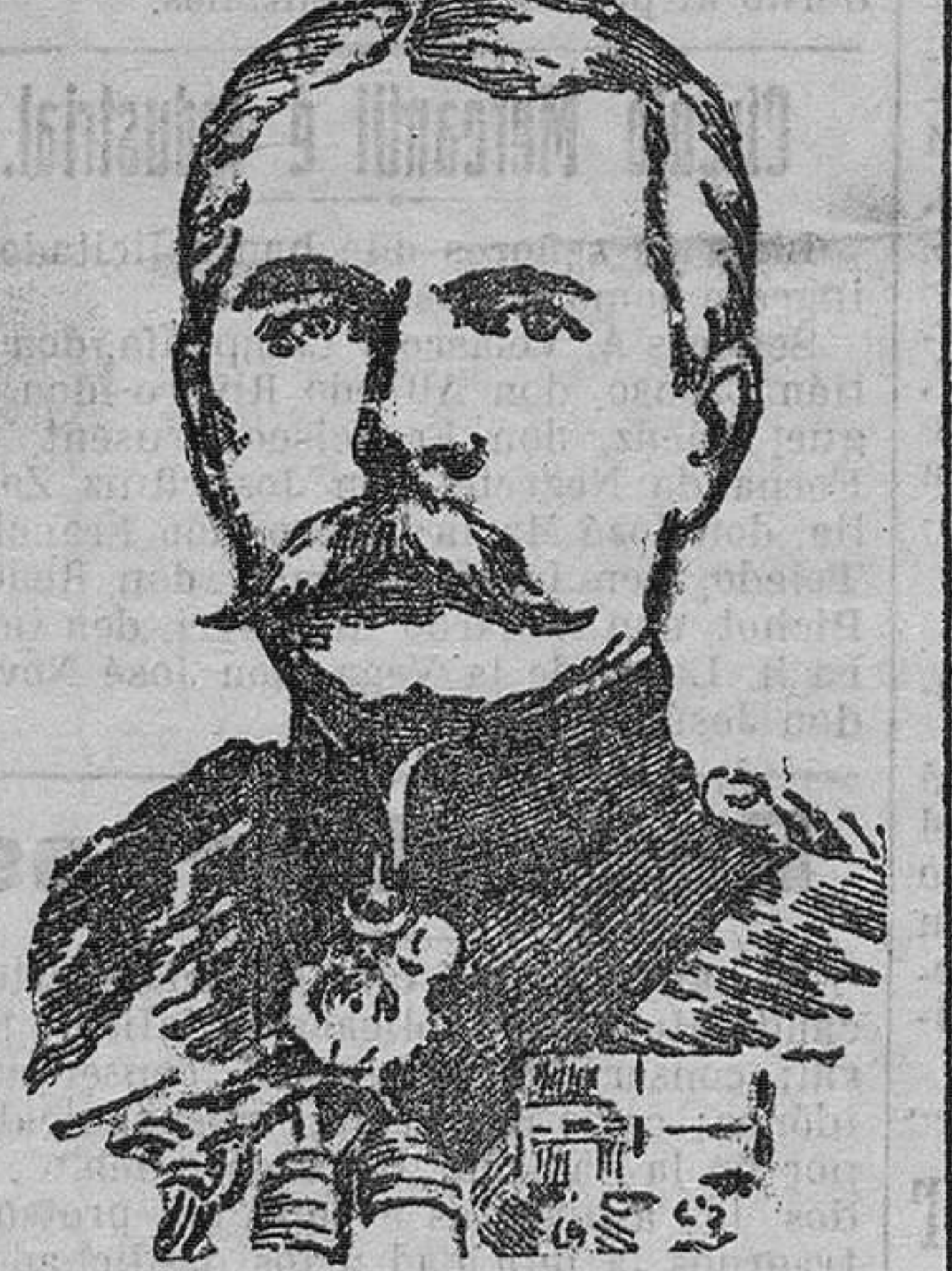
LORD KITCHENER, ministro de la Guerra británica, cuyo viaje a Oriente está siendo objeto de grandes comentarios en los centros políticos y militares de Europa.

POR EL ARTICULO 29. Concejales proclamados por el artículo 29 de la ley electoral, según datos recibidos ayer en el Gobierno: Peñarubia: cuatro liberales. Valdeolea: dos mauristas y tres demócratas. Voto: seis conservadores. Villafuere: cuatro conservadores. Alfio de Lloredo: cinco concejales de distintos partidos. Urdias: cuatro de distintos partidos. Entrambasaguas: tres conservadores, un liberal y un independiente. Puente Viego: dos conservadores y tres liberales. Meruelo: dos liberales, un conservador y un católico. Sobas: seis independientes. Colindres: cuatro conservadores y un liberal. Medio Cudeyo: seis concejales de distintos partidos. Esmorès: tres conservadores y dos liberales. Lamasón: cinco concejales de distintos partidos. Tudanca: dos liberales y un conservador. Comillas: cinco conservadores. Guriezo: seis liberales y un conservador. De los datos recibidos hasta ayer en el Gobierno civil, resultan proclamados por el artículo 29 cincuenta términos municipales de esta provincia 244 concejales clasificados de la siguiente forma: Conservadores 90; liberales 56; independientes 33; demócratas 10; mauristas 6; católicos 5; republicanos 1 y sin clasificar 43.