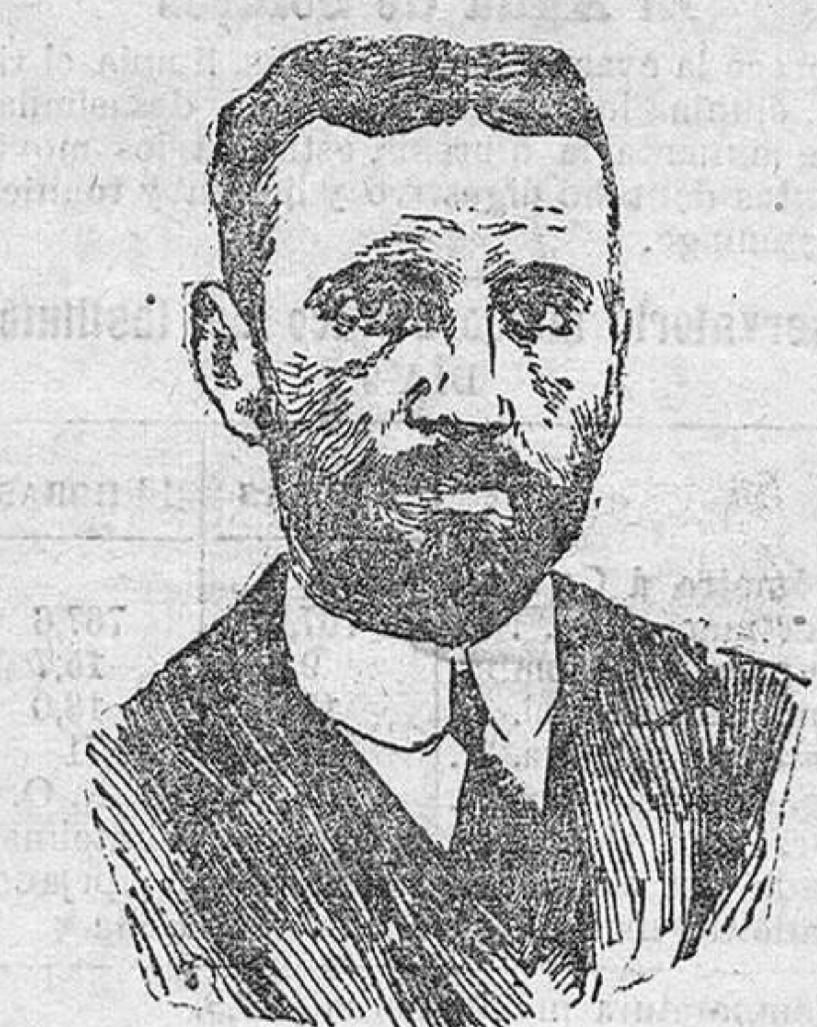
MARIO G. MENCAL NUEVO PRESIDENTE DE LA REPÚBLICA DE CUBA