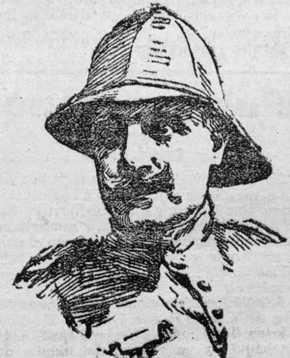
EL GENERAL JORDANA que ha sustituido al general Larrea en la Jefatura del Estado Mayor de la Capitanía general de Melilla