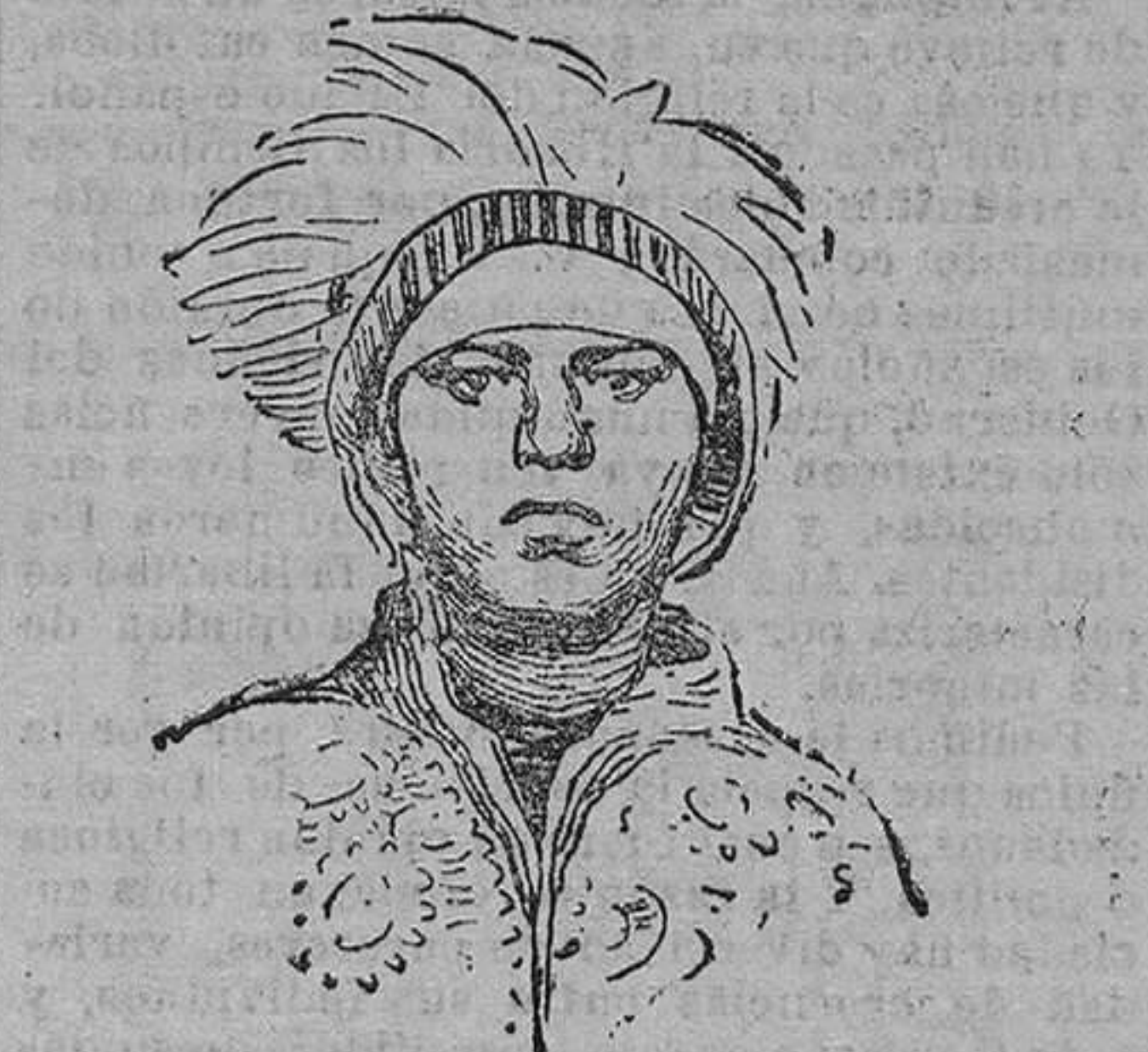
El príncipe heredero de Etiopía ó nuevo soberano

Así como en esta ocasión la noticia resulte cierta. En el próximo pasado noviembre, Menelik sufrió un ataque de parálisis que agravó de un modo alarmante su mal estado de salud. En tan gran peligro se creyó entonces su existencia, que inmediatamente comenzó á funcionar el consejo de regencia, y poco después, el ras Tassamma, nombrado tutor del príncipe heredero, hacia consagrar negus á éste, acto al que siguió una proclama que el emperador moribundo dirigió al pueblo abisinio, recomendándole