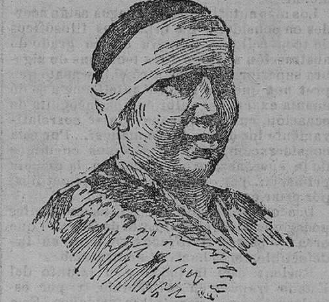
La emperatriz Taitu, esposa de Menelik

Como otras veces, se afirma que Menelik falleció hace unos días, y que su esposa, la emperatriz Taitu, ocultó la muerte para que