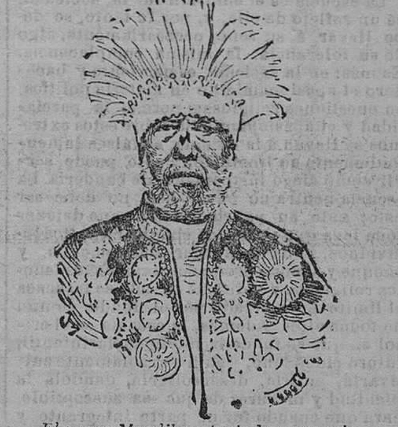
El negus Menelik en traje de ceremonia

En fin, que una vez más ha circulado por