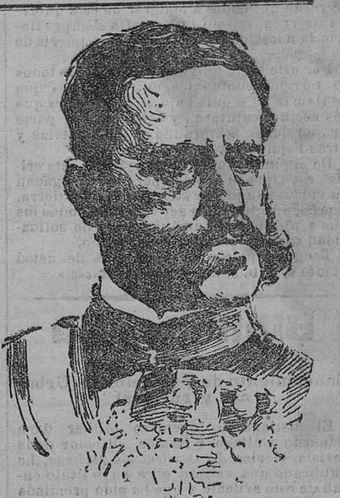
DON VALERIANO WEYLER nuevo Capitán general de Cataluña