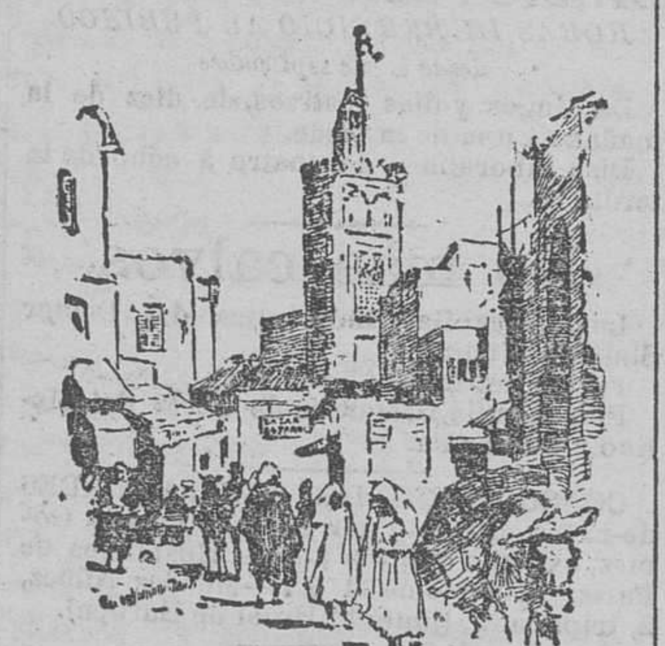
UN RINCÓN DE FEZ