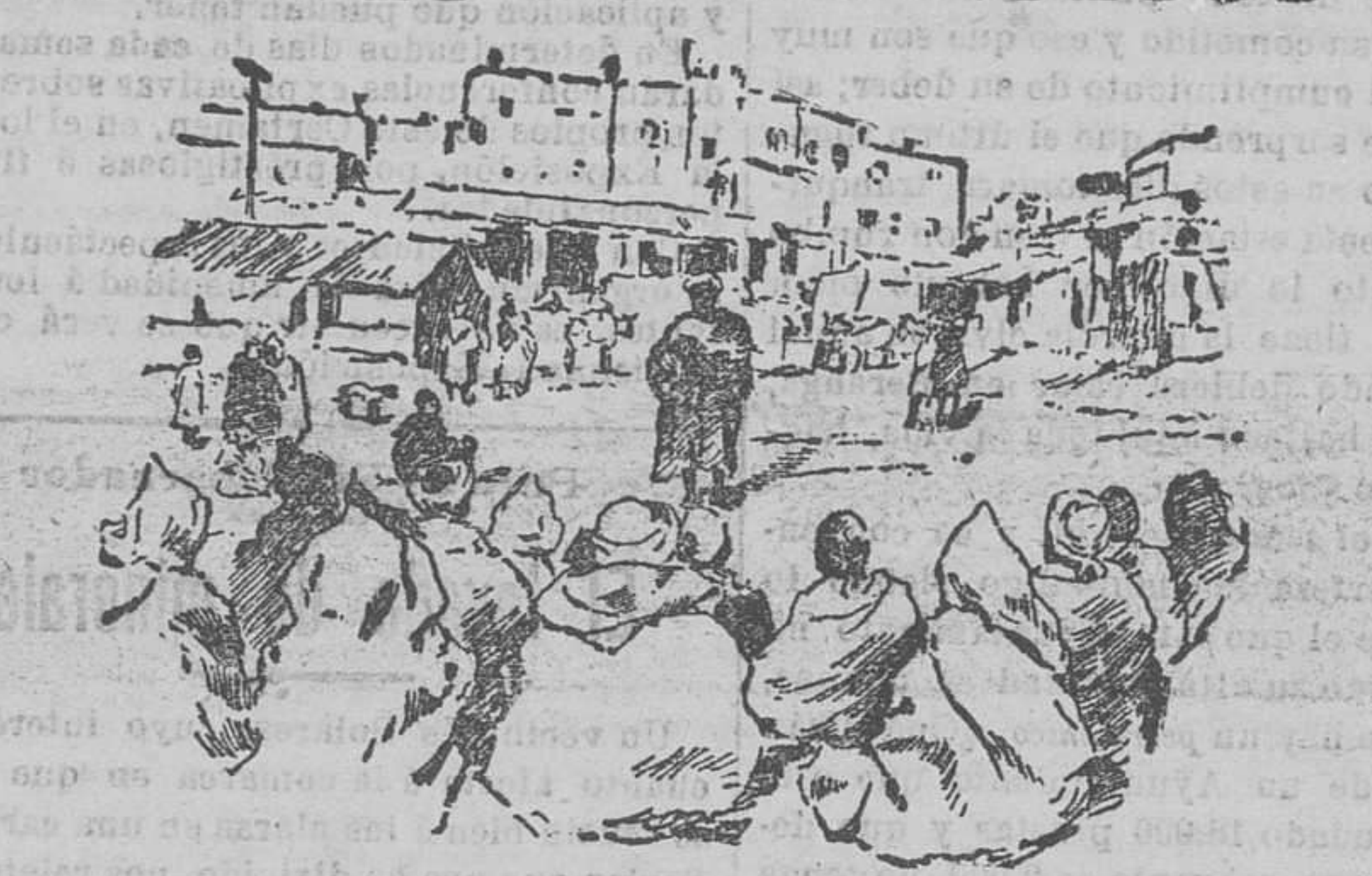
Un concierto musical en pleno zoco