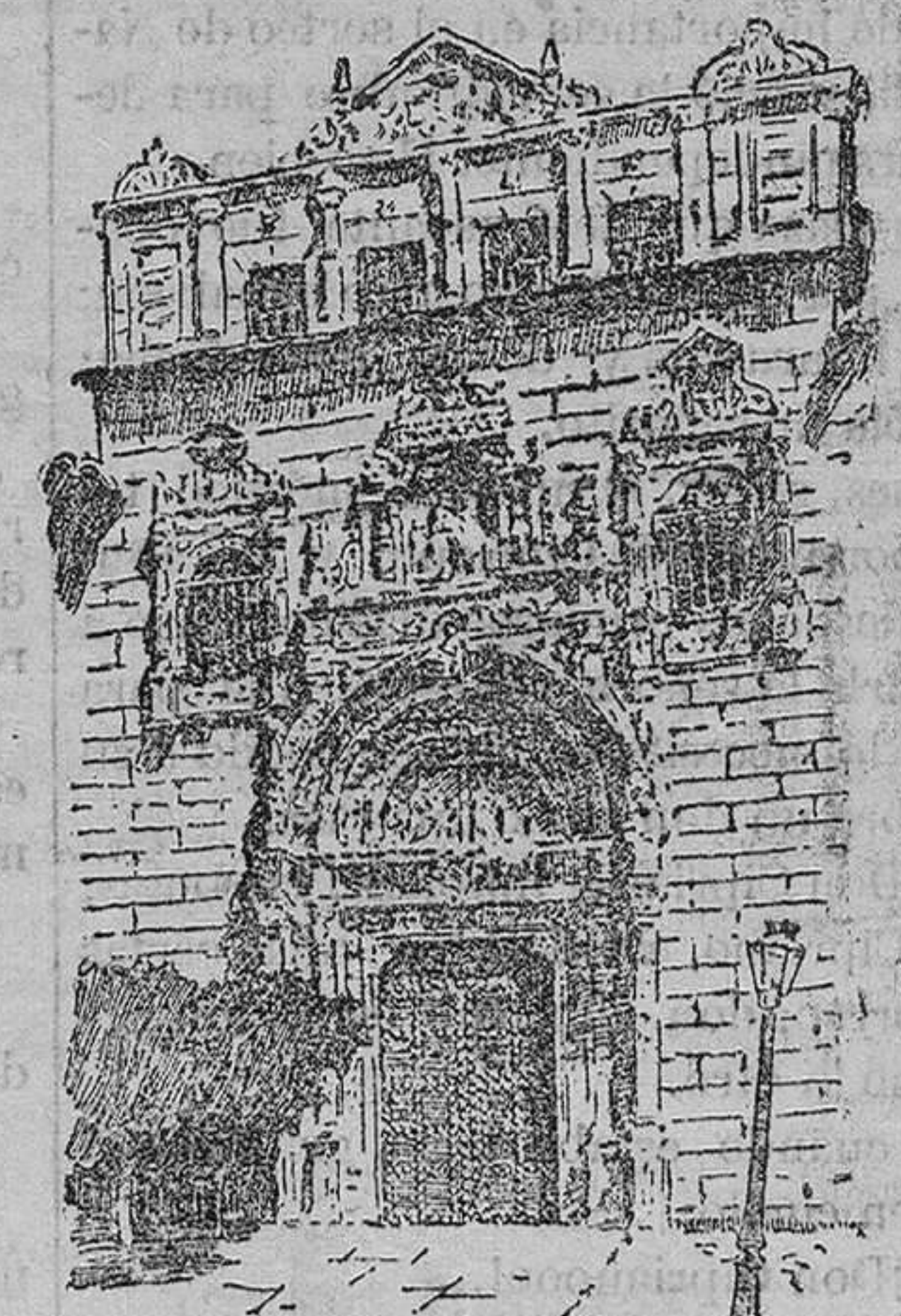
Fachada plateresca del Hospital de Santa Cruz del gran peñasco en que se asienta Toledo, lo que da poca estabilidad á este hermoso edificio de estilo plateresco que continuamente se ha venido reparando inútilmente, debido, acaso, á no haberse nunca emprendido las obras por completo, de una vez, con la necesaria amplitud.

El Hospital de Santa Cruz sabido es que está edificado en el declive Septentrional