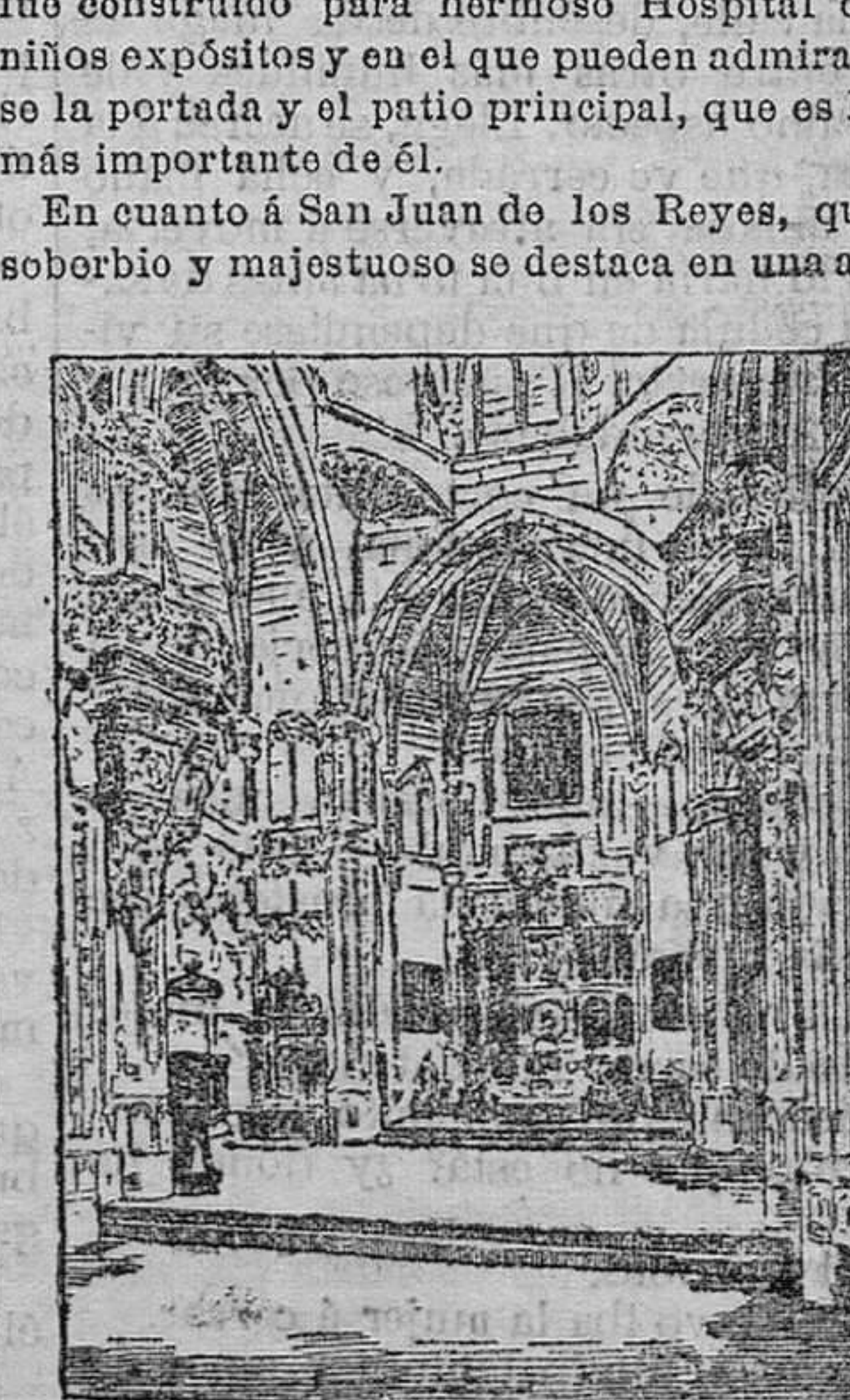
Interior de la Iglesia de San Juan de los Reyes de la parte occidental de Toledo, no parece correr mejor suerte, y si Dios no lo remedia, la espléndida joya construida por el voto que los Reyes Católicos hicieron por la feliz terminación de la guerra promovida por Alfonso V de Portugal y los partidarios de la Beirra , concluida en la bata-

En cuanto á San Juan de los Reyes, que soberbio y majestuoso se destaca en una al-