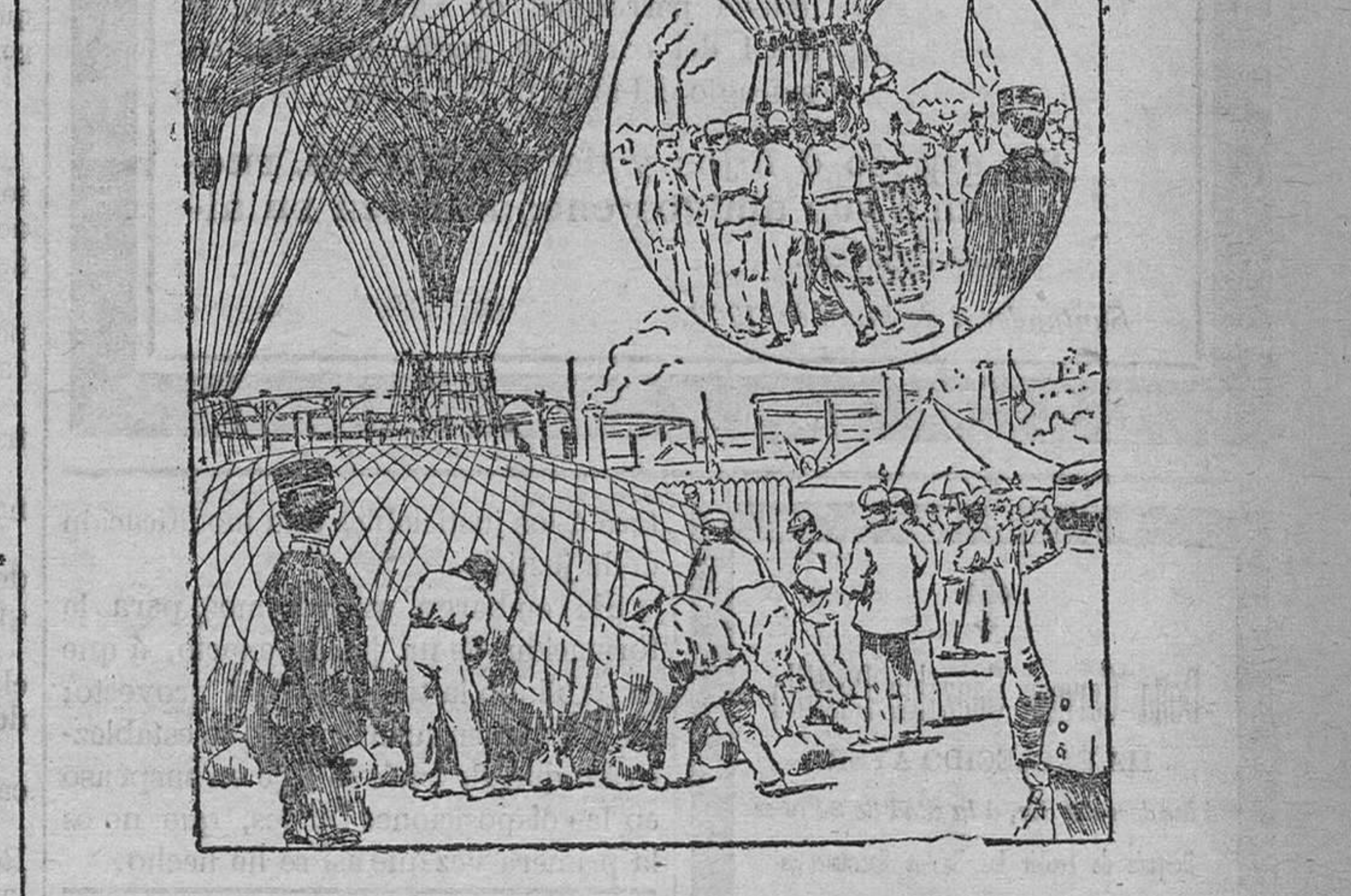
El polígono del Real Aero-Club durante los preparativos para la elevación de los globos

Café Cantabro Grandes comedidos tarde y noche por un notable sexteto. Centro Obrero El domingo dará una velada dramática la Sección Artística en el teatro del Centro Obrero, Animas, 12, á las ocho y media de la noche, poniéndose en escena la comedia de don Pablo Parrella El Himno de Riego .